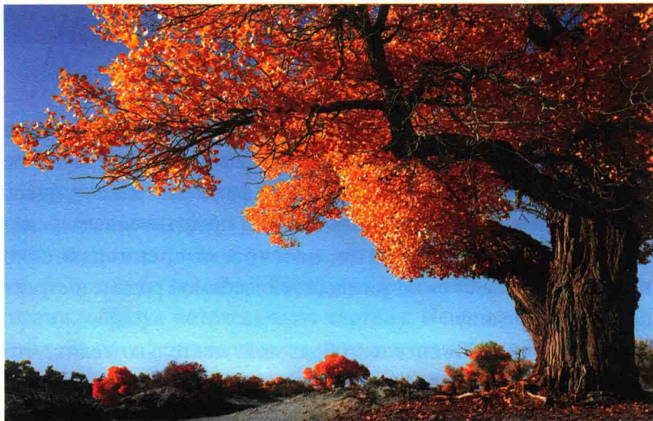
Динамичная жизнь в пустыне — евратский тополь

Синьцзян содержит многочисленные «самый». Мы продолжаем говорить о иероглифе «疆», направо этого иероглифа имеются «Три горизонтали и два поля», что образно обобщает рельеф Синьцзяна. Три «горизонталы» с севера на юг