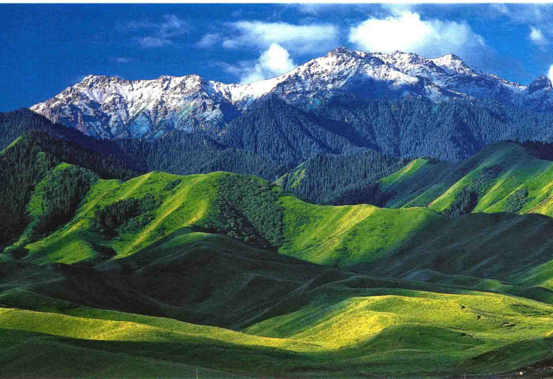
Грандиозный вид гор Тяньшань

людей. Специфика, разнообразность, последовательность, открытость и комплектность — этими считается блестящая увлекательная культура на этой волшебной земле Синьцзяна.