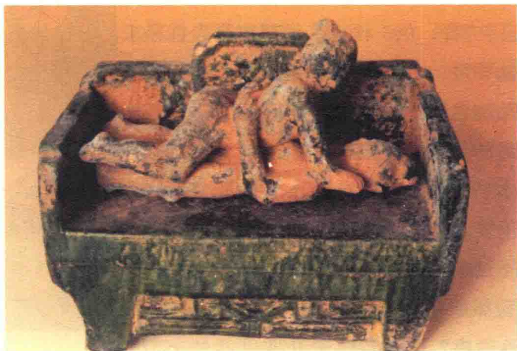
绿釉交合床 (汉代) ▶

它的确是真理，不论是古人还是今人，不论是中国人还是外国人，“饮食”和“男女”都是生活两大最基本的需要，人们都要靠饮食来维持生存，靠性来繁衍后代，这两大需要是人的本能、本性，二者但缺其一，则人类早就绝种了。