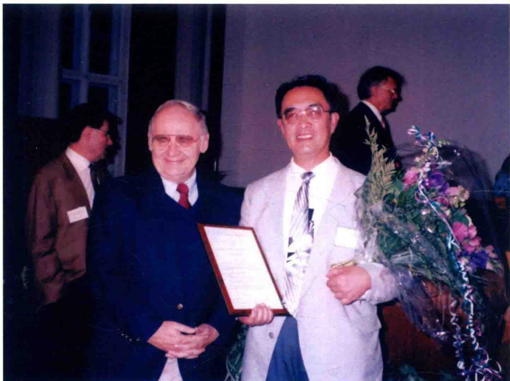
▲ 第一次得国际奖——“赫希菲尔德国际性学大奖”（1994年8月，德国柏林）