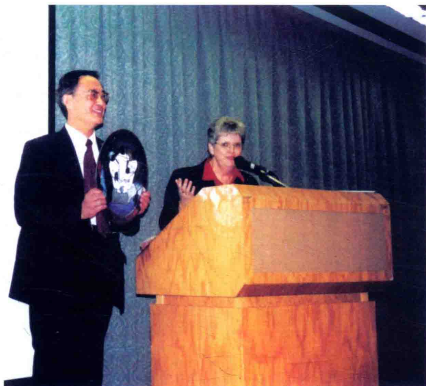
◀ 第二次得国际奖——“巩固与优化家庭国际奖”（2001年5月，美国纳伯拉斯加）