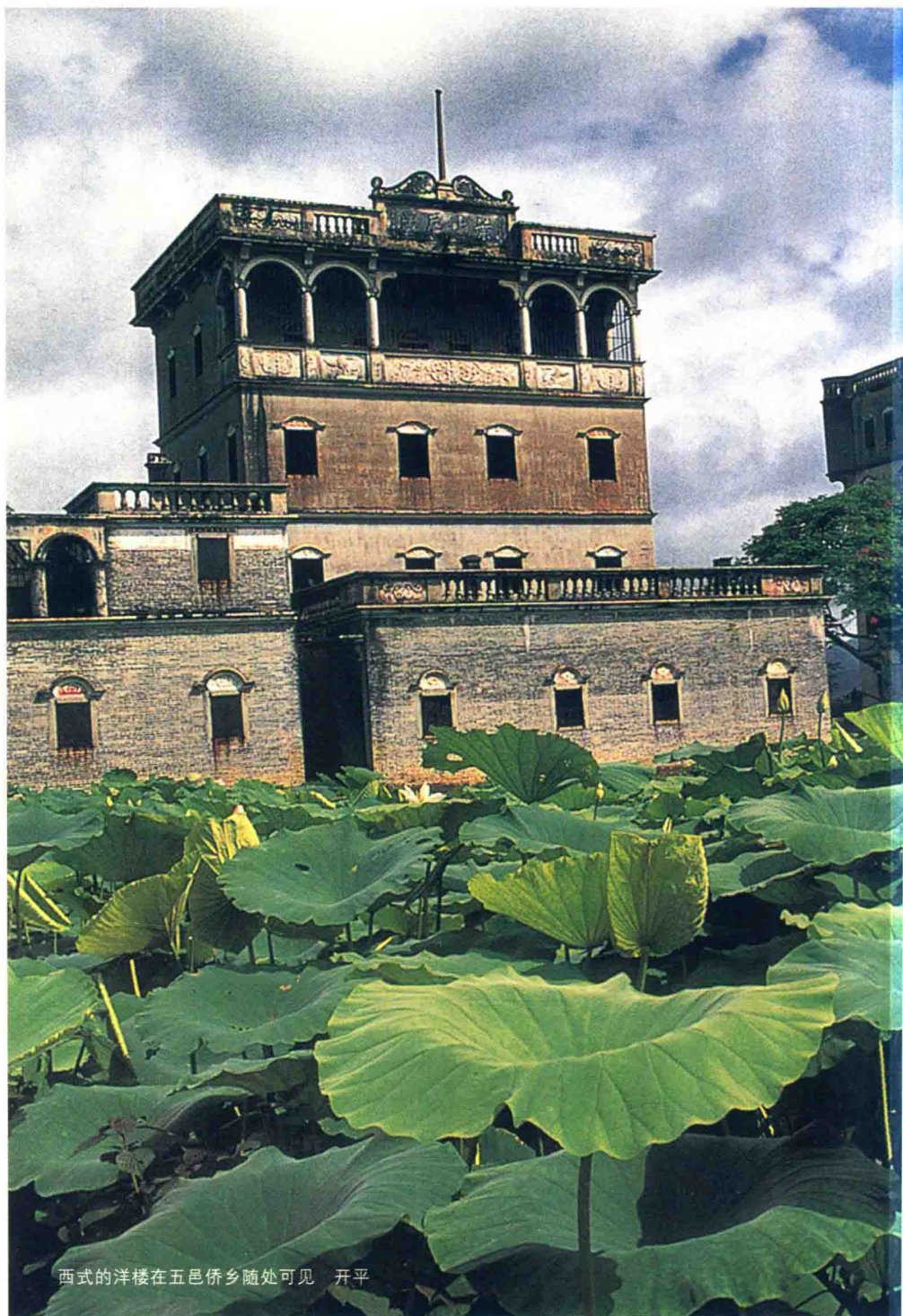
西式的洋楼在五邑侨乡随处可见 开平