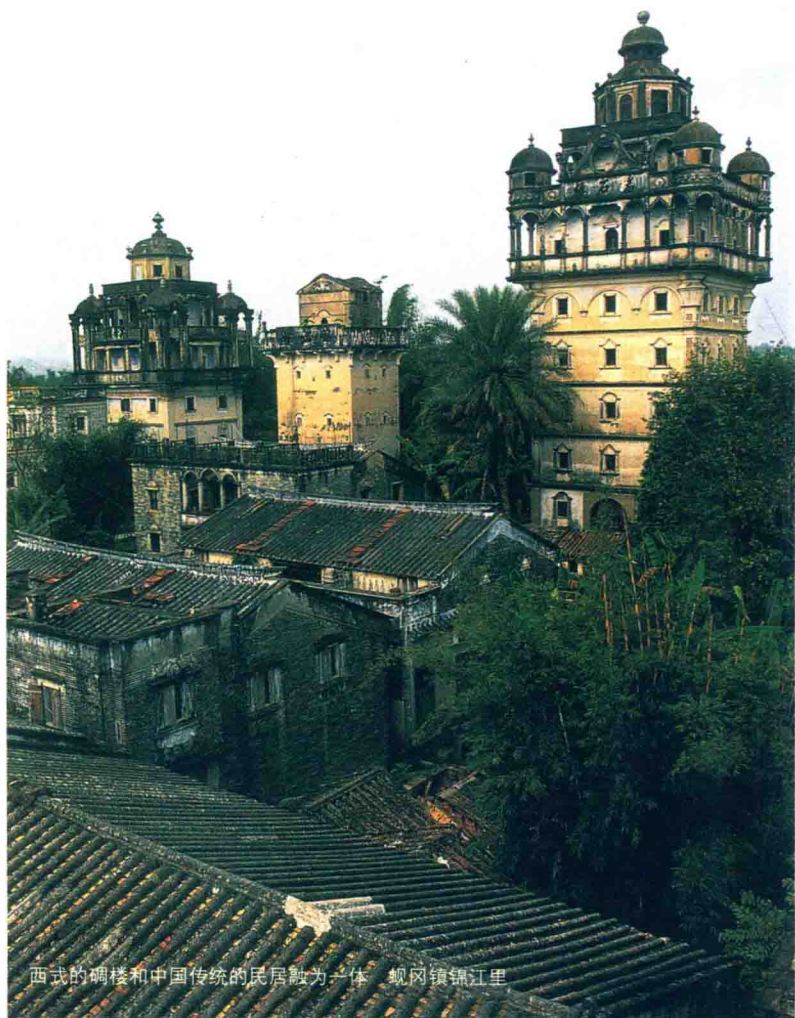
西式的碉楼和中国传统的民居融为一体 蚬冈镇锦江里

也是难以在异国社会的底层生根、发展的。面对海外亲人传送回来的西方文化，五邑民众同样表现出了开放的心态，自觉积极地予以接受，把它融入自己的日常生活。五邑乡村的这种接纳态度与近代“向西方学习”的社会思潮是合拍的，它导致人们的生活方式、思想观念、宗教信仰以及经济关系、宗族关系发生变化，民众生活在一种新旧碰撞的文化状态之中。相互竞争攀比，炫耀个人财富，张扬个性自由，追求西方生活方式的倾向与守望相助，强调集体意