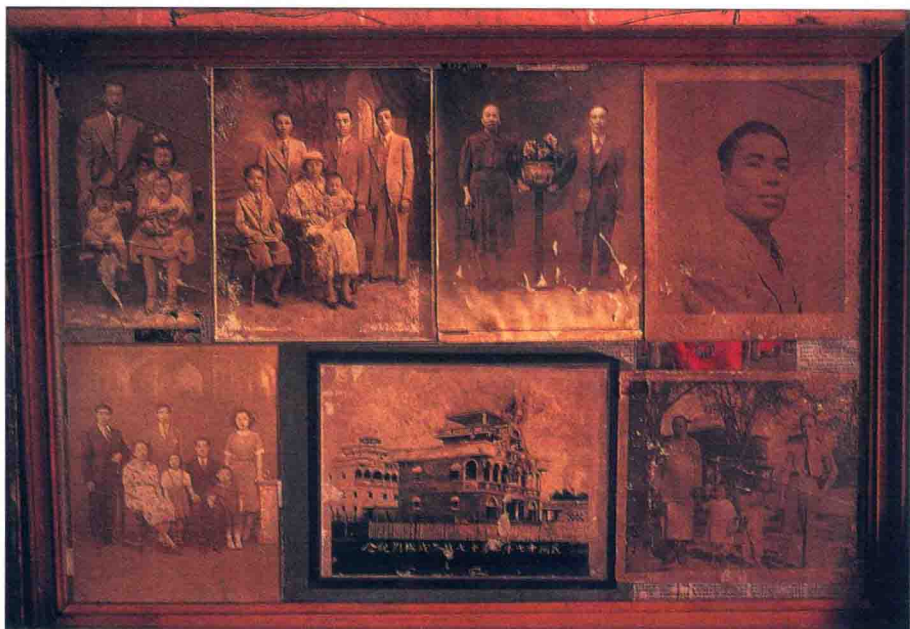
老屋里几乎都有这样的镜框，让乡亲天天与海外的亲人见面

为什么五邑的海外移民主要分布在美国和加拿大，而福建、广东沿海其他侨乡的海外乡亲则集中在东南亚？