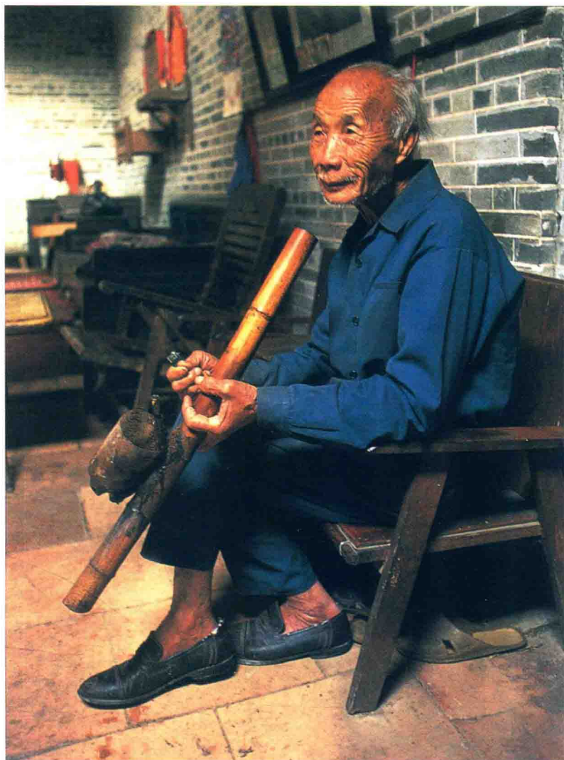
老人们还没有丢掉岭南传统的生活习惯 台山

淘金、修铁路的人多数是五邑人，家人串家人、亲戚串亲戚、乡亲串乡亲，于是五邑地区的移民方向发生了变化。这是资讯落后的传统社会常见的移民机制，即使在今天国内的民工潮中，民工流向的区域性仍然受到这一机制的制约。