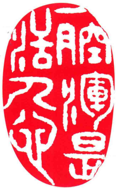
彩图 9 新安郑氏喉科“一腔浑是活人心”处方印