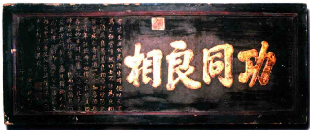
彩图 5 清道光新安婺源儒医汪启时受赠“功同良相”匾