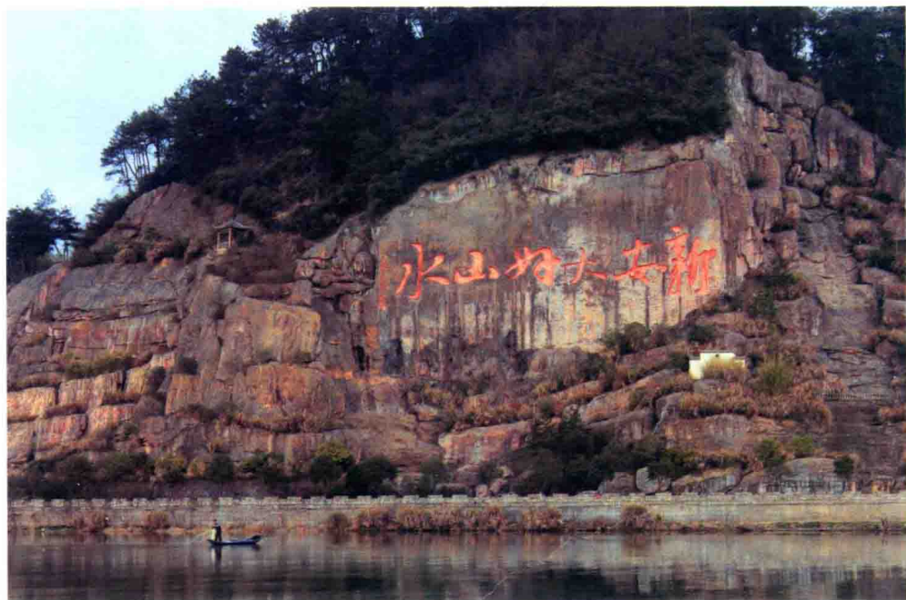
彩图 10 南宋朱熹手书“新安大好山水”摩崖石刻