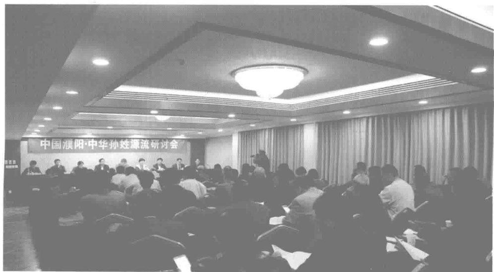
中国濮阳·中华孙姓源流研讨会会场