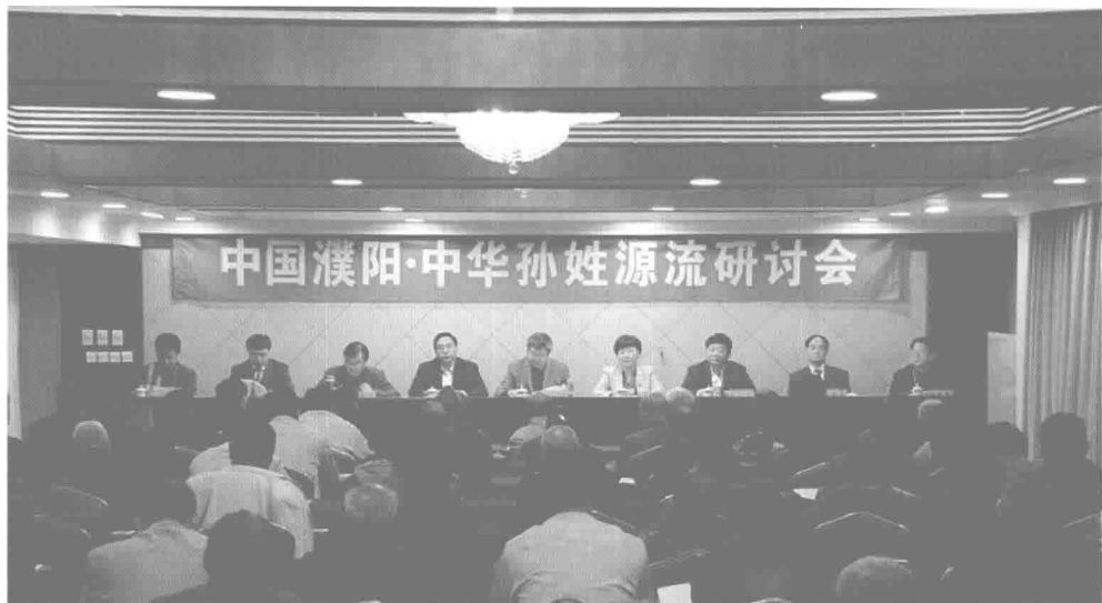
中国濮阳·中华孙姓源流研讨会开幕式现场