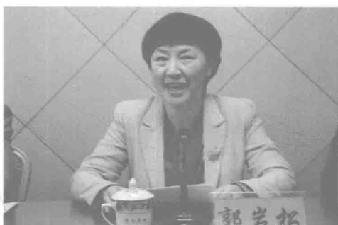
濮阳市委常委、宣传部部长郭岩松致辞