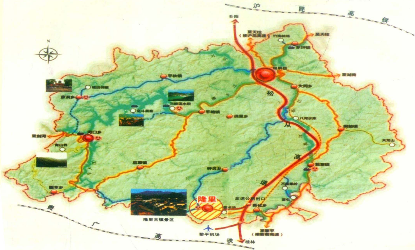
隆里古城地理位置示意图