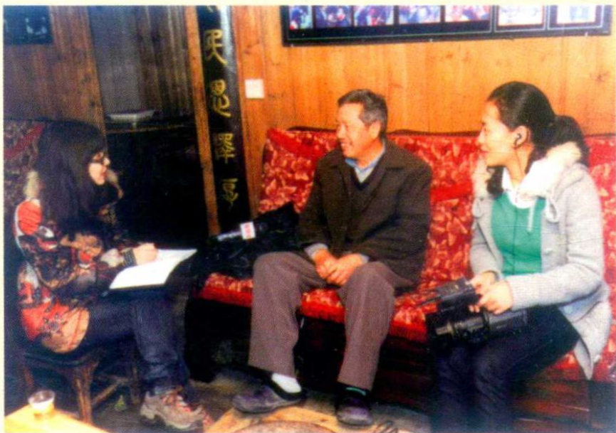
2010年11月，编者接受新华社对外宣传小分队记者采访。