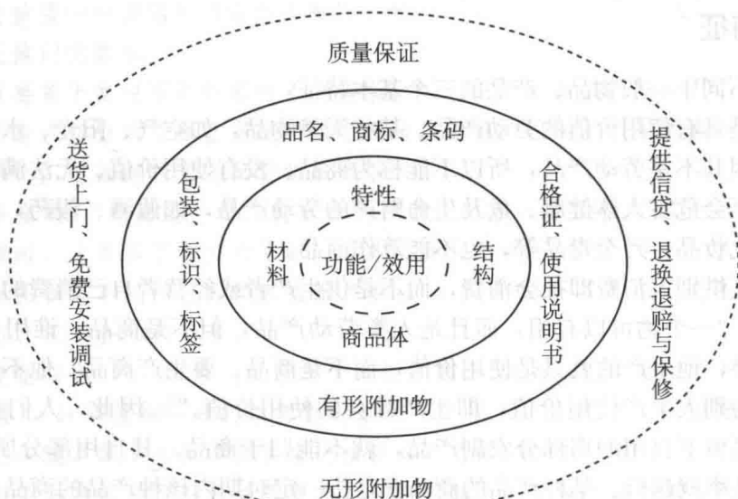
图 1—1 商品概念模型——商品球示意图