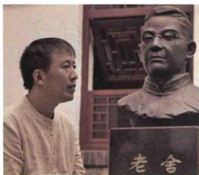
魏新，文化学者，全国青联常委， 央视《百家讲坛》主讲人。