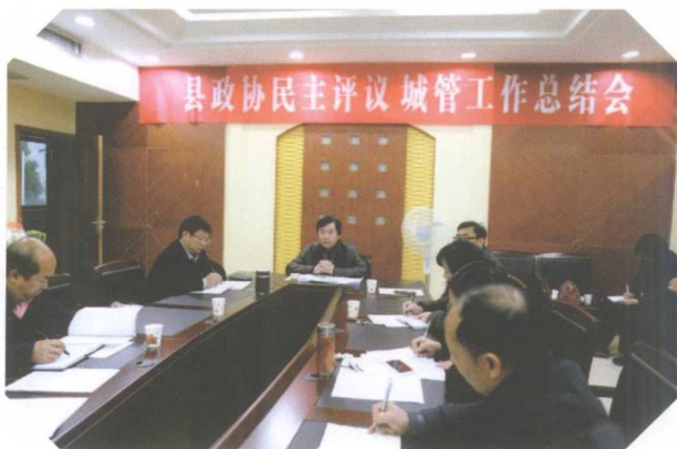
县政协民主评议城管工作