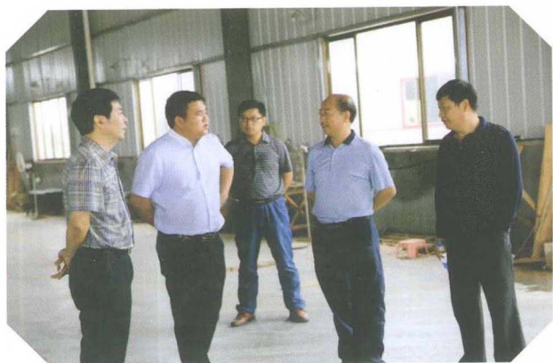
视察创新创业园“135”工程建设工作