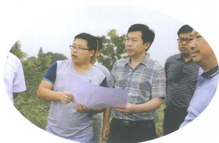
视察城市饮水工程