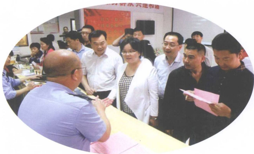
县委唐军书记一行考察调研广州花都流动党工委运转情况

2015年，在市委组织部和县委的坚强领导下，全县组织工作主动聚焦聚力，服务中心大局，落实管党治吏责任，忠诚履职履责，全县组织工作呈现出风清气正、激情干事、创新创业的良好发展态势。“严以修身、严以律己、严以用权”三个专题研讨学习和“一进二访”专题活动扎实开展，“守纪律、讲规矩”特色专题活动经验做法在《湘组信息》《湖南日报》宣传推介；在全市率先完成12个乡镇领导班子考察和调整工作；强化干部监督，创造性地将新提拔干部报告个人有关事项延伸到科级干部；创新“互联网+党建”打造了“新田智慧党建”云平台，打造模范支部40个，软弱涣散村完成整顿转化任务38个，建立流动党员定期服务机制和“两地共建共管”机制，特色做法被评为“2015年广东省社会治理十大创新奖”。