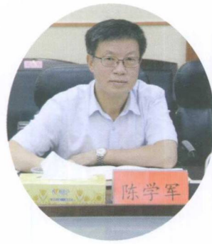
人大常委会副主任陈学军