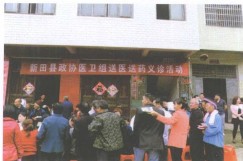
县政协“委员服务日”活动