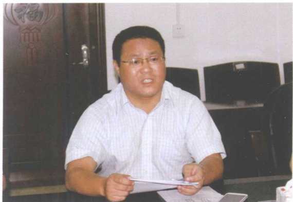
县委常委、常务副县长唐晓波