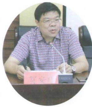
人大常委会副主任贺安祥