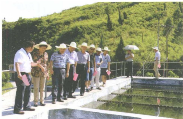
8月6日市人大常委会主任曹桂秀一行视察县水利工作