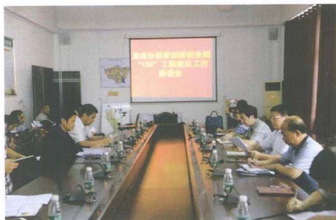
视察创新创业园“135”工程建设