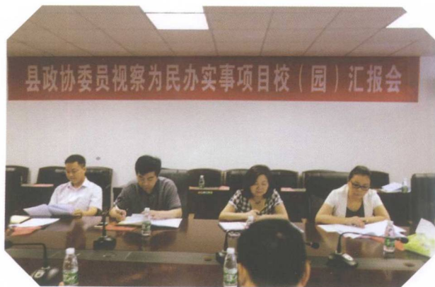
县政协视察中小学为民办实事项目建设