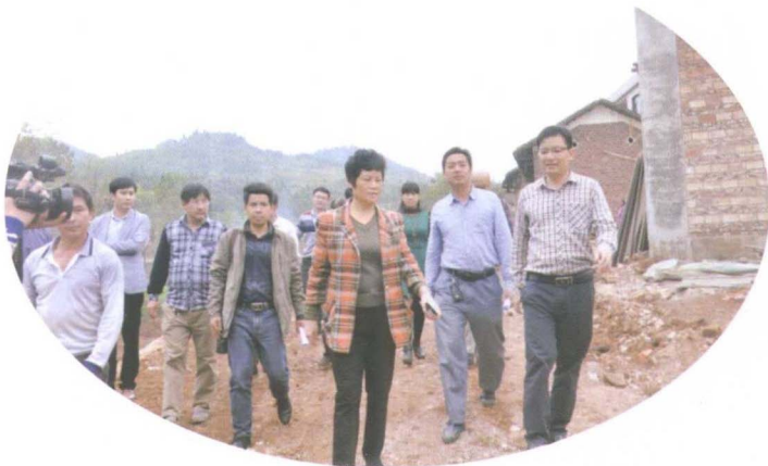
11月9日县人大“一进二访”及农村淘宝招募会