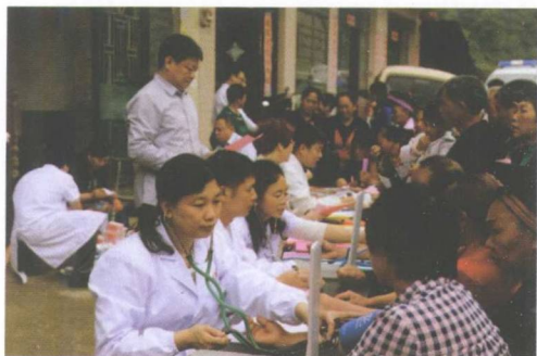
县政协“委员服务日”活动