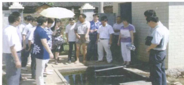
县人大开展水污染执法检查