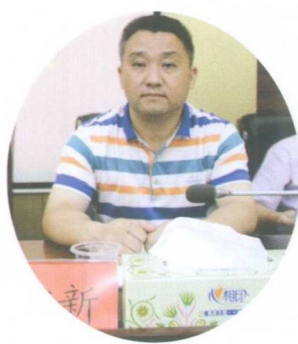
人大常委会副主任郑智新