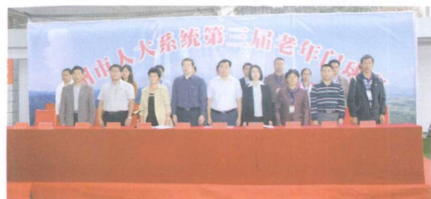
永州市人大系统第三届老年门球赛