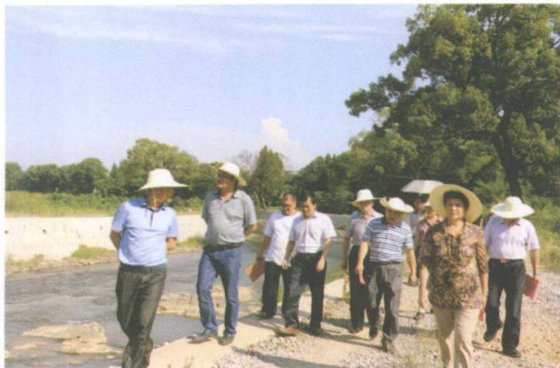
8月6日县人大视察水利工作