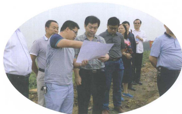
视察城市饮水工程