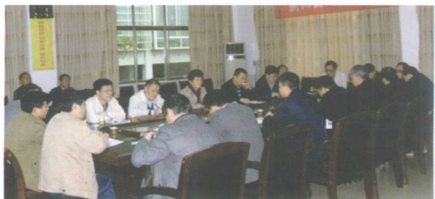
县人大视察创卫工作进展