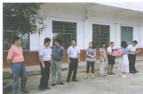
视察学前教育及合格学校建设