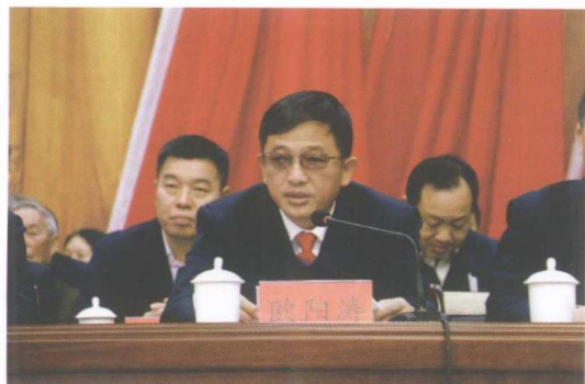
县委常委、政法委书记欧阳涛