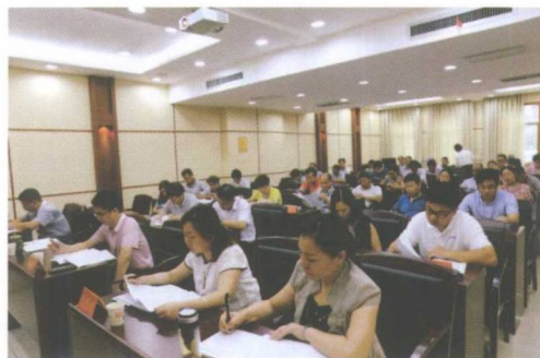
县政协常委会集中学习