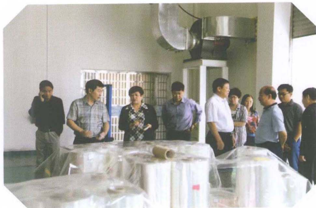
视察创新创业园“135”工程建设