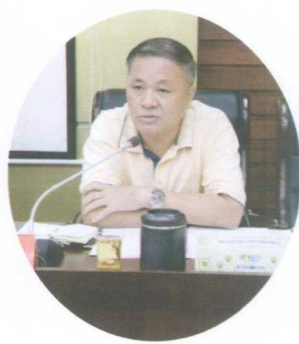
人大常委会副主任刘小平