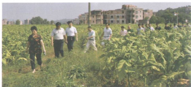
县人大视察烤烟种植