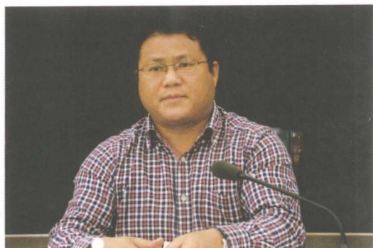
县委常委、常务副县长唐晓波