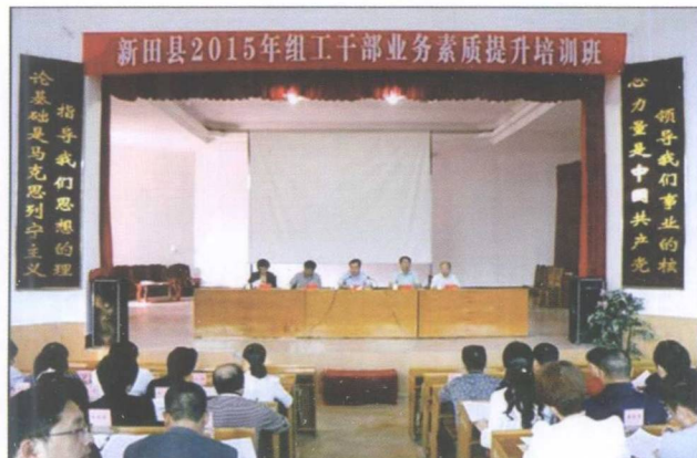
组工干部业务素质提升培训