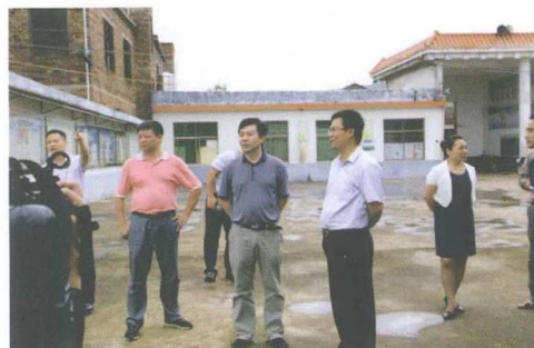
视察学前教育及合格学校建设