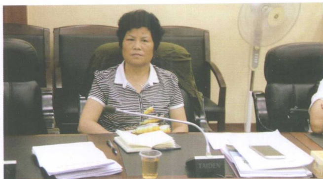
人大常委会主任曹桂秀