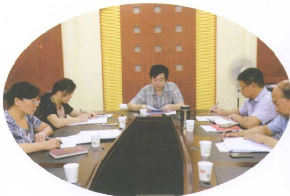
县政协主席会议研究创国卫工作

政协新田县委员会成立于1984年4月。现有委员界别13个，政协委员158人。机关内设机构有“一办三室”（办公室、提案法制群团委员会、经济科技人口资源环境委员会、学习文史宣教卫体民族宗教三胞联谊委员会），设党组一个，机关党支部两个，现有中共党员31名，干部职工39人（含离退休人员）。2015年，在中共新田县委的领导下，县政协始终高举社会主义和爱国主义两面旗帜，牢牢把握团结和民主两大主题，坚持“长期共存，互相监督，肝胆相照，荣辱与共”的基本方针，紧紧围绕中共新田县委、县人民政府的中心任务，服务工作大局，认真履行政治协商、民主监督、参政议政职能，为促进全县三个文明建设，推动社会发展和进步，维护人民团结和社会稳定，作出应有贡献，发挥不可替代作用。