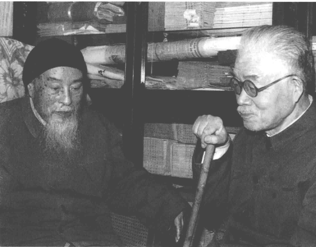
20 世纪 80 年代后期，冯友兰与哲学家张岱年合影。