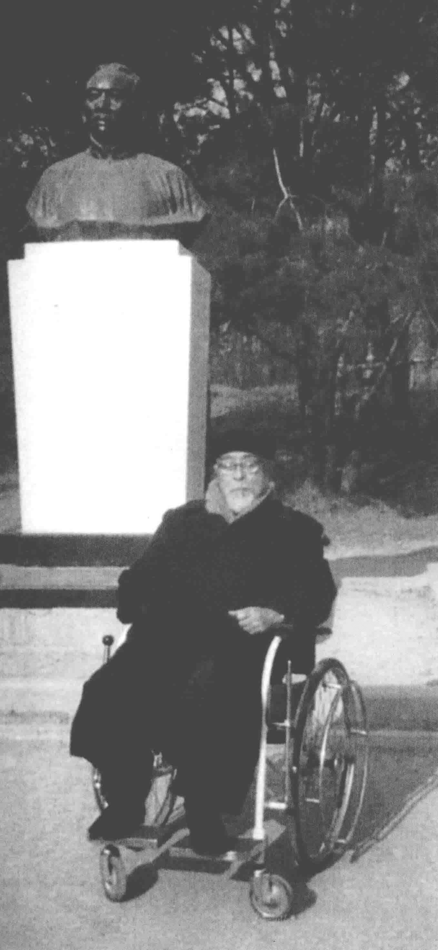
1989年，冯友兰在北京大学蔡元培雕像前。