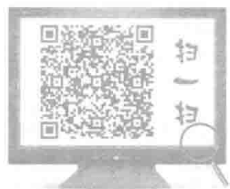
中国最早的马克思主义者——李大钊

中国共产党从成立之日起，就把马克思列宁主义确立为指导思想，并坚持把马克思主义基本原理同中国具体实际相结合，领导全国各族人民取得了革命、建设和改革的伟大胜利，在 90 多年的奋斗、创造和积累过程中，形成了两大理论成果：毛泽东思想和中国特色社会主义理论体系。党的十八大以来，习近平总书记鲜明提出新形势下党治国理政的一系列重要方略，特别是全面建成小康社会、全面深化改革、全面依法治国、全面从严治党的战略布局，开拓了马克思主义发展的新境界，是中国特色社会主义理论体系的最新成果，是指导具有许多新的历史特点的伟大斗争最鲜活的马克思主义。