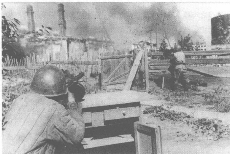
1942年，苏联红军在被包围的列宁格勒市郊与德军交火

希特勒甚至曾下令将列宁格勒夷为平地，也许因为它曾经是革命的起源地，也许因为它桀骜不驯地诠释了“斯拉夫人的天分”：在建筑领域，它没有任何需要羡慕德国柏林的地方。战争的苦难使列宁格勒与它的每一块石头血肉相连。人民用尽一