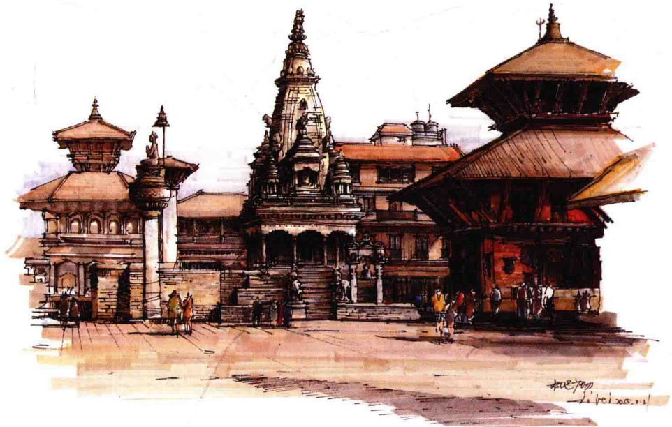
图 1-6 尼泊尔杜巴广场马克笔写生 作者：李磊