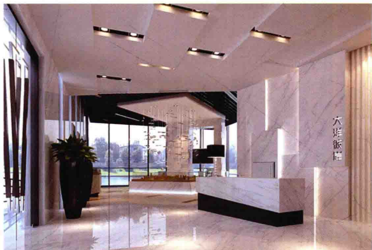
图 1-3 售楼处空间效果图素材

照片临摹属于作品临摹的进阶，当初学者有了一定的手绘基础之后，就可以对照照片进行练习。这也是学习手绘的有效途径之一。因为照片上没有明显的线条，无法像临摹作品那样完全描摹和抄袭，它需要绘制者进行分析和提炼，凭借手绘基本功对空间和画面进行重新组织，并清晰地反映在图纸上。初学者可以从相关设计书籍以及网上去寻找需要绘制的照片来训练，需注意的是，图片中大多都是电脑效果图或者实景照片，属于写实效果，因此在绘制时一定要提炼场景中的主要元素进行重点表达，同时还要抓住空间结构，将复杂的形体进行概括处理，而那些相对次要的部分或者是遮挡住主体的“障碍物”，我们一般会将其省略处理。记住千万不要完全地照抄照片，那样会事倍功半，降低工作效率（图 1-3、图 1-4）。