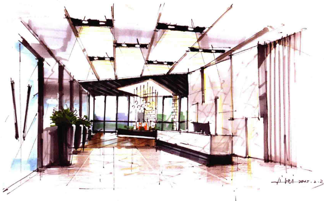
图 1-4 照片临绘 作者：李磊