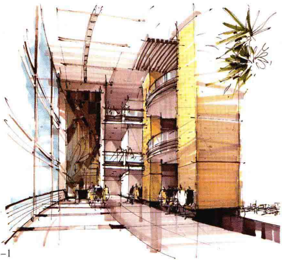
图 1-1 临摹作品 作者：赵国斌

图 1-1、图 1-2 是学生在课堂上画的临摹作品，仔细观察便会发现，它们和临摹的原图存在着区别，但是借鉴了原图用线、着色和笔触的方式，通过临摹，可以将大师作品的精髓运用到自己的作品中，为以后的创作打下基础。