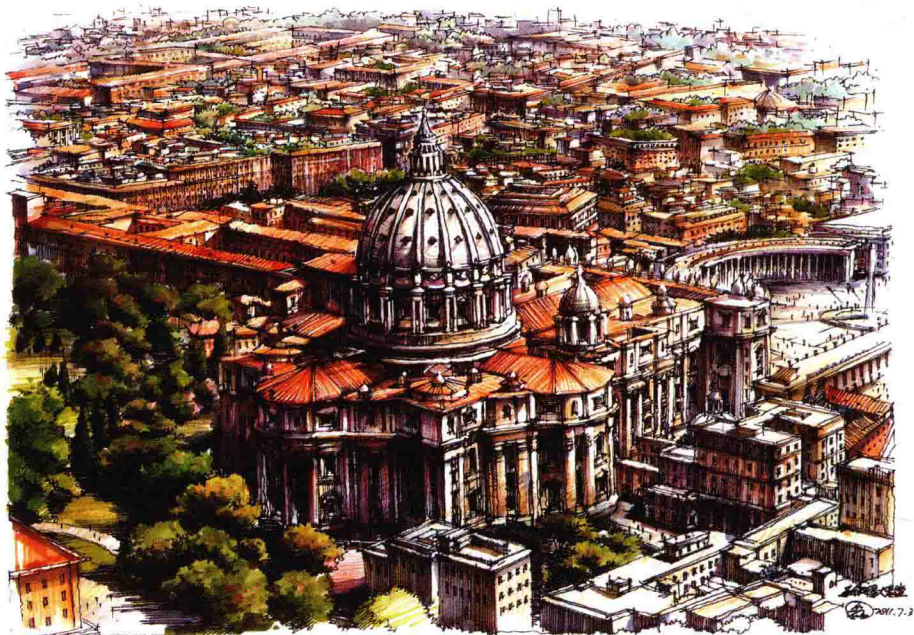
图 1-5 圣保罗教堂马克笔写生 作者：李磊

通过写生，可以训练绘制者组织画面的能力，同时还可以设身处地地去理解真实空间，体会空间的尺度感，并提高观察、感受、形象记忆和概括表现能力。从写生中来获取处理画面的能力和经验，能够帮助设计草图的场景表现更加合理，造型结构更准确且风格更具独创性。因此，写生训练也是培养设计手绘表现不可缺少的一种手段，希望学习者加以重视（图 1-5、图 1-6）。