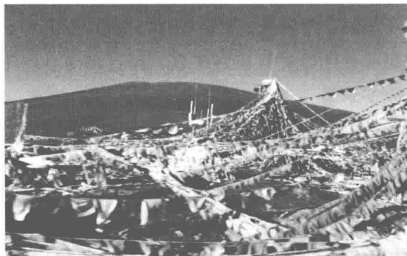
巴颜喀拉山口的经幡