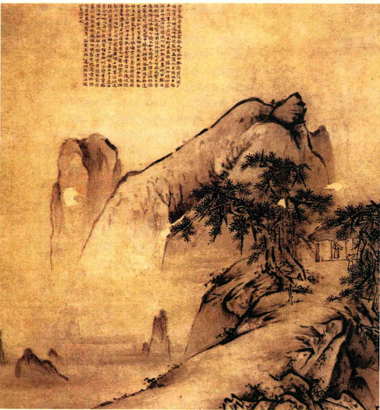
◆ 明 王履 《华山图册》