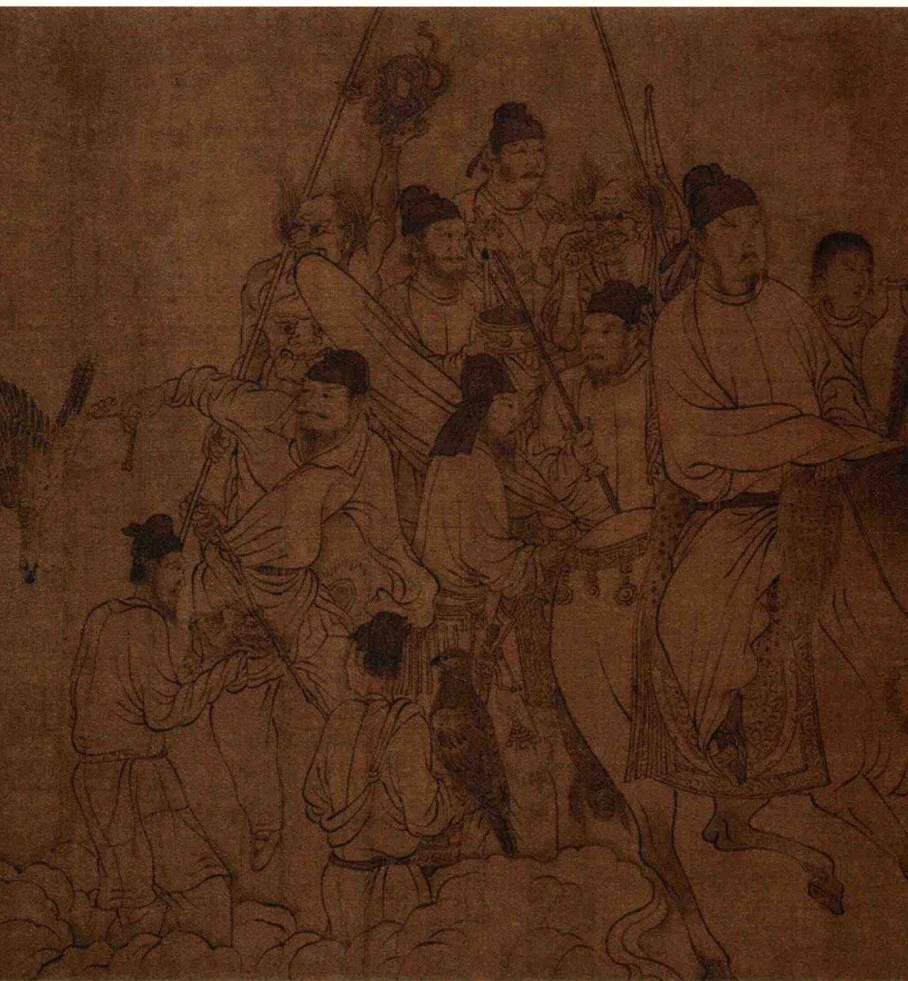
◆ 北宋 李公麟 《西岳降灵图》