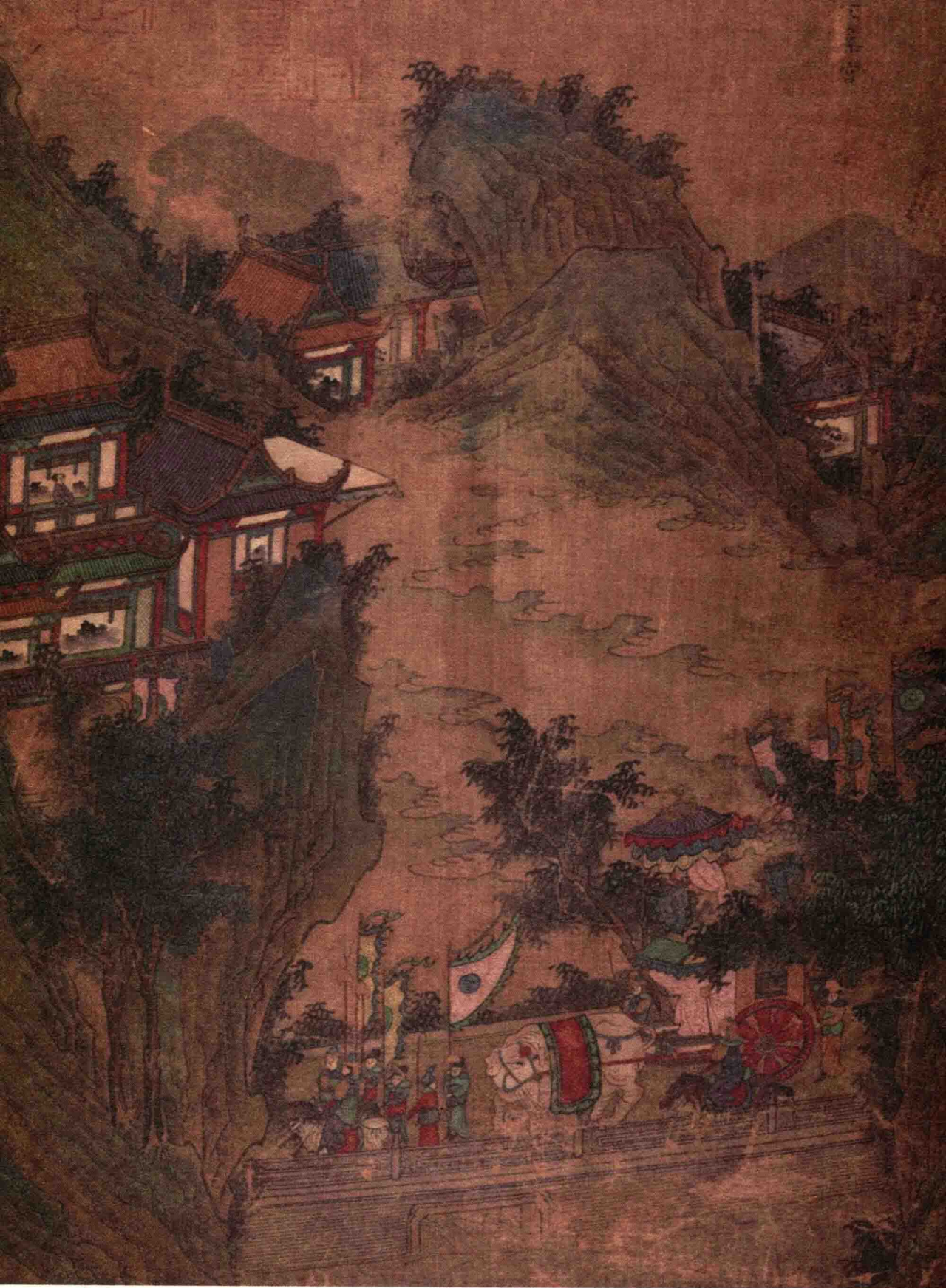
◆ 唐 李思训 《长安官阙图》