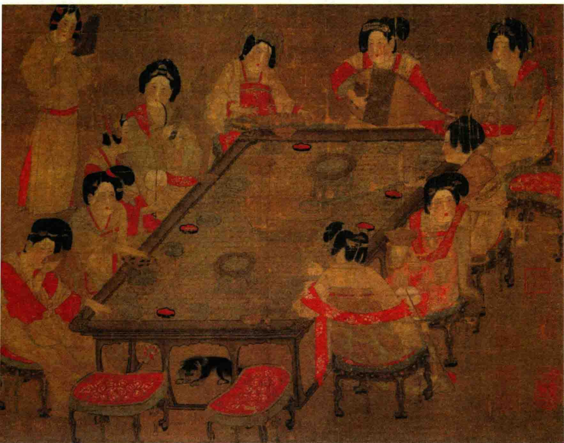
◆ 唐 佚名《唐人宫乐图》