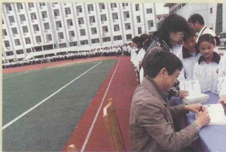
为一所中学的学生签名