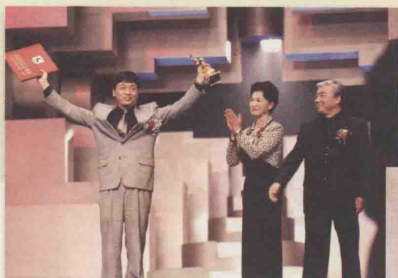
1999年在中国电影金鸡奖颁奖现场