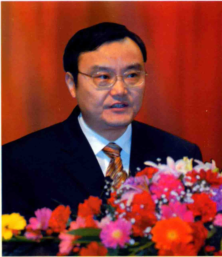
中共宜春市委副书记 宜春市人民政府市长 龚建华

今后五年全市经济社会发展的总体要求是：以邓小平理论和“三个代表”重要思想为指导，以科学发展观统领经济社会发展全局，以大开放为主战略，以工业化为核心，全面落实“在全省整体实力前移、局部工作前列”的总体部署，深入推进“心圈廊”的发展构想，突出决战工业园、建设新农村、做大市本级，把我市建设成为产业集群的新型工业基地，实力雄厚的县域经济强市、环境优雅的生态休闲城市、人民群众安居乐业的和谐之地，全力打造实力宜春、活力宜春、魅力宜春、和谐宜春。