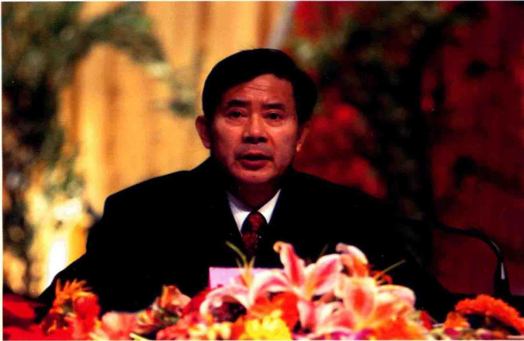
中共宜春市委书记 宋晨光

今后五年的指导思想是：以邓小平理论和“三个代表”重要思想为指导，以科学发展观统领经济社会发展全局，按照在全省“整体实力前移、局部工作前列”的总体要求，继续实施“心圈廊”发展构想，坚持开放立市、工业强市不动摇，突出决战工业园、建设新农村、做大市本级，切实把我市建设成为产业集群的新型工业基地、实力雄厚的县域经济强市、环境优雅的江南生态休闲城市、人民群众安居乐业的和谐之地，进一步推进我市经济建设、政治建设、文化建设、社会建设和党的建设的全面发展，全力打造实力宜春、活力宜春、魅力宜春、和谐宜春。