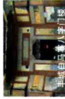
丰城白鹤港八字门楼