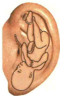
图 1-3 耳廓穴位分布如倒置胚胎示意图

耳穴是在医疗实践中逐渐发展起来的，目前耳穴总数已达200多个，下面主要介绍一些常用穴的定位、主治及功能。