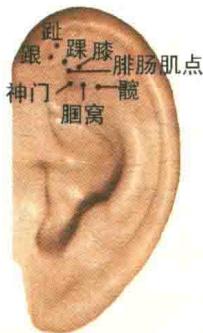
图1-5 对耳轮上脚部穴位