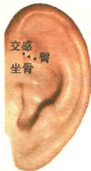
图 1-6 对耳轮下脚部穴位