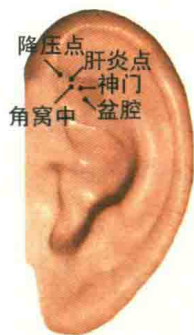
图 1-8 三角窝部穴位