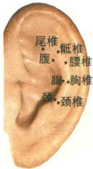
图 1-7 对耳轮部穴位