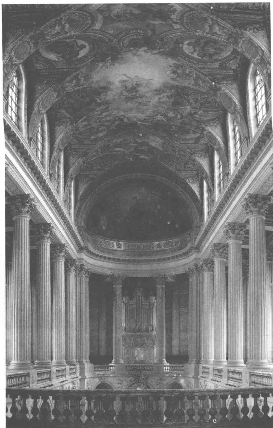
凡尔赛宫中的皇家礼拜堂。凡尔赛宫是法国宫廷的中心，是欧洲专制政体最重要的舞台之一。