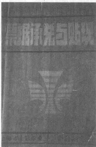
图1-5 上海金融学会、金融研究编印的《票据承兑与贴现》封面