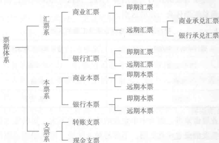
图 1-6 票据体系

票据的种类很多，一般是指三种，即汇票、本票、支票。从期限来看，可以分为即期票据和远期票据；从出票人来看，可以分为银行汇票和商业汇票，由此可以派生出一个票据图系。