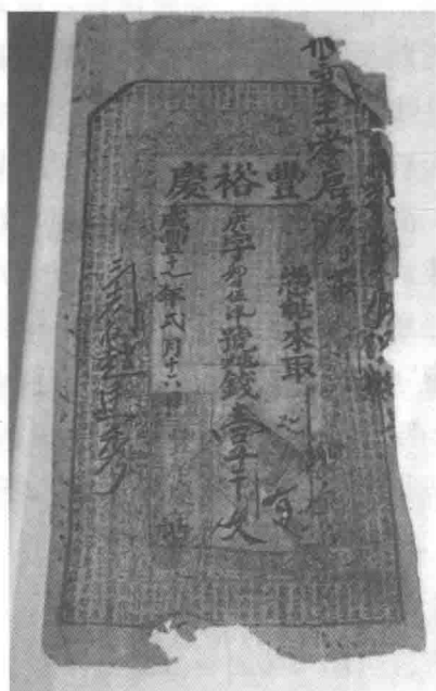
图1-3 山西票号的票据

我国近代“票据”的使用或执业人员的产生，有说源自于山西平遥的日升昌票号；有说源自华南广东地区与东印度公司的贸易。道光三十八