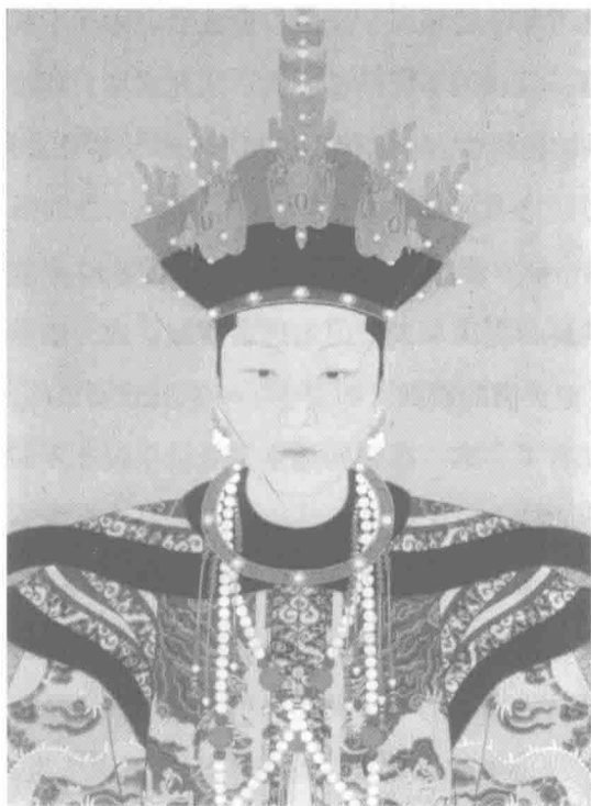
◁ 孝诚仁皇后，因难产而死

四位：顺治帝、康熙帝、同治帝、光绪帝。这四位帝王都是少年即位，亲政前大婚，以表示成年，可以乾纲独断。按理，帝王的大婚，风光无限，天下皆知，肯定幸福得不得了。可是，我们考证到，这些清朝大婚的帝王却都是以喜剧开始，最终以悲剧而结束。就让我们一一分析吧。