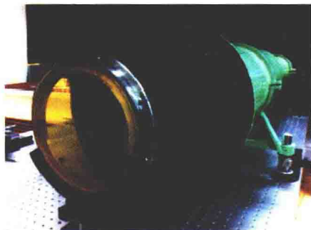
图 3 大口径薄膜望远镜

以大口径薄膜透镜为例 (图 3)，亚波长结构超表面可极大减小整个系统的重量，使得 20m 以上口径的空基望远镜成为可能。同时，超表面可解决传统衍射元件面临的色散和视场问题，实现宽带、大视场成像。