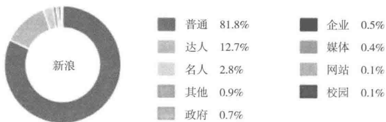
图1 关注天津“8·12”爆炸事件的网民结构