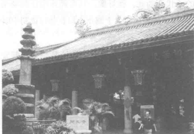
潮州开元寺，成为潮汕文化的一个象征与缩影。

潮州不仅山明水秀，风光旖旎，钟灵毓秀，而且是人文荟萃、藏龙卧虎之风水宝地。仅唐宋两代，就有十位宰相由于各种原因来到潮州，带来中原文化，兴利除弊，为潮州的经济、社会与文化的发展做出了不同的贡献。也因此，他们的大名与潮州盛名一齐世代传颂下来。