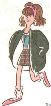
Jīn Zhīyīng 金志英