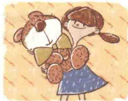
马莉莉 (Mǎ Lǐ Lì)