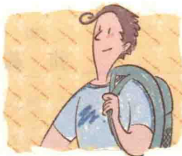
李克 (Lǐ Kè)