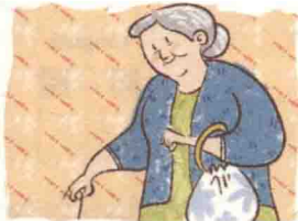
李莉 (Lǐ Lì)