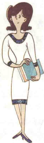
Lǐ Yuè 李悦