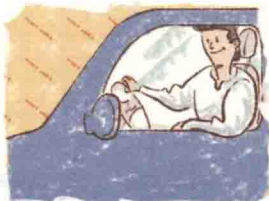
马李 (Mǎ Lǐ)