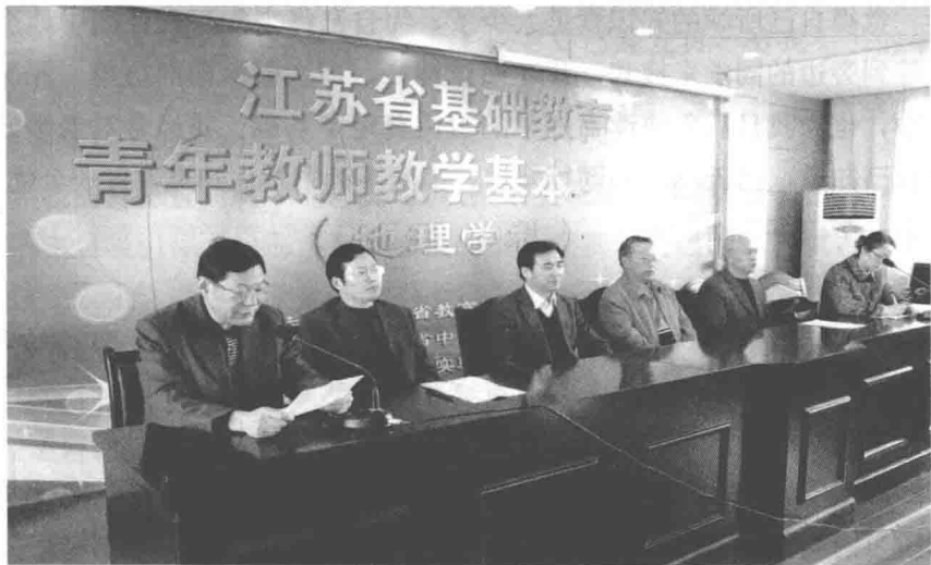
在江苏省基础教育青年教师(地理)教学基本功大赛上发言

就在我们制成政区轮廓图的同时，我还引导同学们在地理课上开展一分钟盲拼的比赛，就是让学生在—分钟时间内，把用纤维板制成的各个省区的轮廓演示板，散乱地放在课桌里，不用眼睛看，就用手指触摸，使其复归原位，拼装成一幅完整的中国政区图。每逢开展这样的比赛，教室里可谓热火朝天，每个学生都不甘落后，那些平时课上有点调皮的学生，这回可找到了用武之地，只见他们手脚麻利，神情紧张地投入比赛之中，唯恐落后，往往这些学生都是盲拼比赛的获胜者，因为他们天性爱玩爱动手。就这样，在充满比赛乐趣的过程中，我们完成了“中国政区分布”一章的教学，效果非常好，学生记得牢，学得轻松。这使我想起海德格尔的话：“手所能具有的本质是会言说、会思的本质。”学习和思考的方式应该是多种多样的，我们要寻找更适合于学生的教学方式，让学生学得更快乐更轻松，发挥学生身上巨大的潜能。