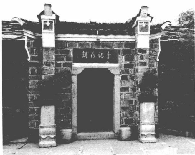
李良济前身——李记药铺