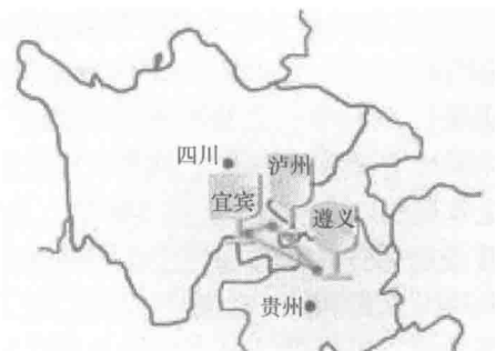
图1-3 中国白酒金三角示意图

核心区域：以宜宾、泸州为核心区域。该区地处川滇黔三省结合部，长江（宜宾—泸州）、沱江（泸州段）、岷江（宜宾段）、赤水河（泸州段）皆流经于此，形成了独特的酿酒地域性资源，孕育了四川白酒的精华与特色。现已形成以五粮液、泸州老窖、郎酒为引领，