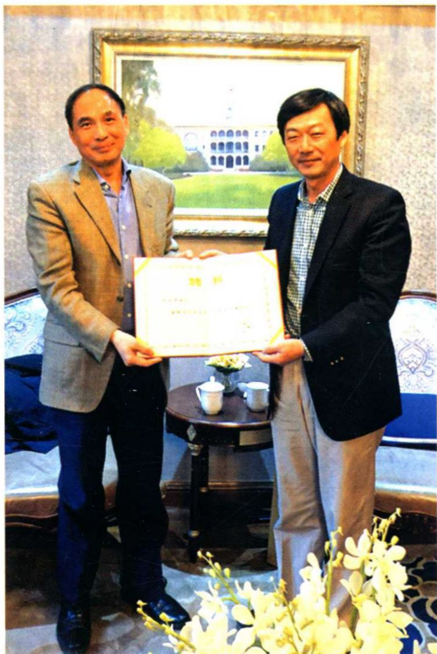
国际著名中国问题专家郑永年教授受聘学校东吴智库顾问