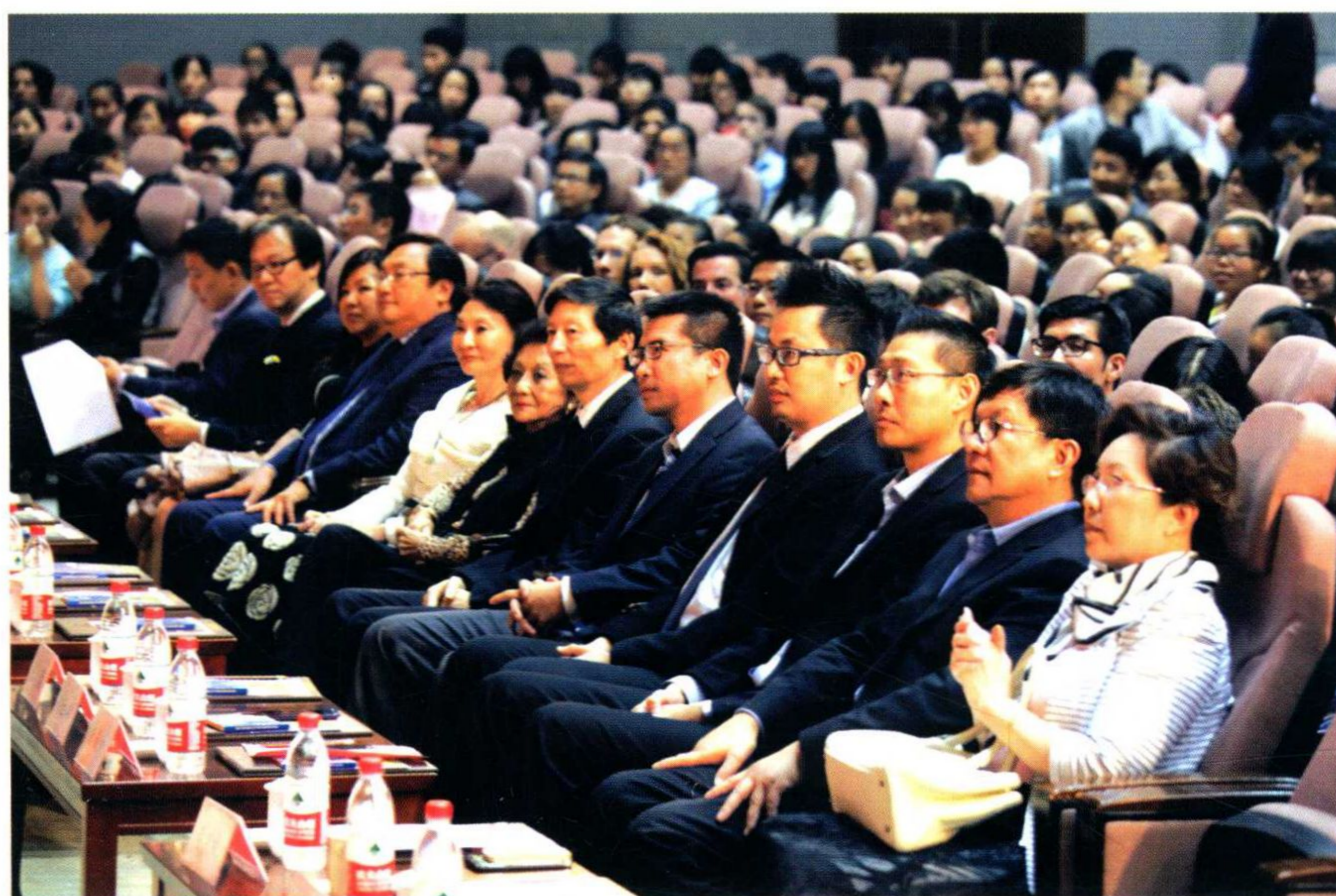
学校举行第二十三届周氏教育科研奖、第十四届周氏音乐奖项颁奖仪式