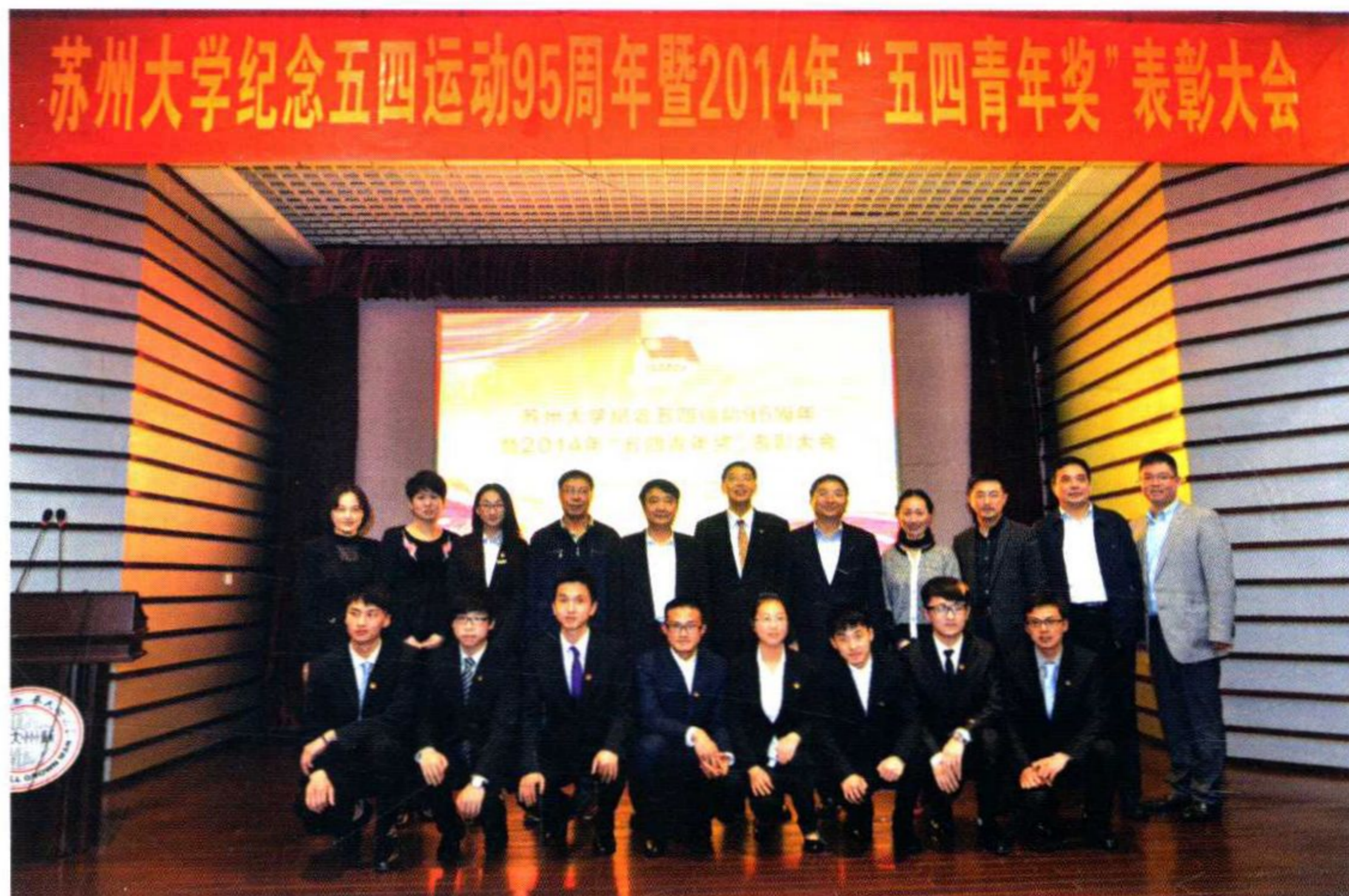
学校召开纪念五四运动95周年暨2014年“五四青年奖”表彰大会