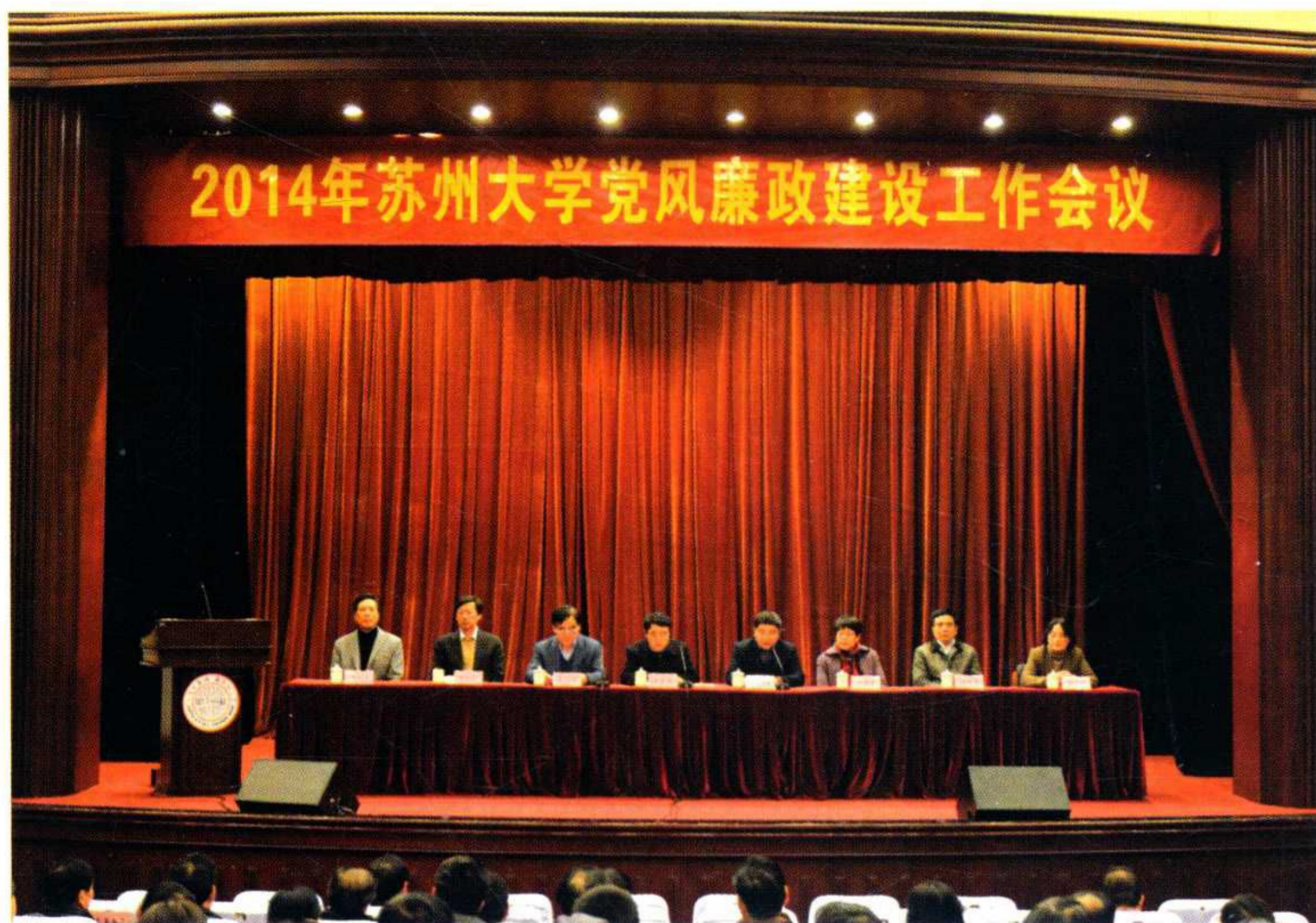
学校召开2014年党风廉政建设工作会议