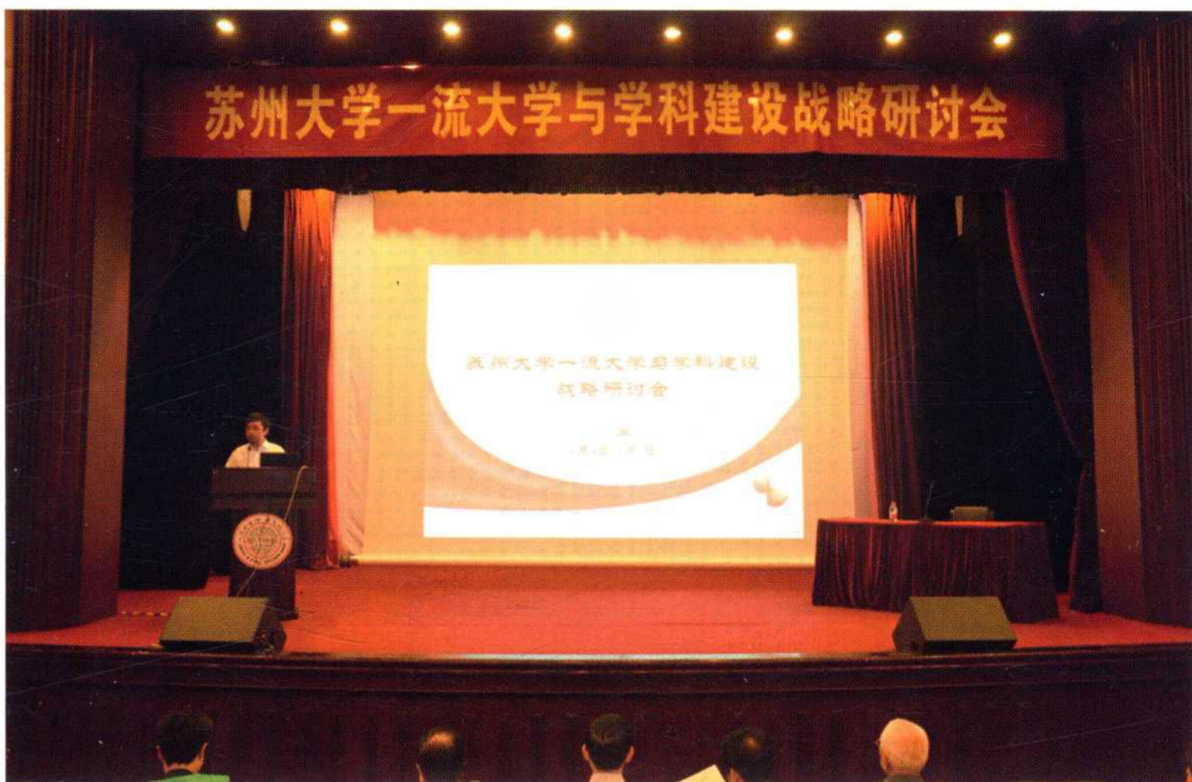
学校举办一流大学与学科建设战略研讨会