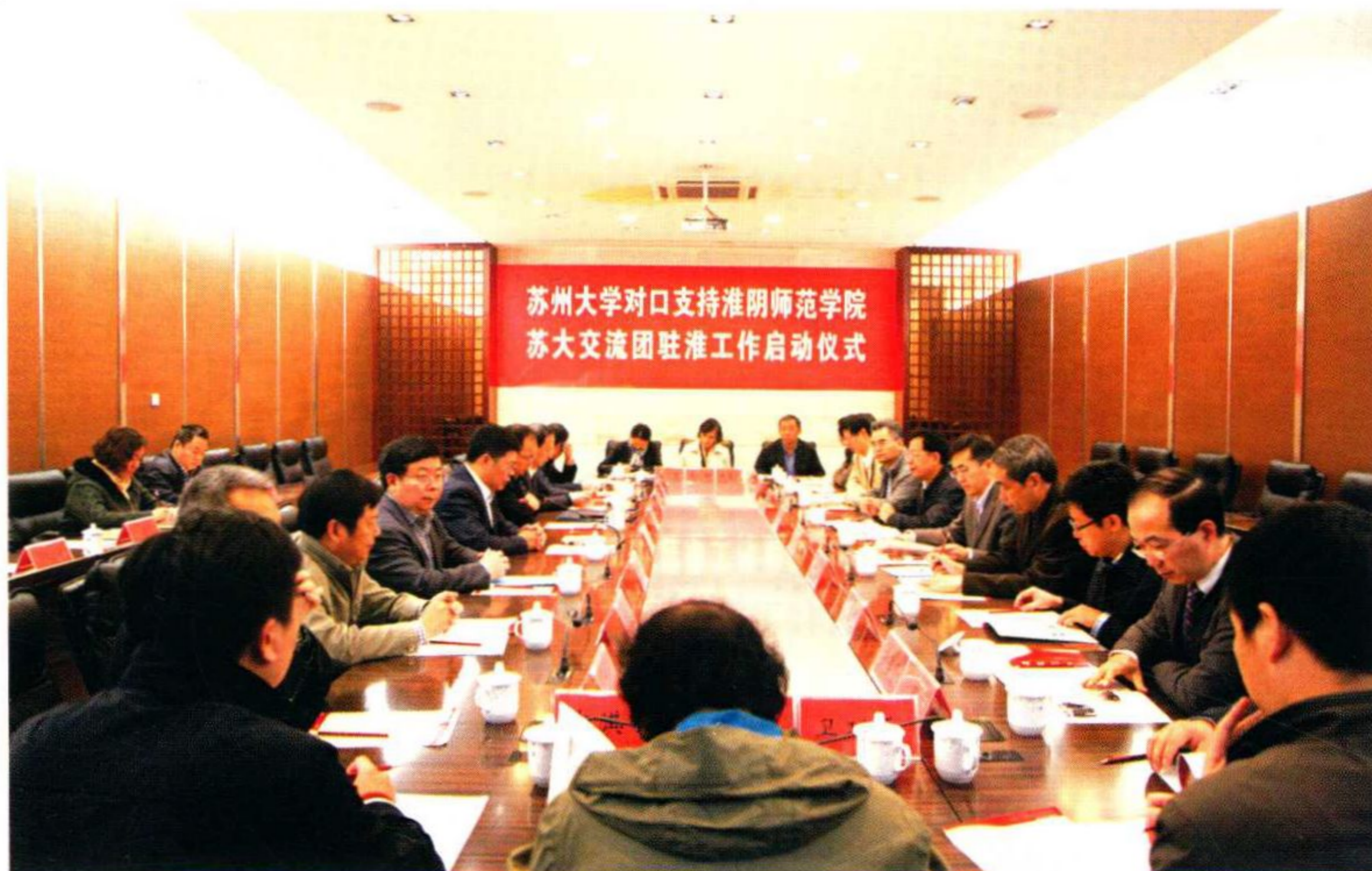
学校对口支持淮阴师范学院暨苏州大学交流团驻淮工作启动