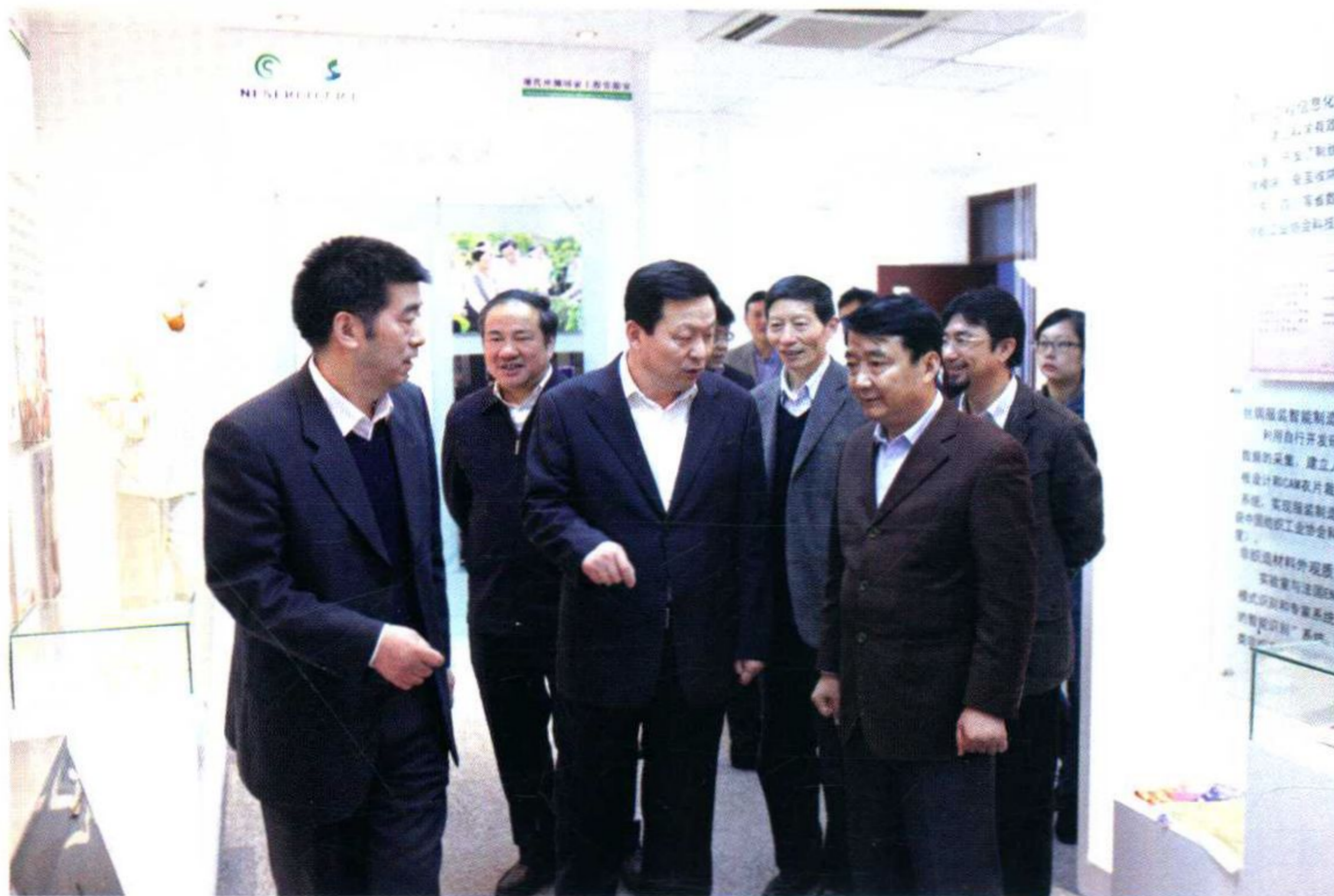
苏州市委副书记、市长周乃翔一行到学校调研