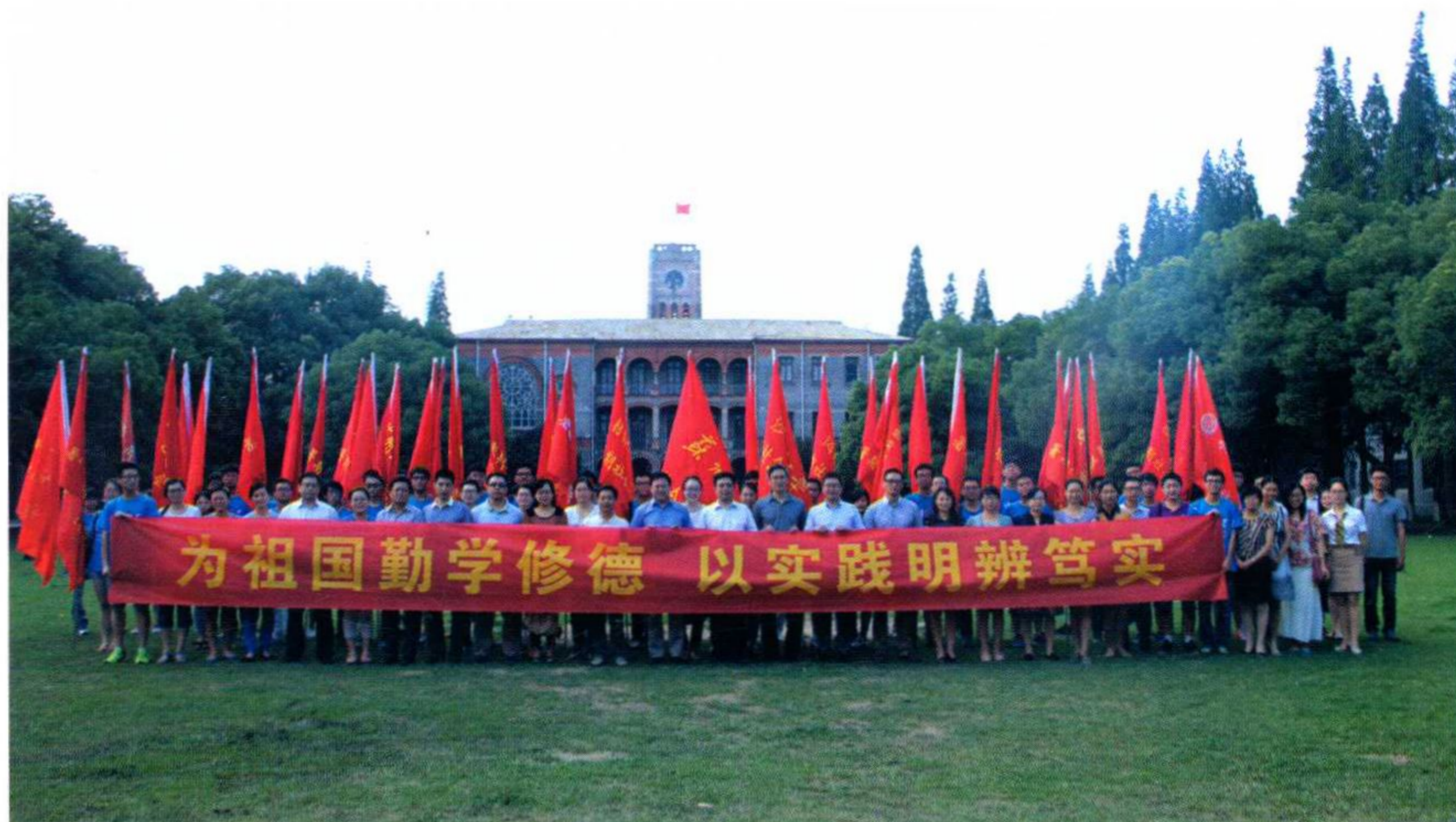
学校举行暑期社会实践出征仪式