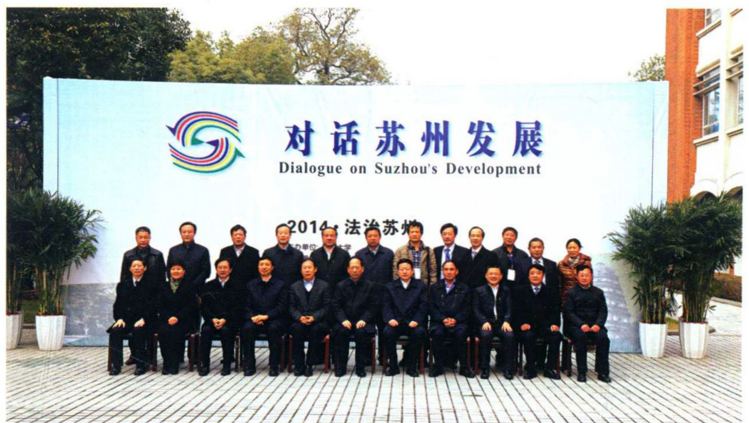
“对话苏州发展·2014法治苏州”活动在学校举行