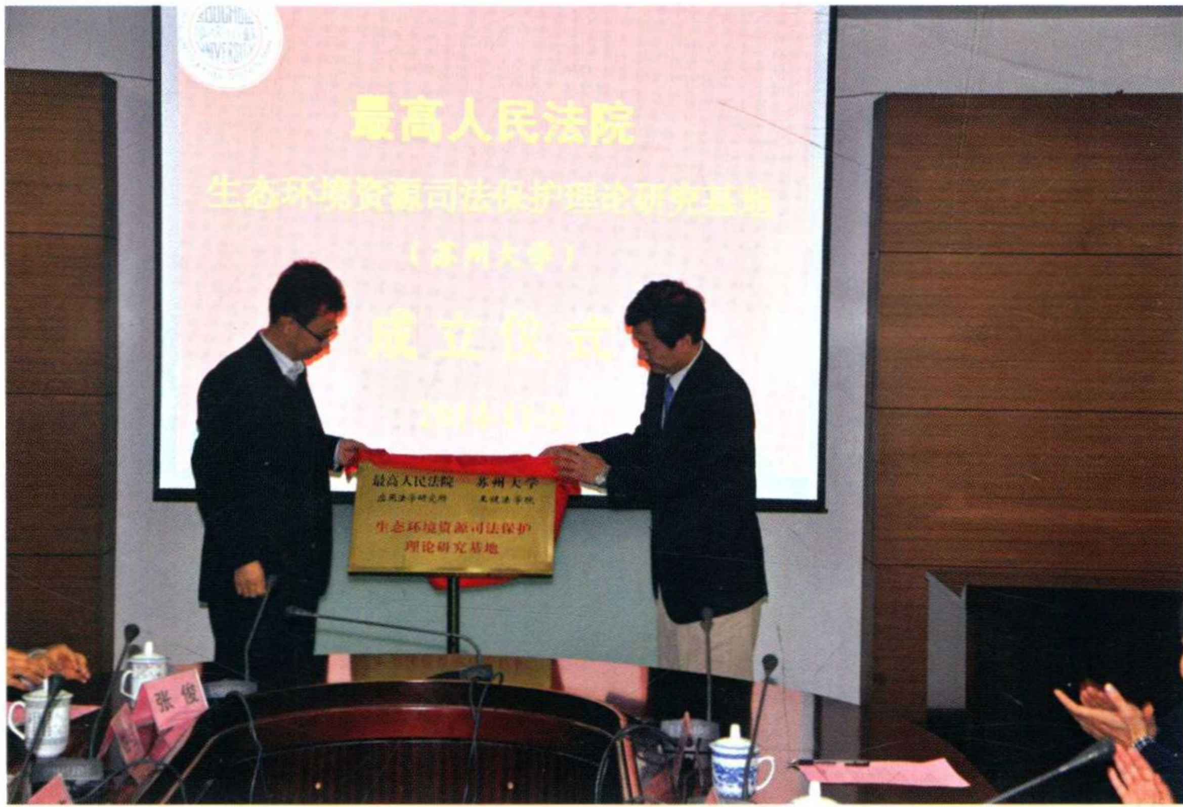
最高人民法院与学校合作共建“生态环境资源司法保护理论研究中心”