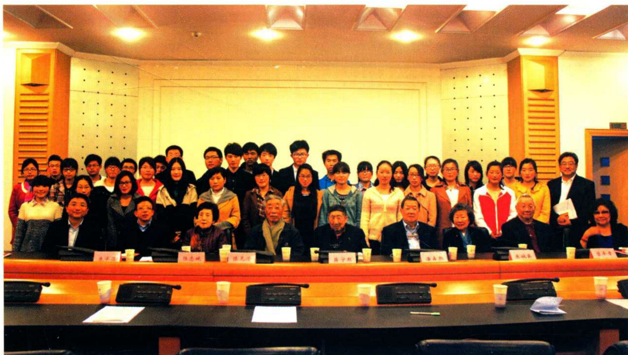
敬爱助学金座谈会