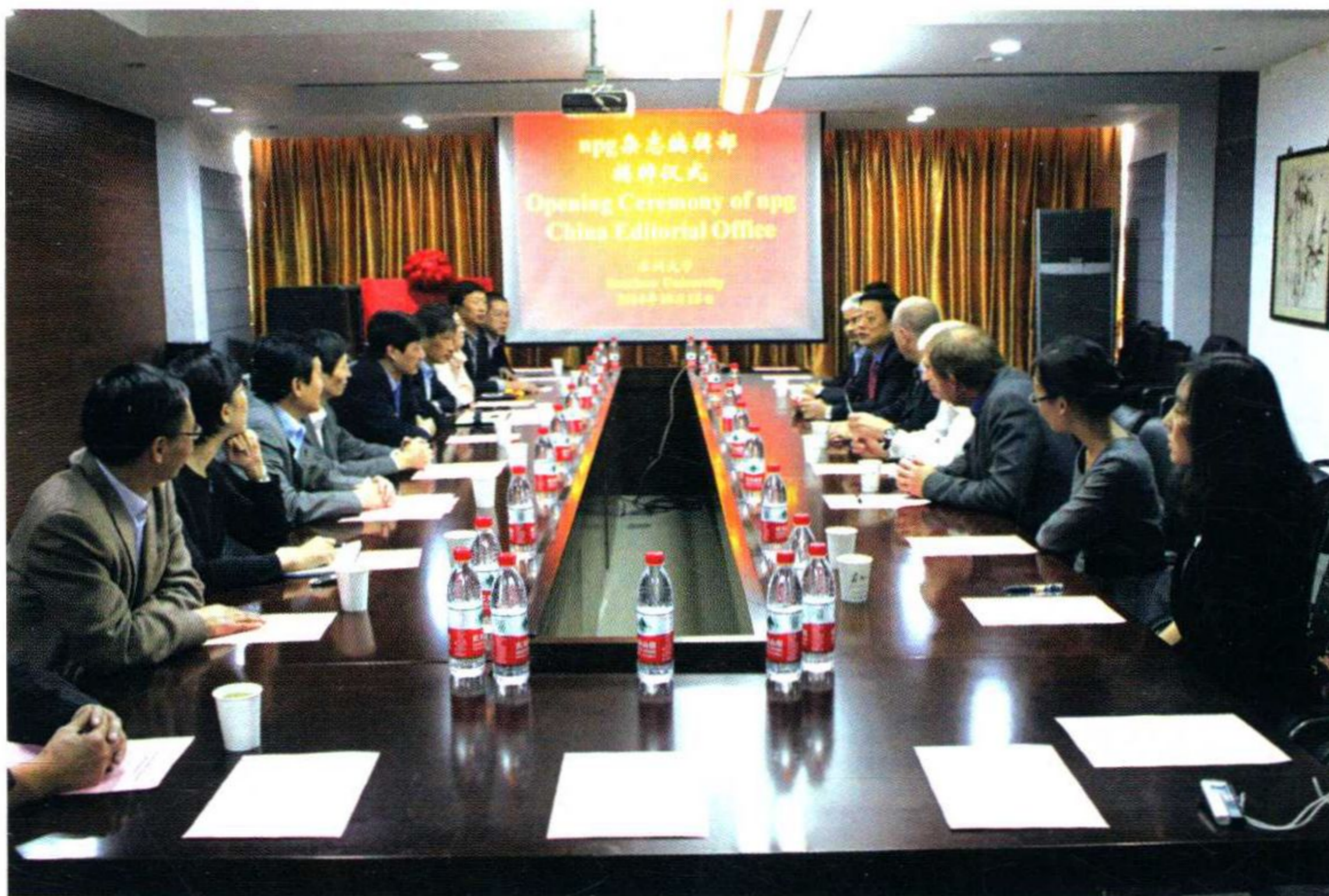
NPG 杂志编辑部(Nature Publishing Group Soochow University Editorial Office)落户学校