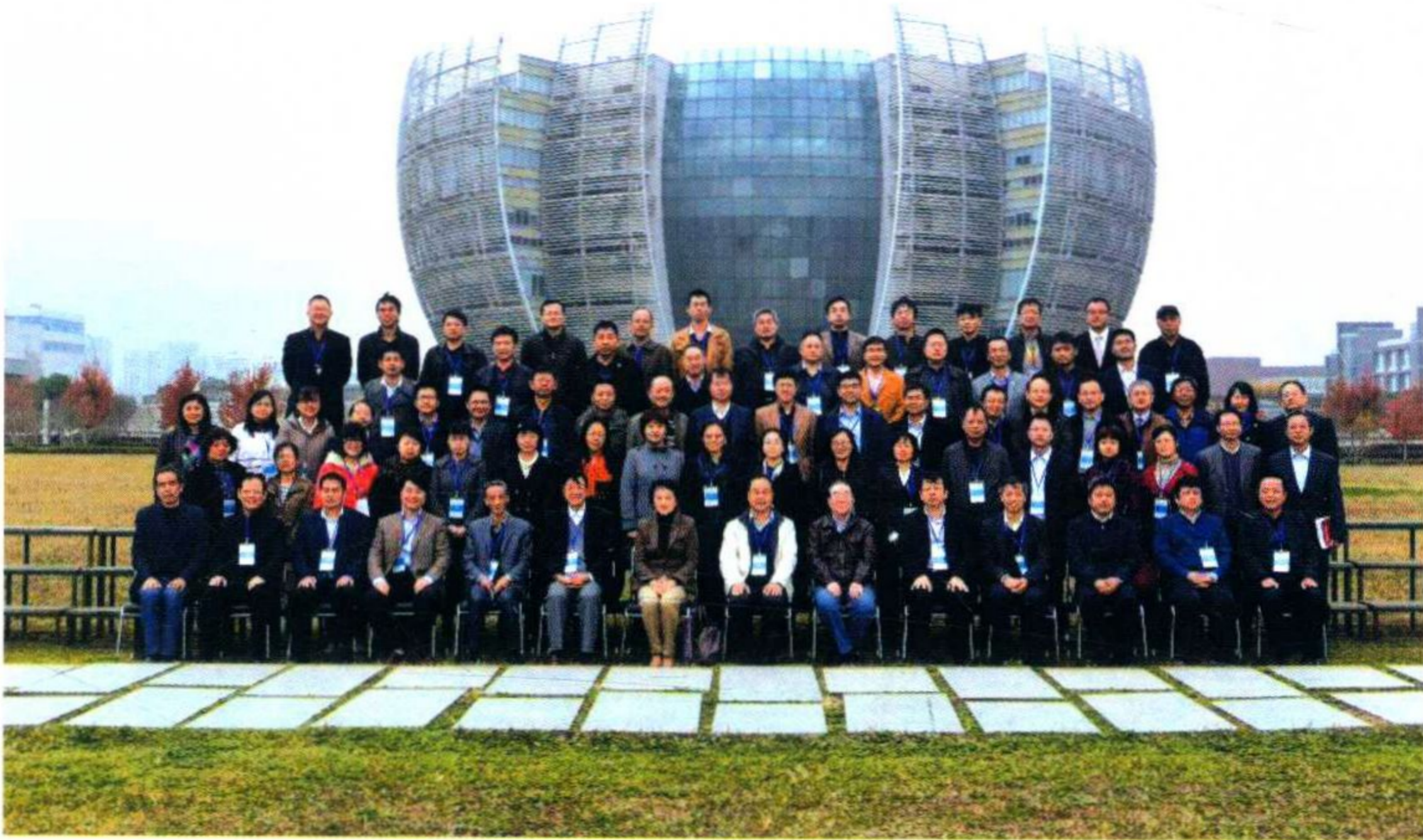
教育部高等学校核工程类专业教学指导委员会暨全国高校核工程类专业院长系主任联席会议在学校举行