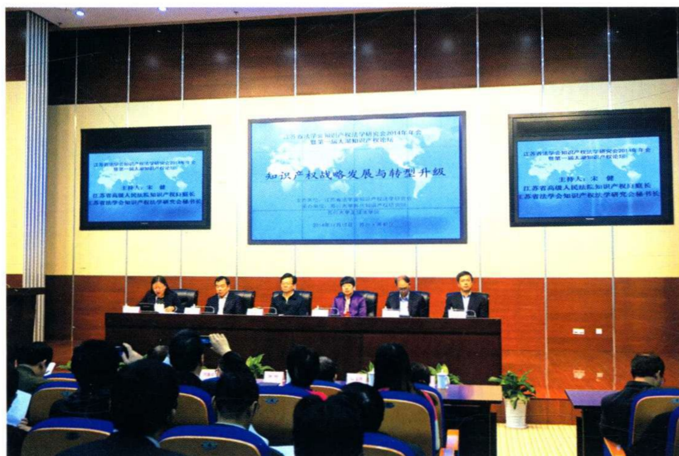
江苏省法学会知识产权法学研究会2014年年会暨第一届太湖知识产权论坛在苏举办