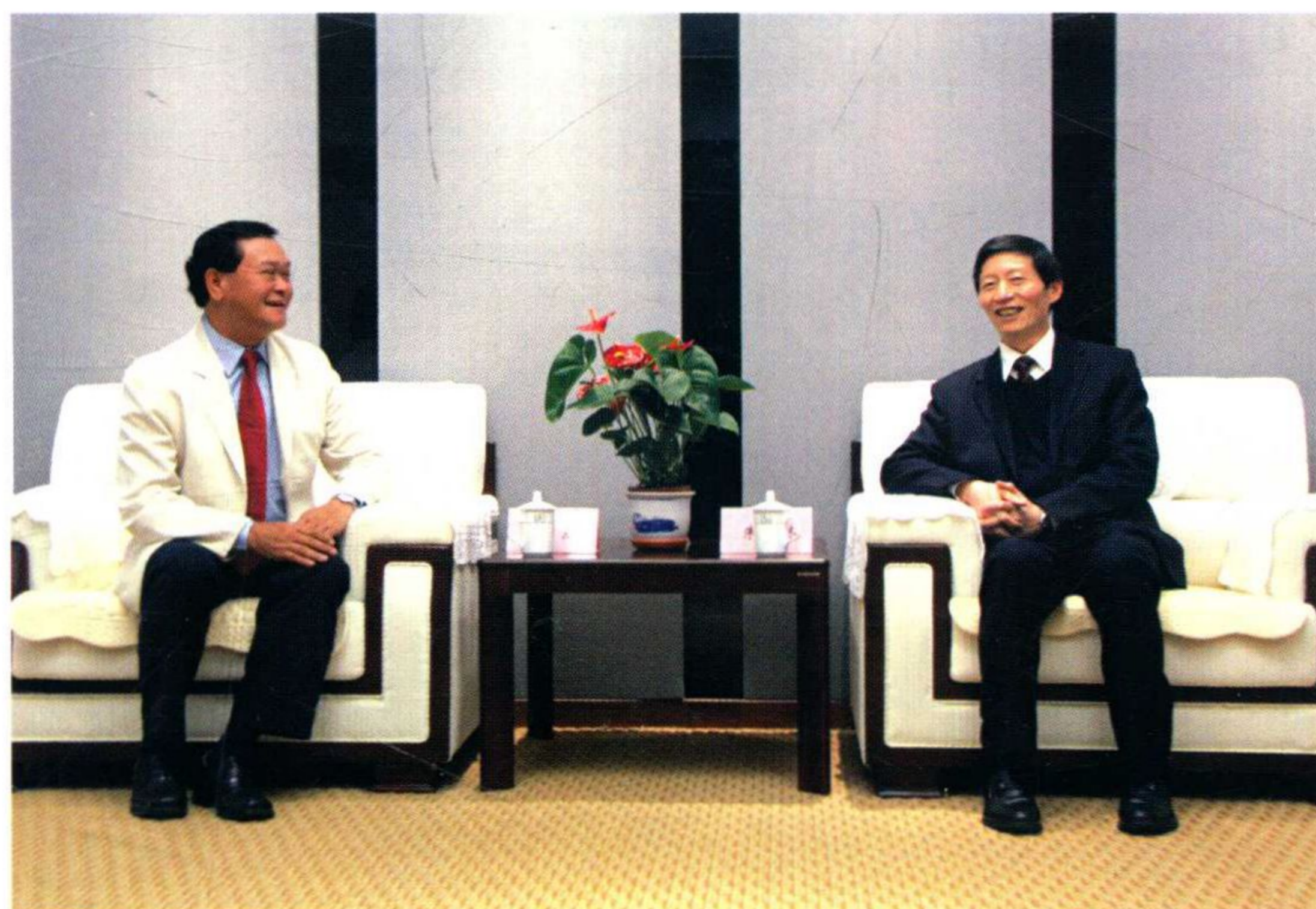
老挝教育与体育部副部长孔熙一行访问学校