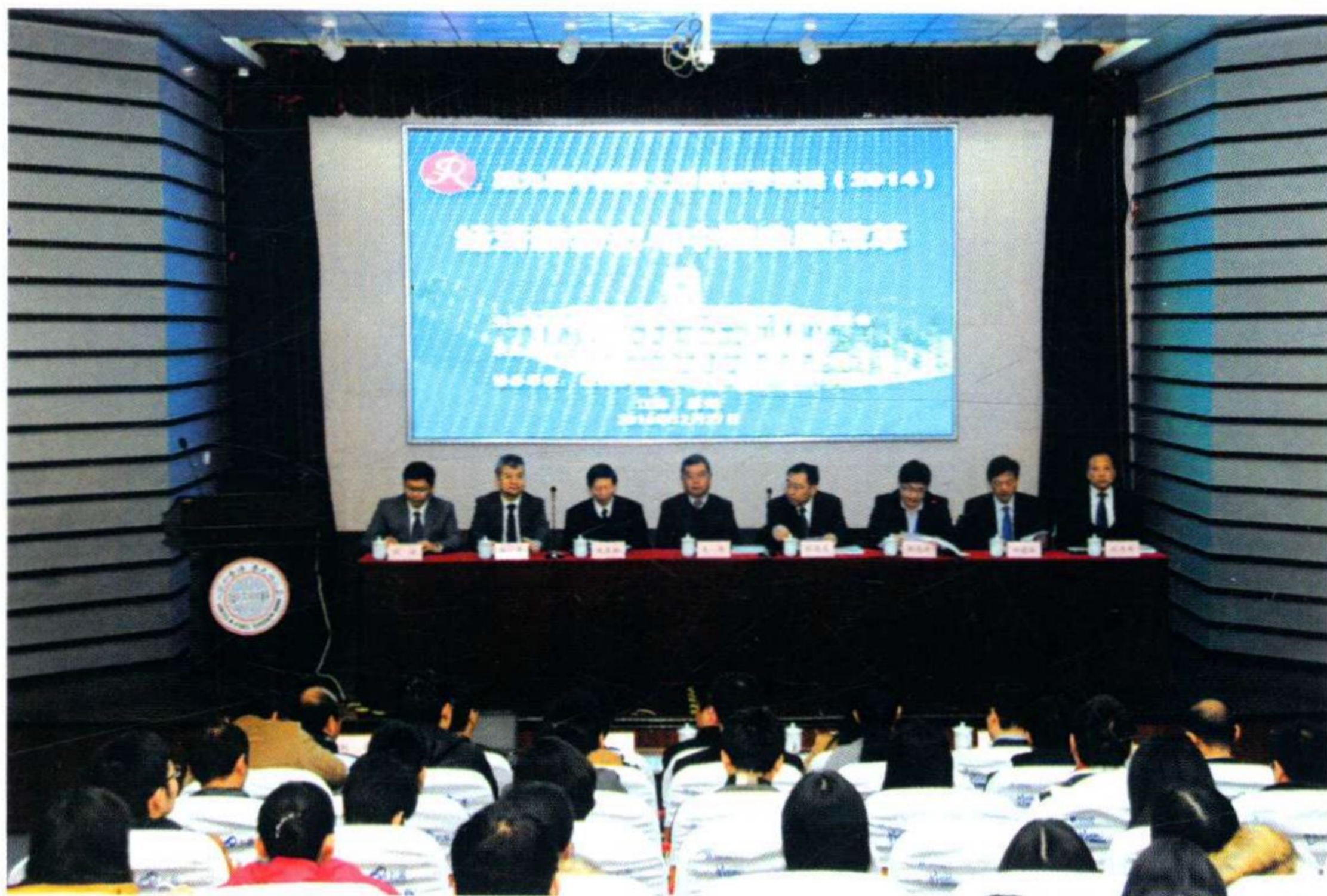
第九届中国博士后经济学论坛(2014)在学校举办