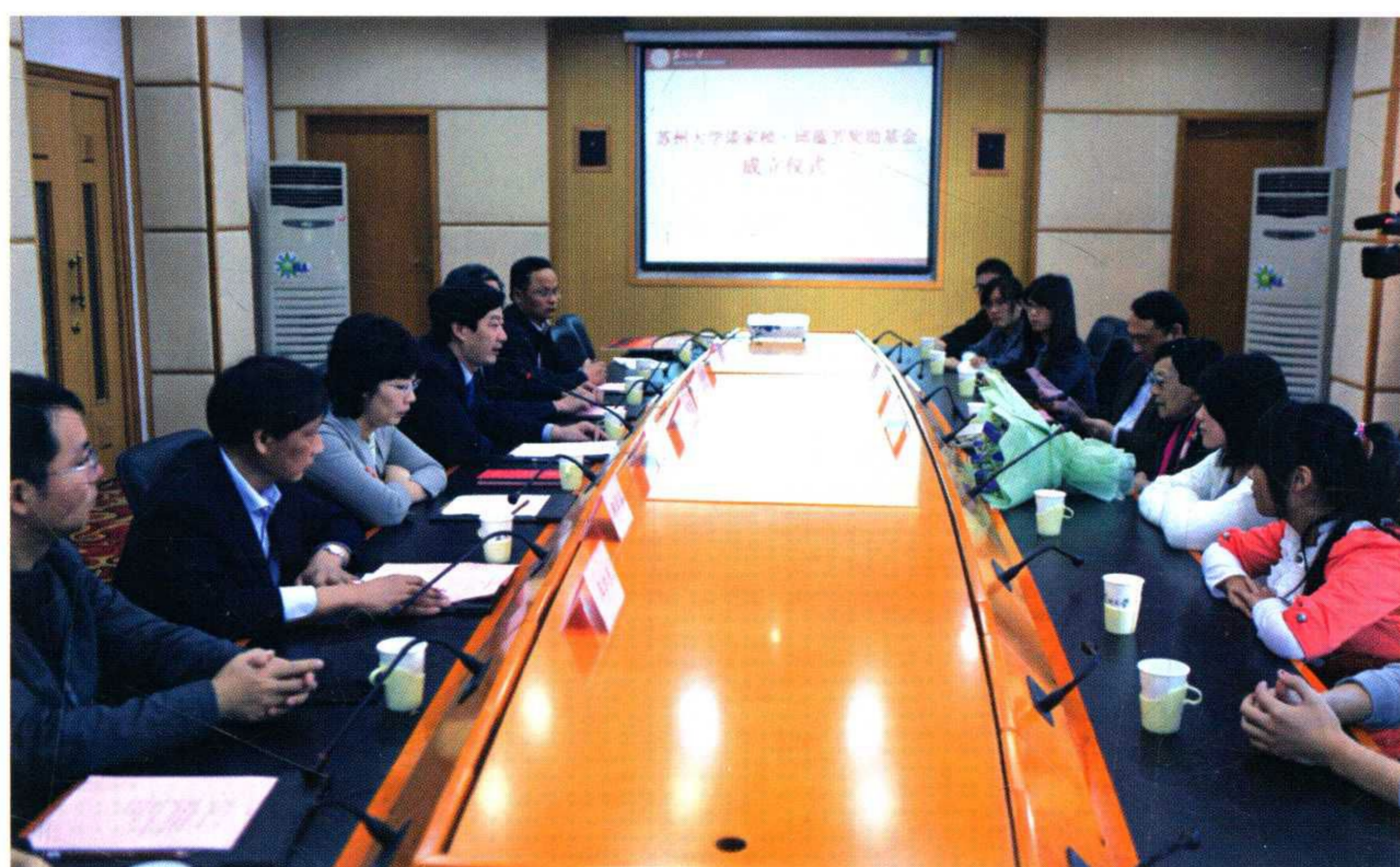
苏州大学谈家桢邱蕴芳奖助基金成立仪式举行