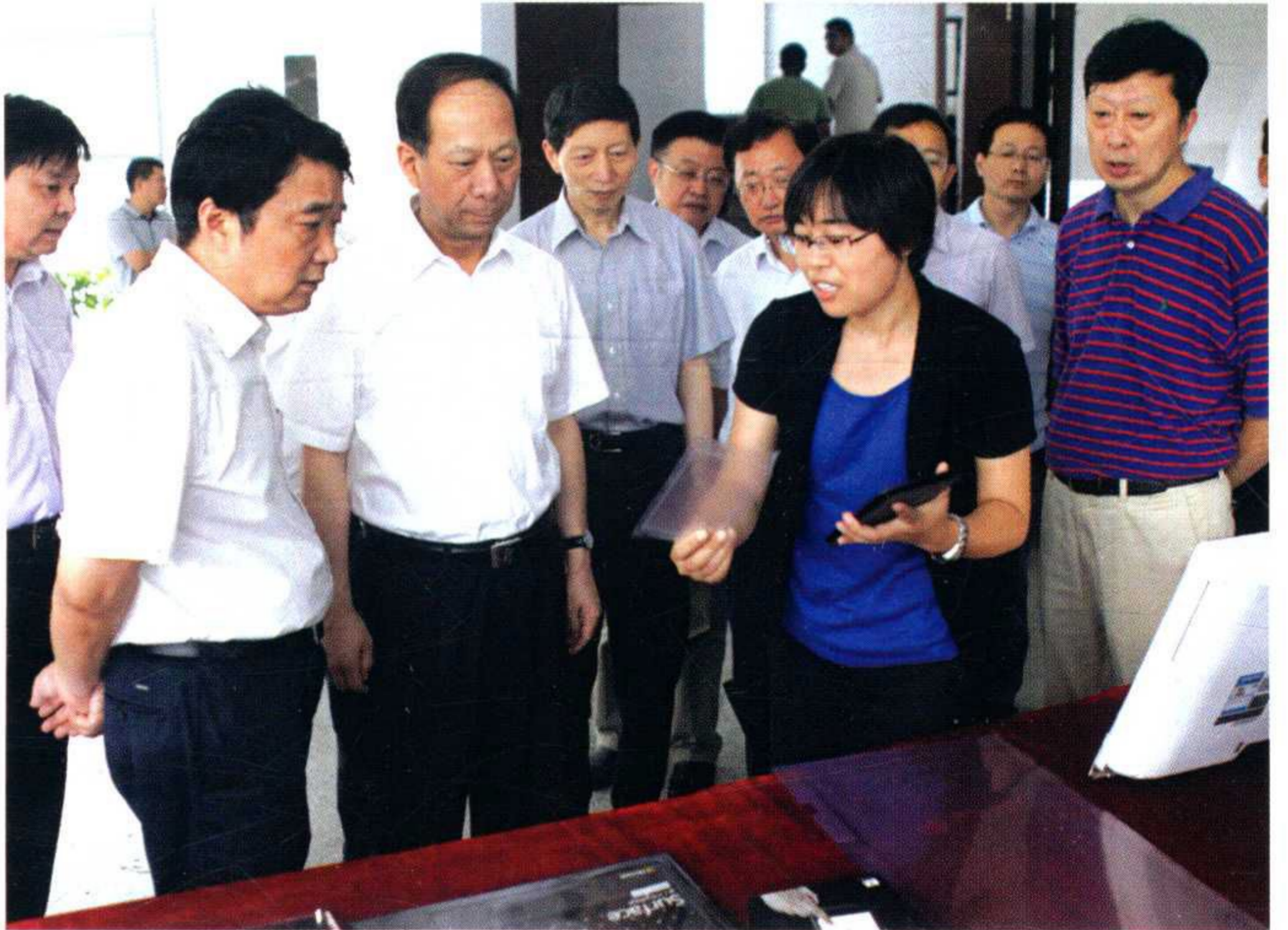
江苏省委副书记、苏州市委 书记石泰峰一行到学校调研