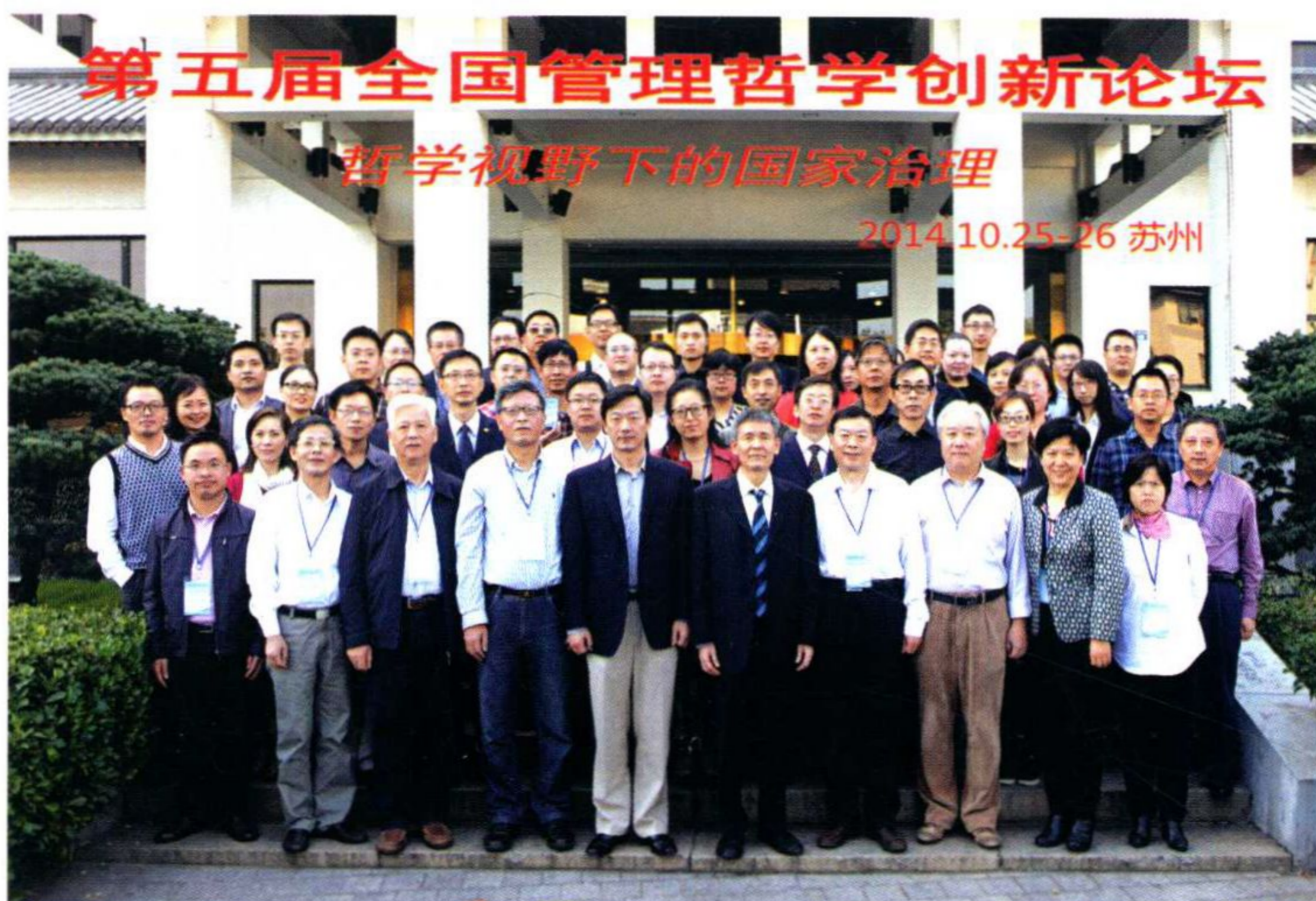
第五届全国管理哲学创新论坛在学校举办