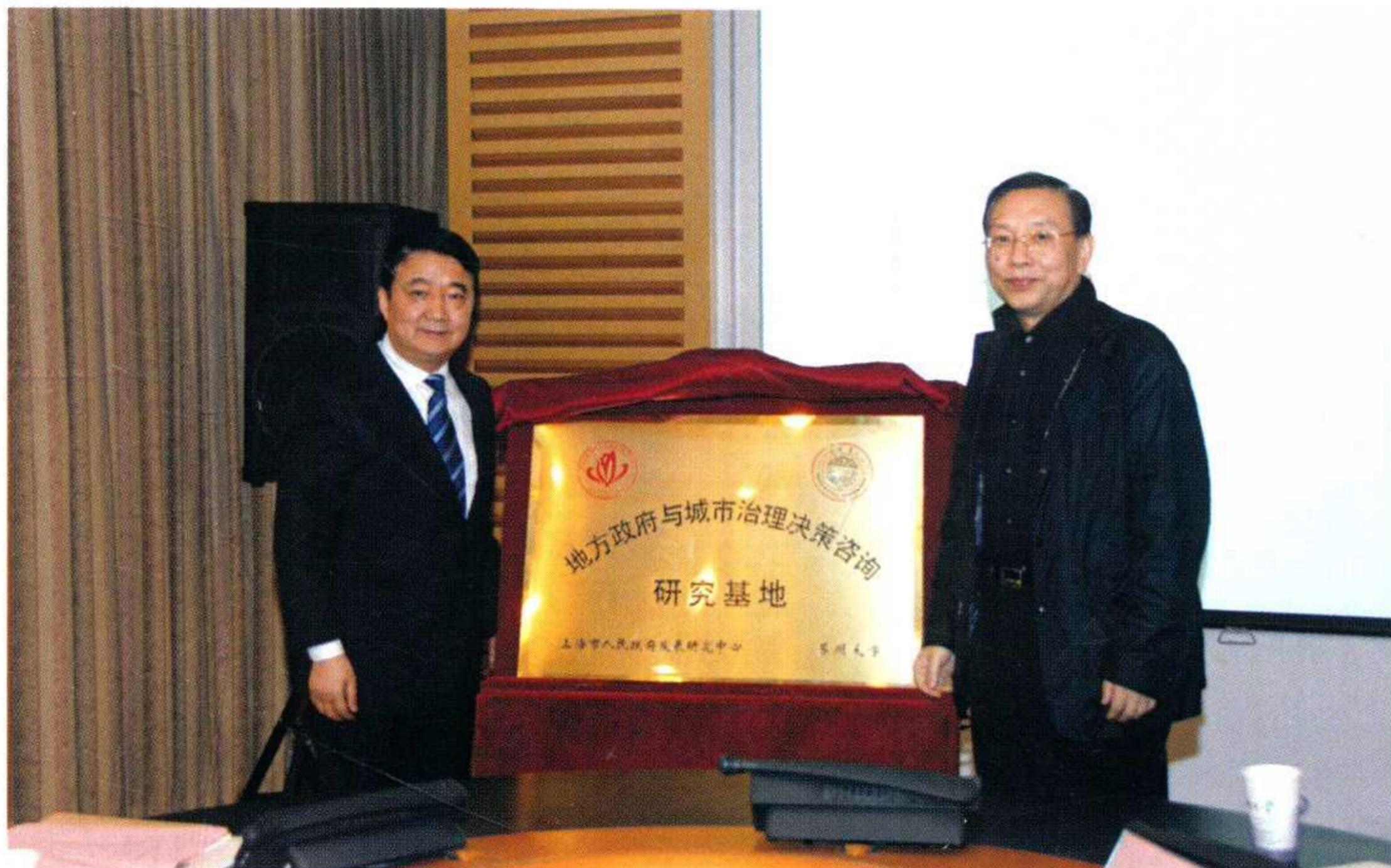
上海市人民政府发展研究中心—苏州大学“地方政府与城市治理决策咨询研究基地”落户学校