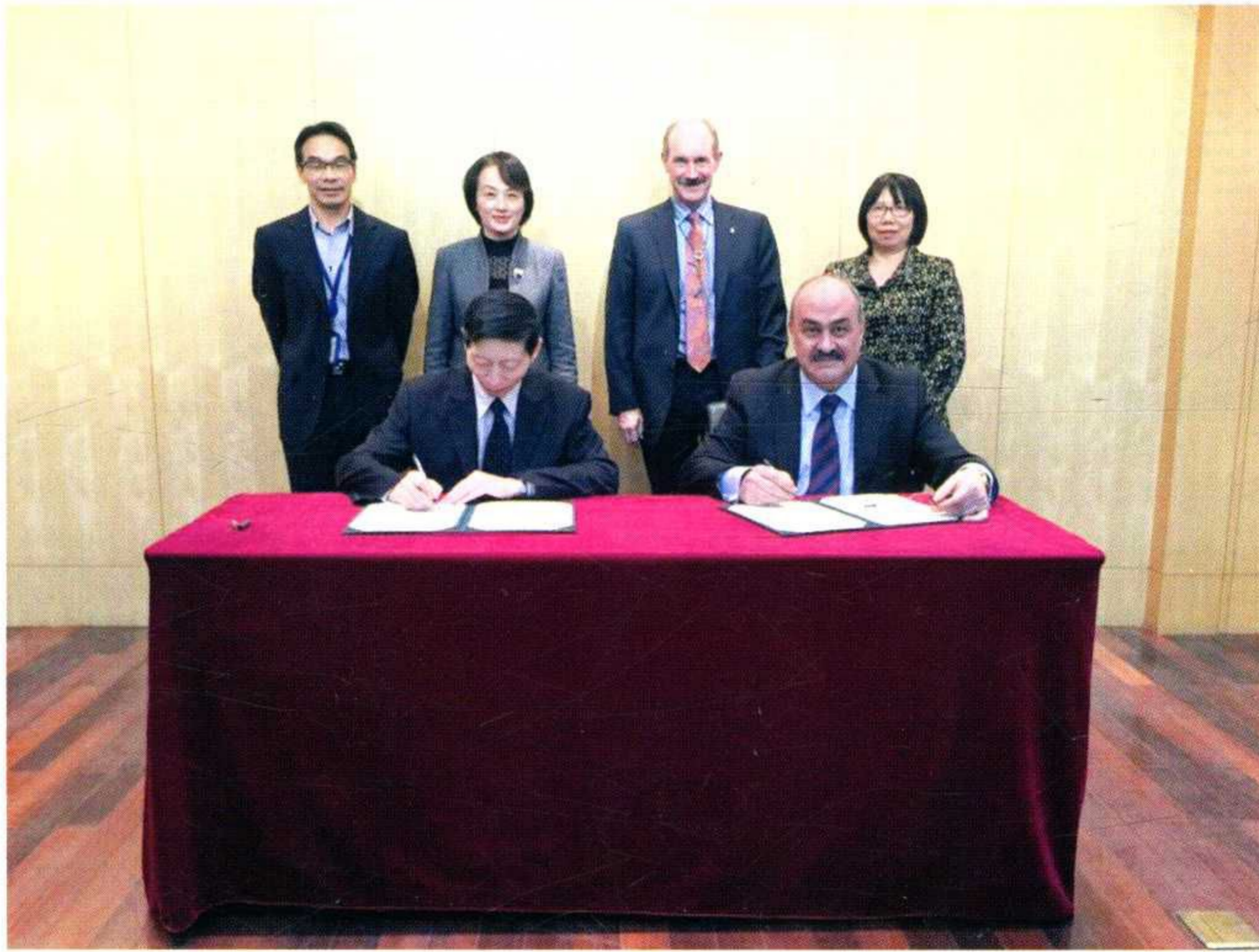
学校与加拿大麦克马斯特大学签订合作备忘录