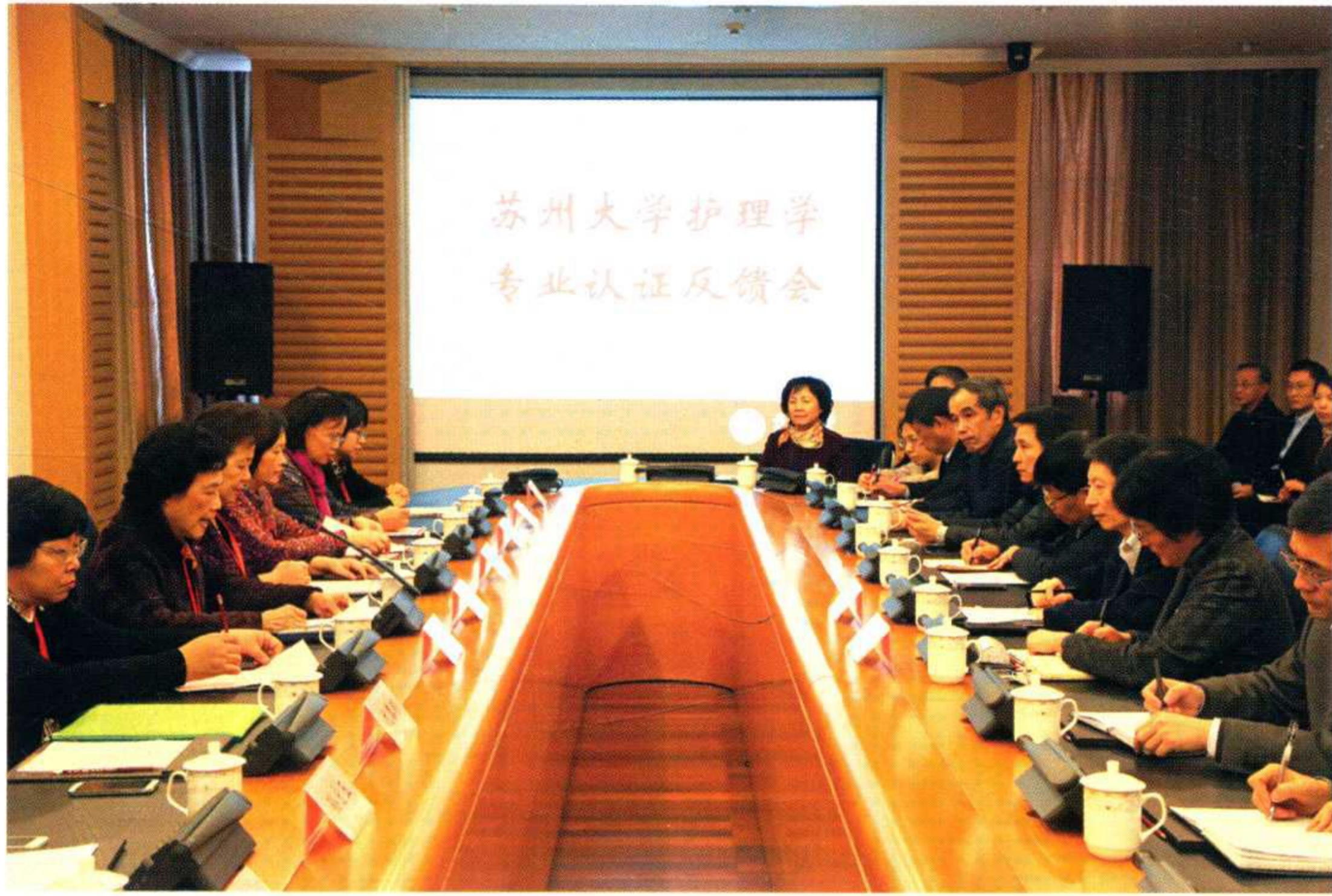
学校护理学专业认证反馈会举行