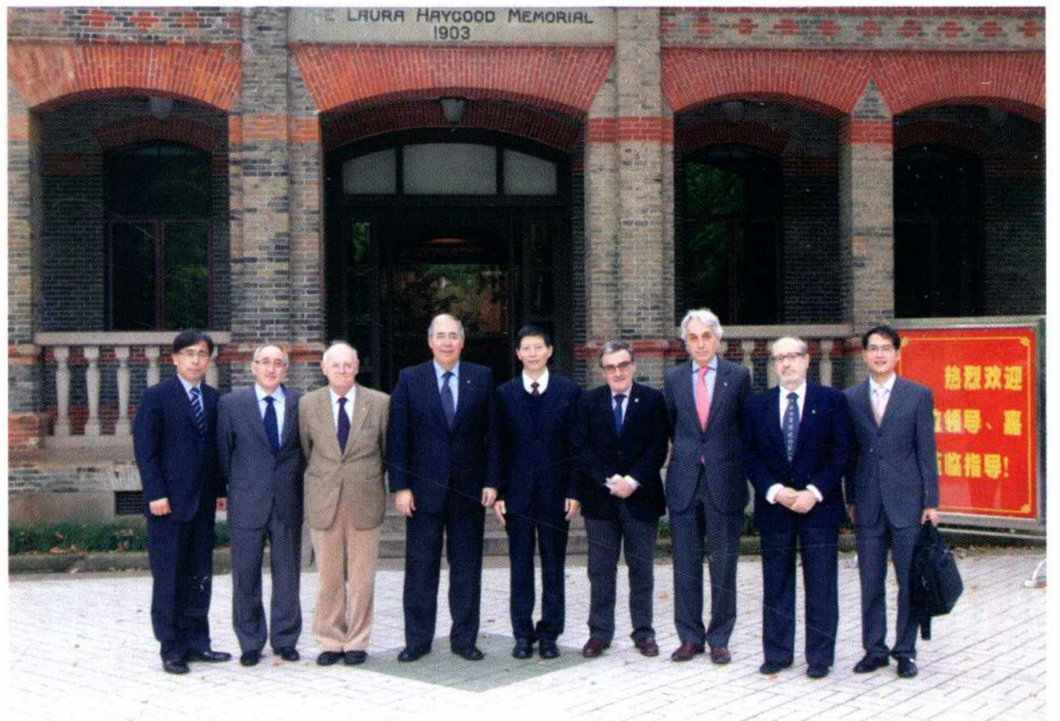
西班牙莱里达大学校长率团访问学校