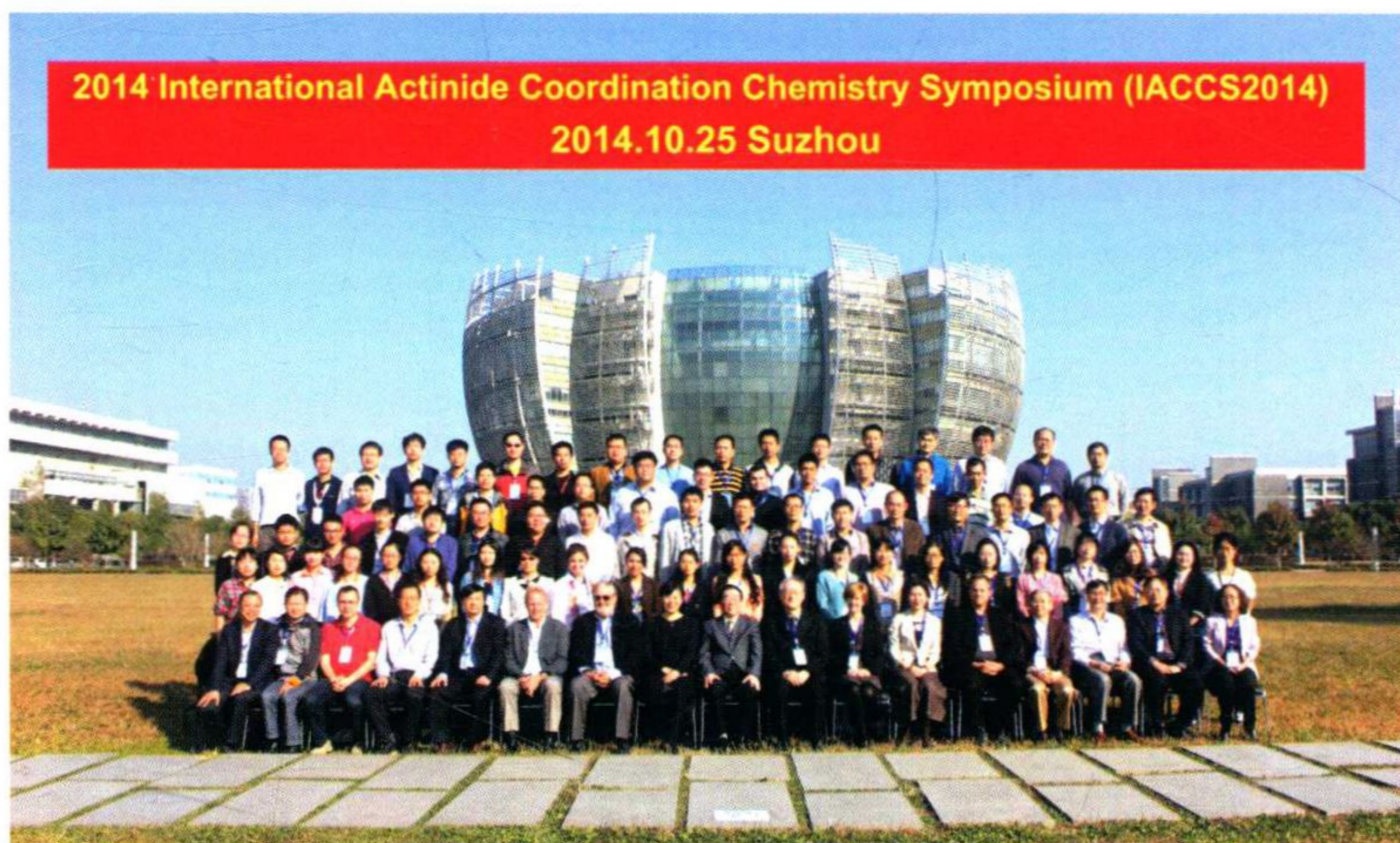
国际铜系元素配位化学前沿研讨会在学校举行