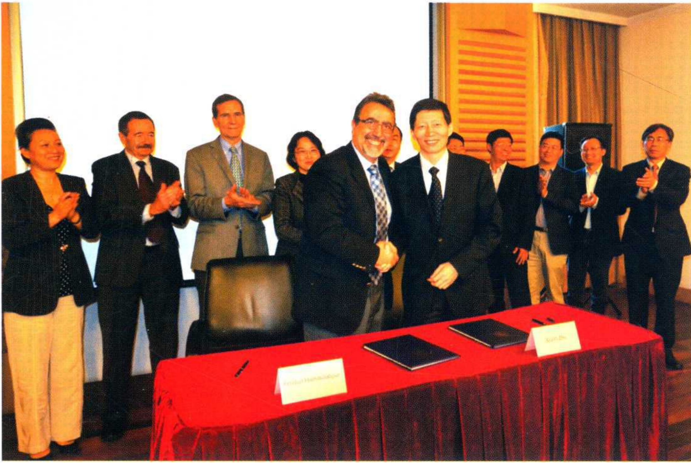
学校与加拿大滑铁卢大学签署合作协议