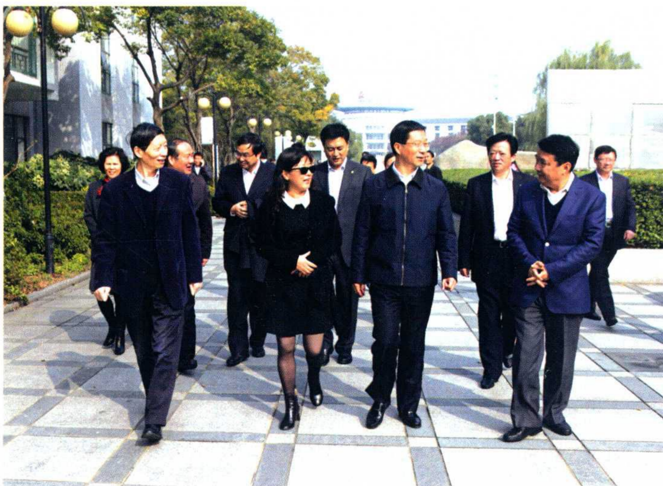
江苏省副省长曹卫星一行 考察苏州大学应用技术学院