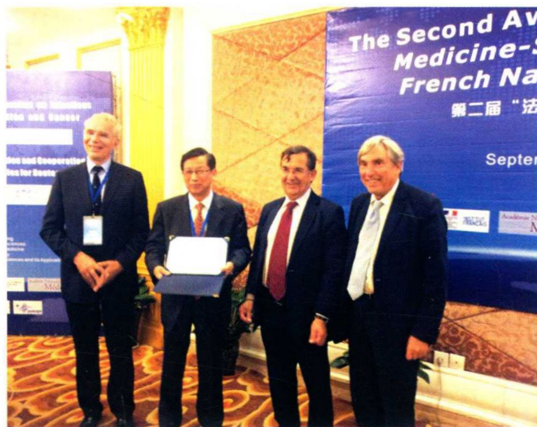
阮长耿院士获法国医学科学院颁发塞维雅奖