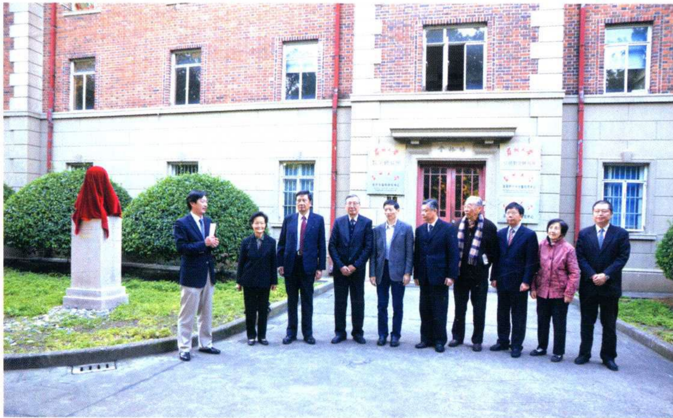
学校举行李维格纪念铜像揭幕仪式