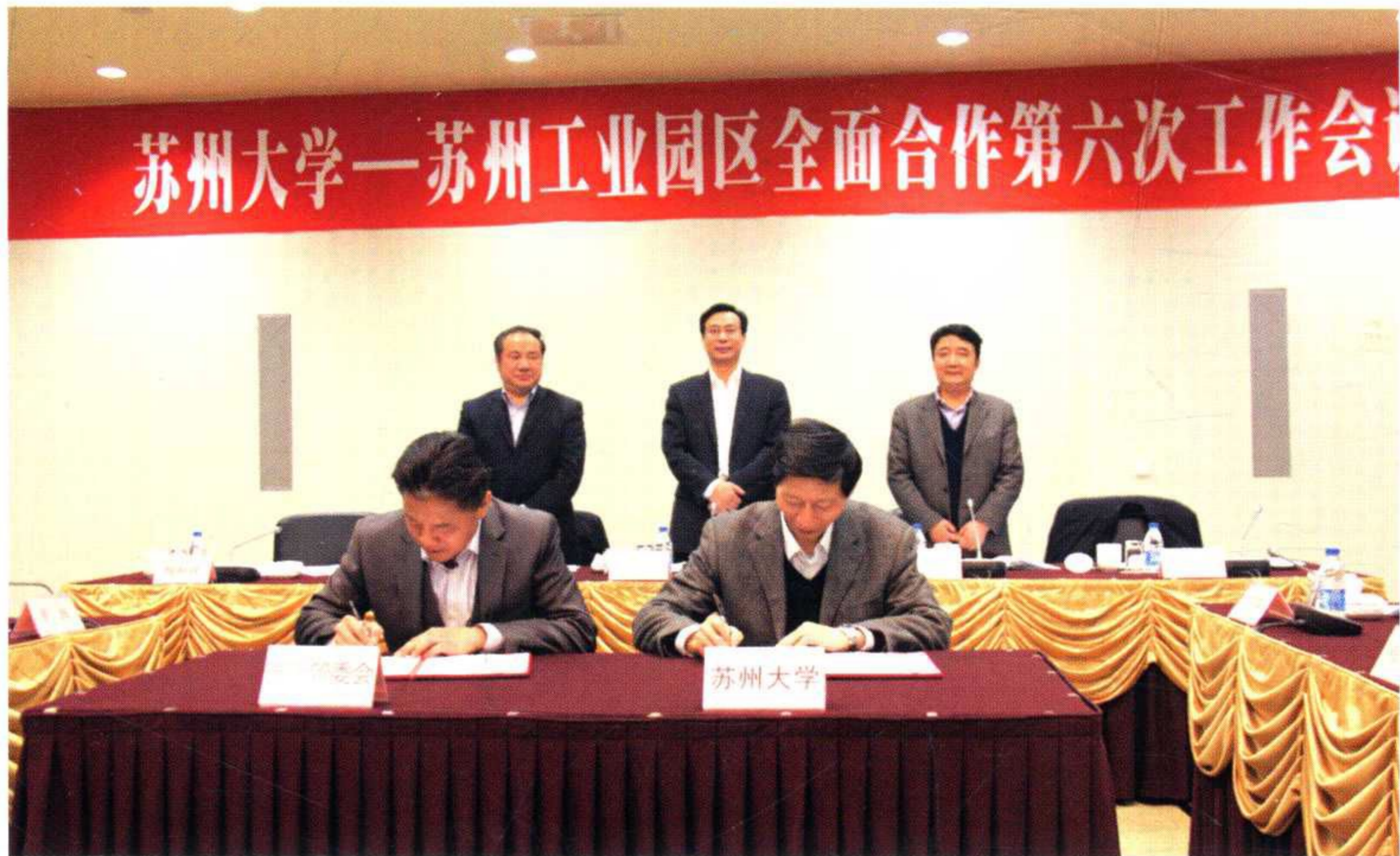
学校与苏州工业园区全面合作第六次工作会议召开