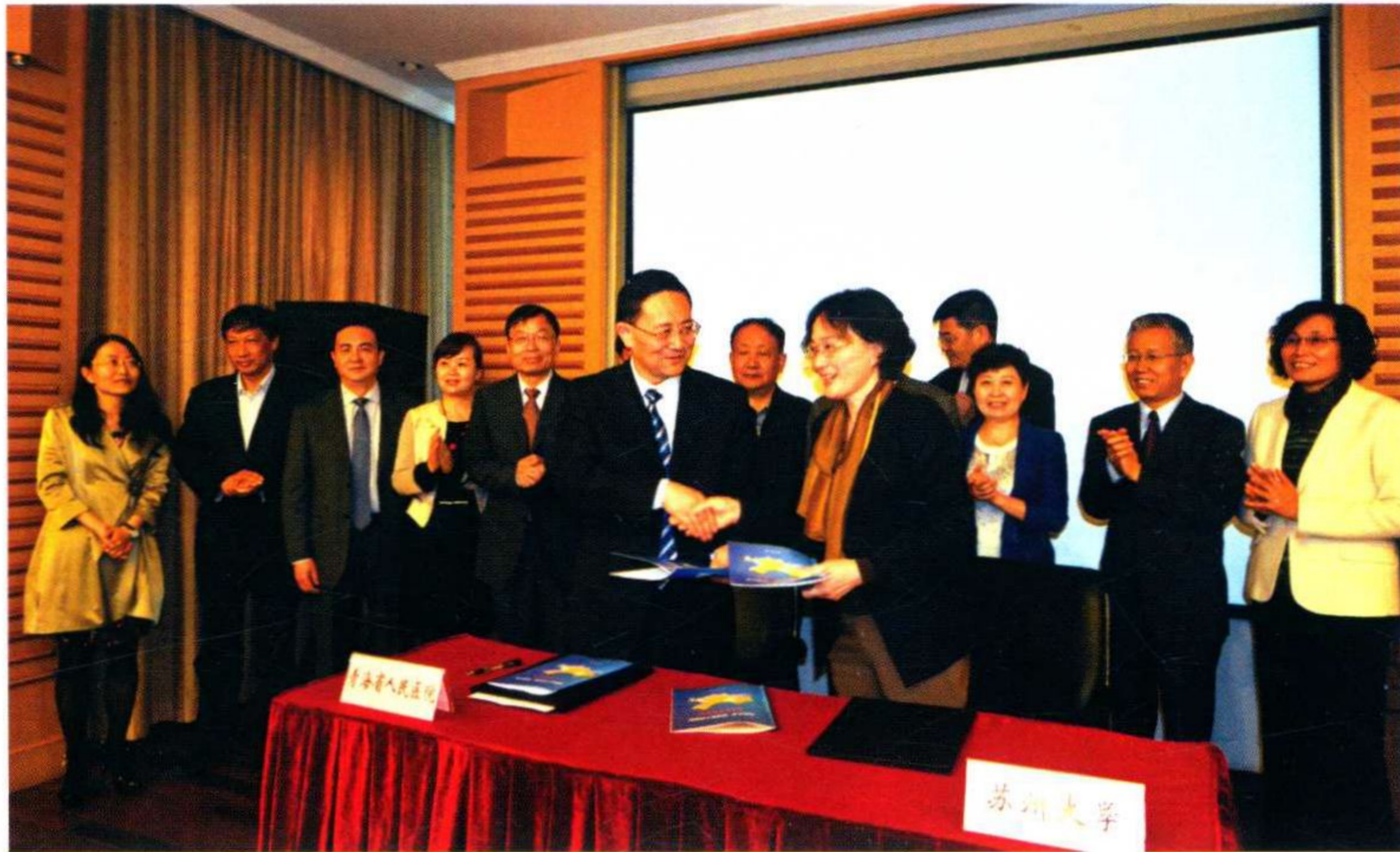
青海省人民医院与学校签署合作补充协议