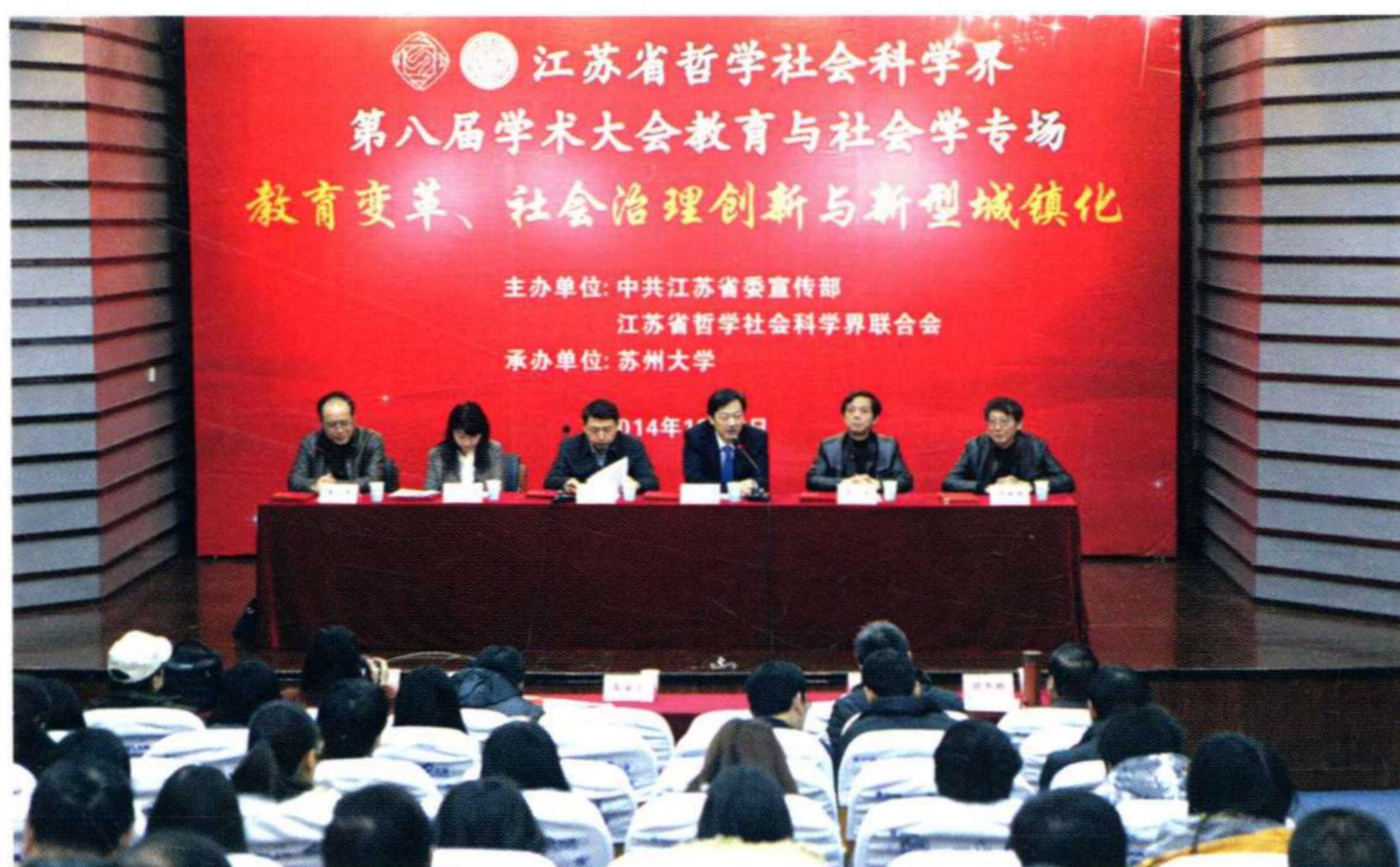
江苏省哲学社会科学界第八届学术大会教育与社会学专场在学校召开