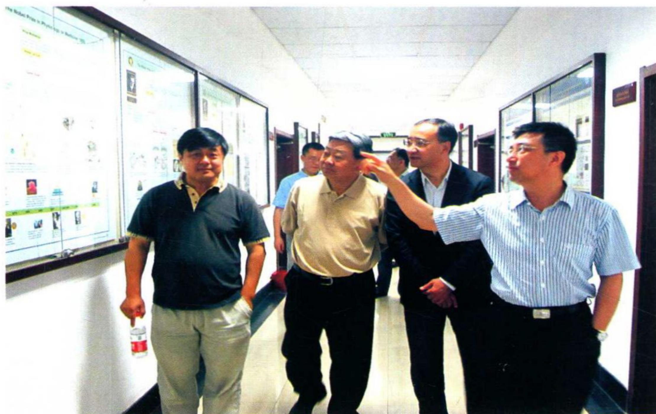
教育部“免疫识别与免疫应答机制的应用基础研究”创新团队顺利通过验收