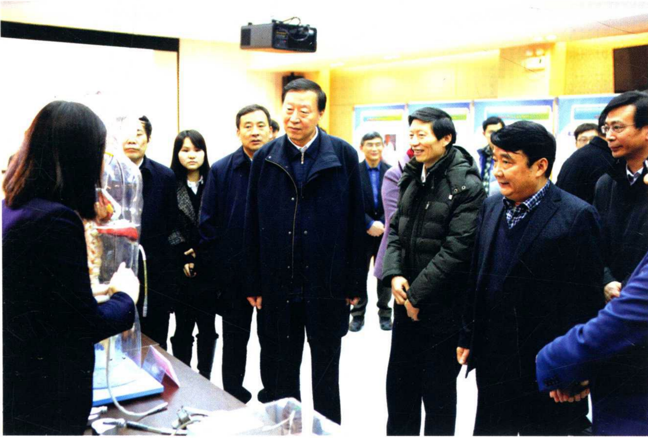
江苏省委书记 罗志军一行到学校 调研