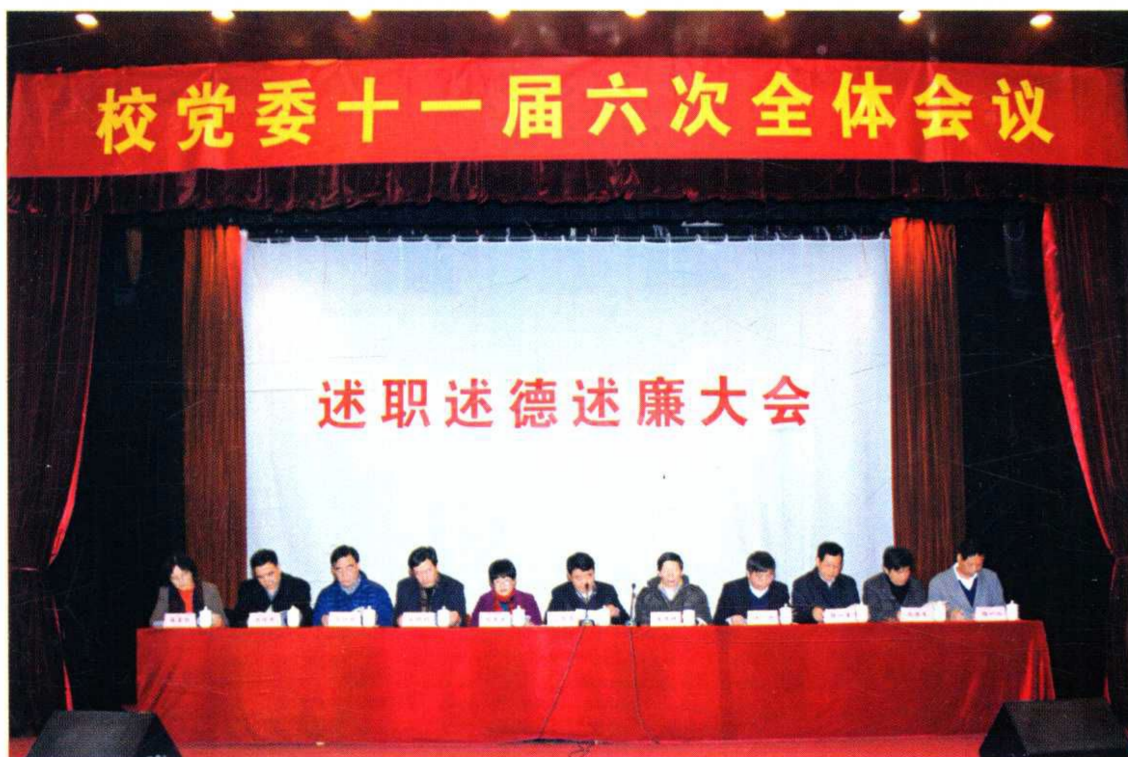
学校举行述职述德述廉大会