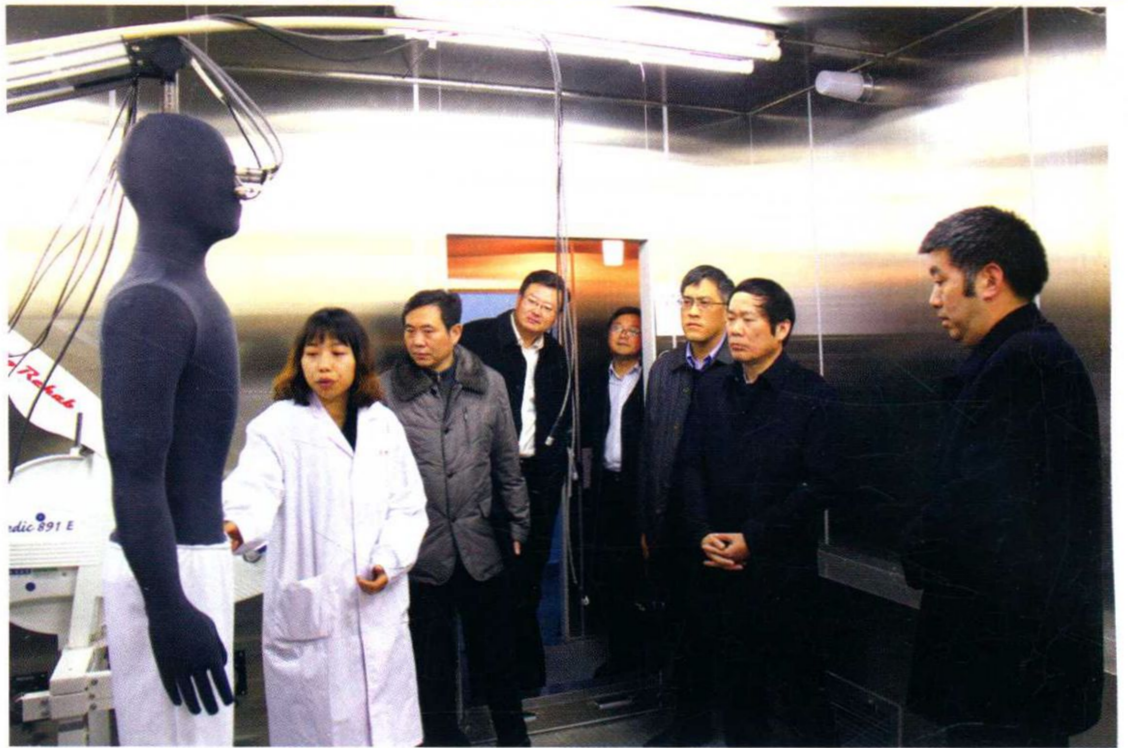
江苏省政协副主席徐南平一行到学校调研