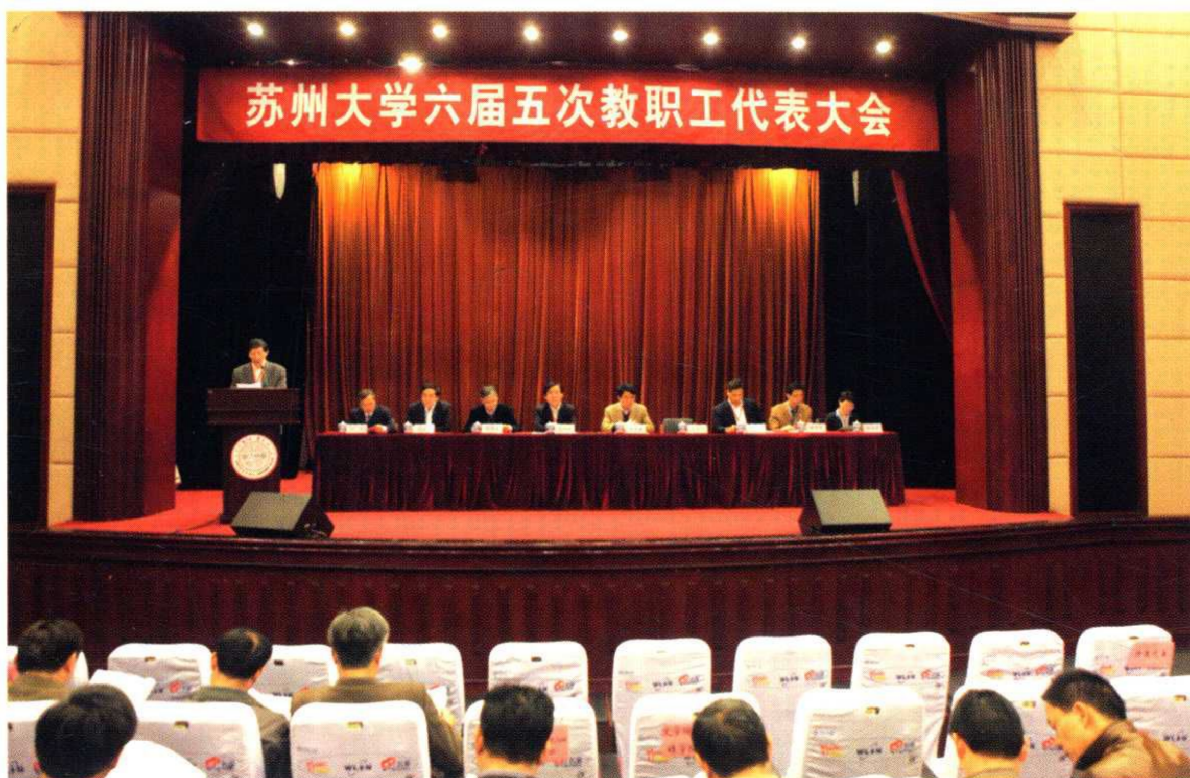
学校举行六届五次教职工代表大会