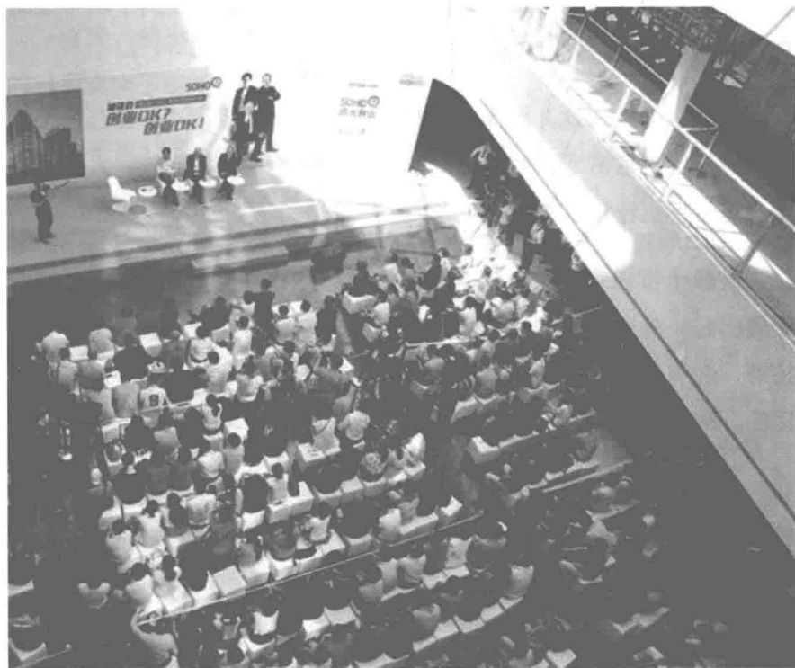
潘谈会现场，雷军、冯仑和潘石屹对谈创业话题。