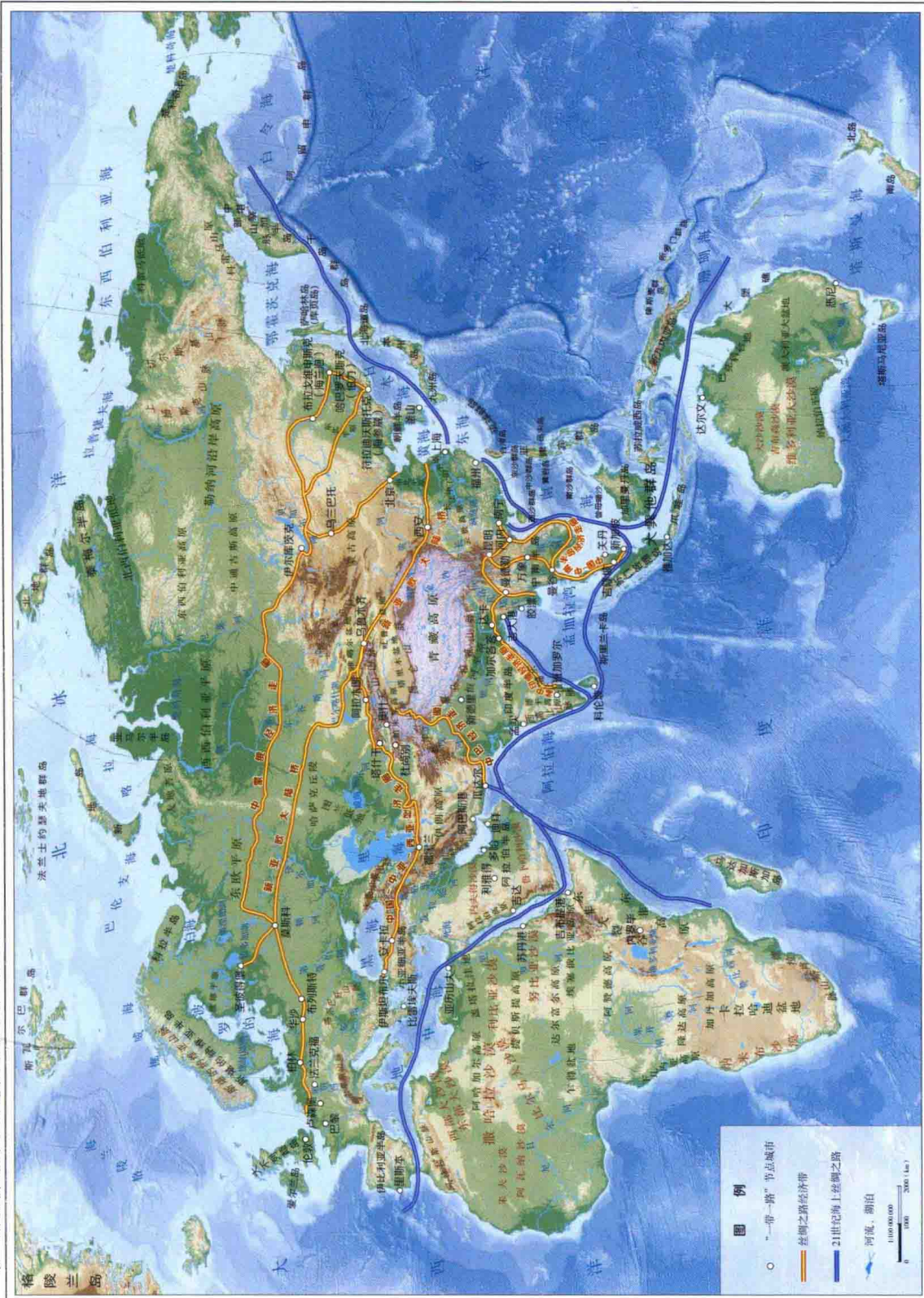
“一带一路”经济走廊及其途径城市分布地势图