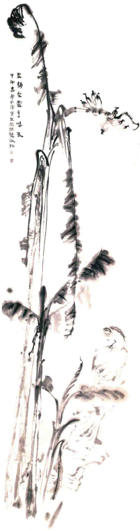
孟静玄雷玄味晨 甲午暮月白凉方生於西雙版地