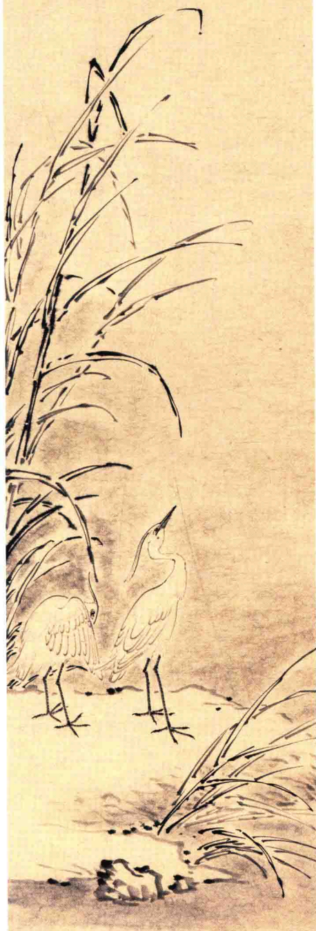
澄怀观道 138cm x 34cm

觀王之迹 觀王之以 甚至 至勇至傑 元之亦不 至傑至 世能以 壯至 守由至 乎手 善化至 乎才至 性人至 人 心操也 立至之 迹以 它 人亦至 友殺 操極 里易 而地 旋殺 操就 乾紀 陸(觀) 操至 地反 覆至 人與 善化 它至 性 而功 性以 以快 九殺 之 可至 乎至 至可 勤靜 事推 推海