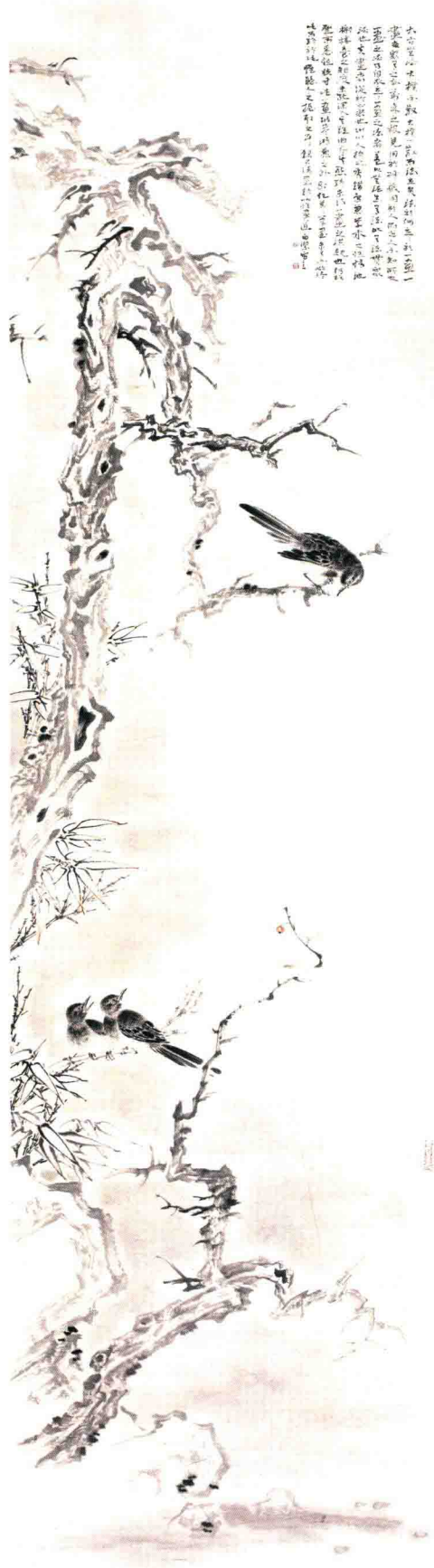
观化观生自在诗之一 248cm x 64cm