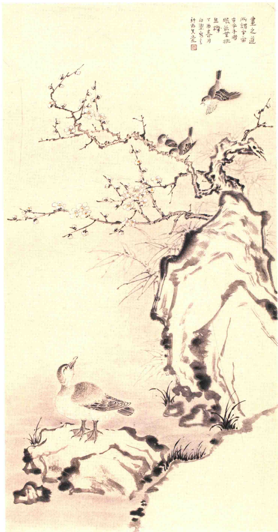
寒香踏雪 138cm X 69cm