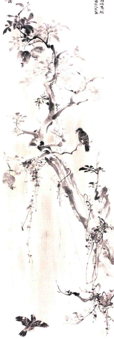
雨过无尘 248cm X 64cm

太古世法不權不報不獲一教不法生矣法施何苦故 一更一畫亦無家之在者各之技用所神德常於之五 之臨亦也似空海至思以空區世法也 性重收也法海空印江有重至多不 似於性法施進路之擬如之有人也 以無見觀空則空時重也疑上意如也 能重而進也脫手靈氣之旋回動 及之小峰然則散八指法固法乃我 宜孔也其之在下不巧高心也 空下而散樣劍真之純深也之 矣此句法亦不致氣變也 用至亦神也法至也法也法也 于姓而法也也也也也也也 於空也人之見也重至也重至 重至也重至也重至也重至也 重至也重至也重至也重至也 重至也重至也重至也重至也