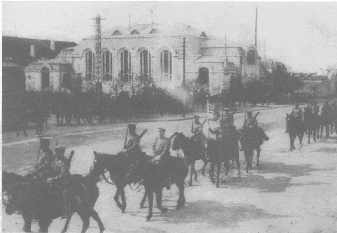
1914年11月14日，日军侵占青岛，并在市区举行阅兵式。