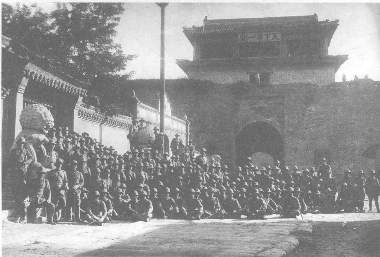
1901年9月7日，英、美、日、俄等11国列强强迫清政府签订《辛丑条约》，日本据此取得在中国北京至山海关铁路12个战略要地的驻兵权。图为日军驻兵山海关。

日本侵华蓄谋已久。1894年，中日甲午战争爆发，日本强迫战败的清政府签订不平等的《马关条约》，割占中国台湾和澎湖列岛等领土，攫取巨额战争赔款和一系列在华特权。图为中日甲午海战。