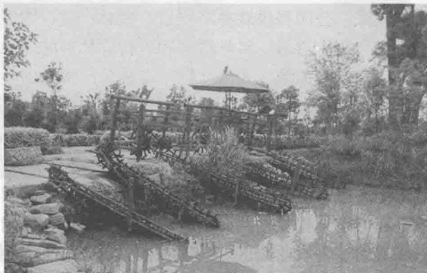
图 1-3 湖南益阳花乡农家乐

(5) 生态农业园。生态农业园主要是指以在园区内建立农、林、牧、渔综合利用的生态模式，形成林果粮间作、农林牧结合、桑基鱼塘等农业生态景观为主的休闲观光农业类型。这种休闲观光农业类型既可为游客提供休闲娱乐的良好环境，又为游客提供多种参与农业生产的机会，强调农业生产过程的生态性、艺术性和趣味性，具有良好的生态效益和社会效益，但一般所需占地面积较大，通常应与其他休闲观光农业类型相结合，才能更好地发挥其良好的经济效益。生态农业园区的主要服务对象为具有较高科学文化知识、较强生态环保意识的居民和学生。例如，北戴河集发生态农业休闲观光园是我国生态休闲观