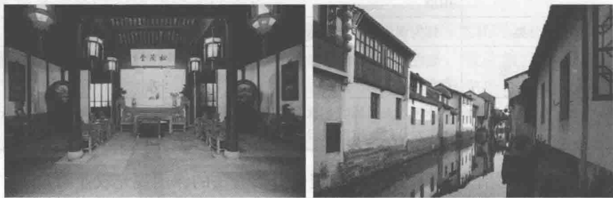
图1-1 江苏苏州的周庄

(4) 自然人文景观型。通过充分挖掘当地丰富的人文资源,有效利用自然景观,开发探幽、访古、赏景等休闲项目,为游客提供休闲活动内容。充分利用休闲观光旅游来提升传统农业产业,带动周边农业产业结构合理调整,使休闲观光农业成为农业产业区域化布局与发展的助推器。例如,浙江省绍兴市上虞区的员外山庄和绍兴县的富盛生态史林、广西南宁的伊岭岩、福建南靖的土家寨、江苏苏州的周庄(图1-1)等。