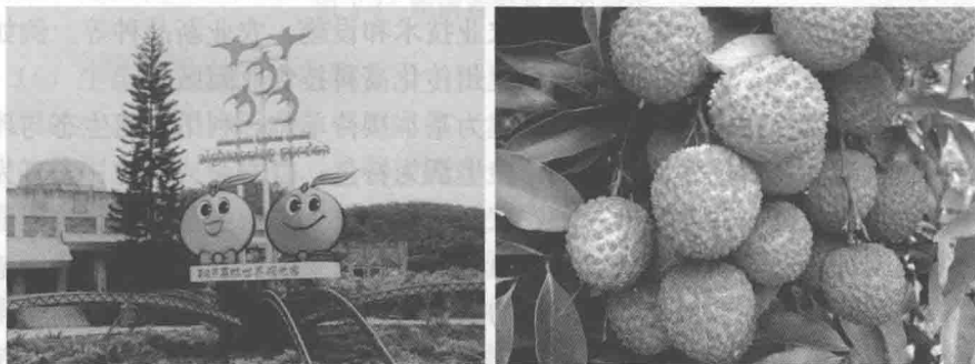
图1-2 深圳荔枝世界休闲观光园