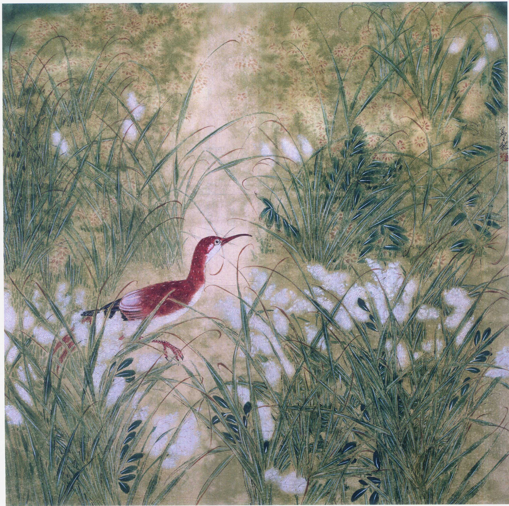
觅 68×68cm 2010