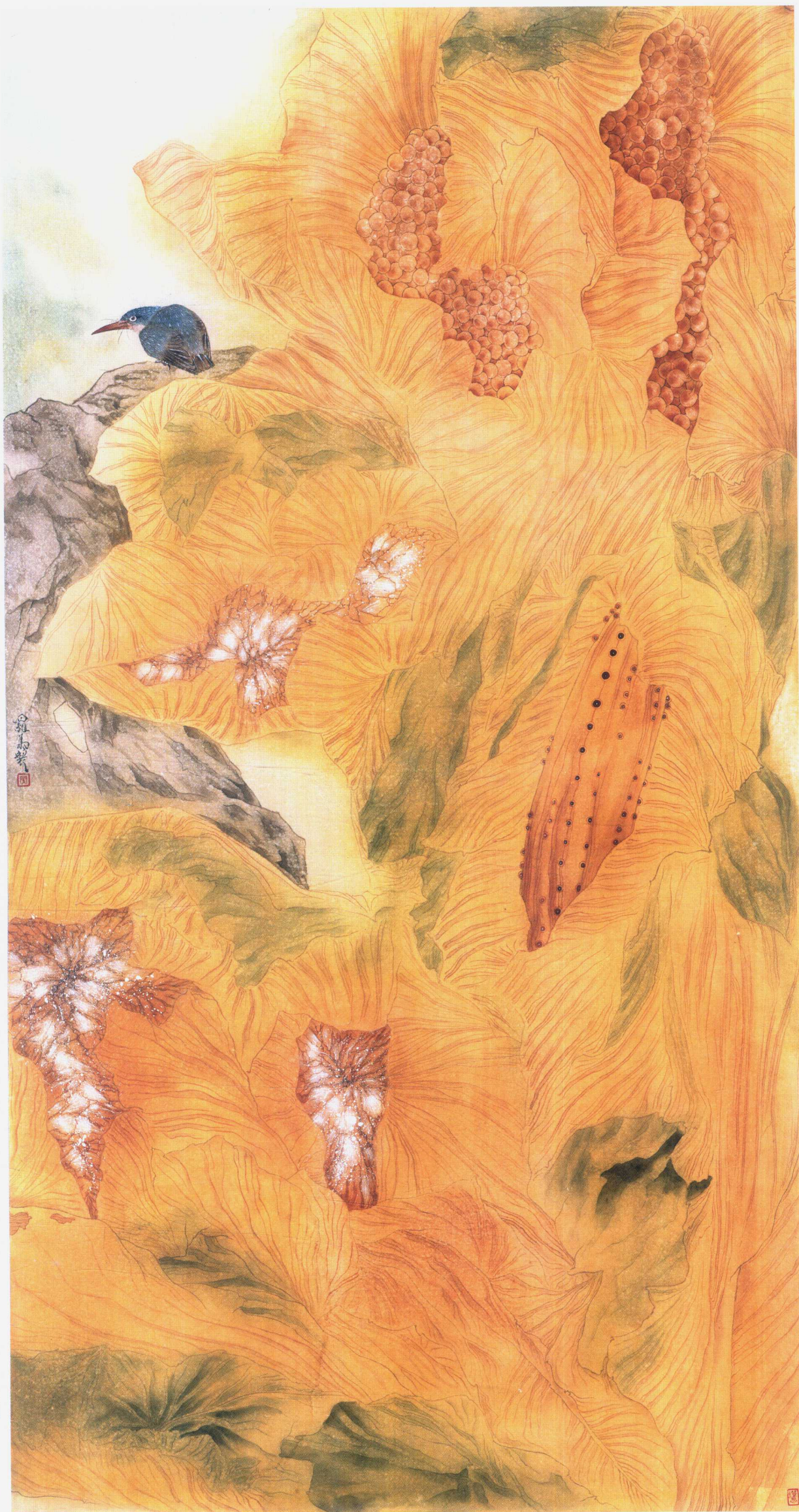
暖阳 95 × 195cm