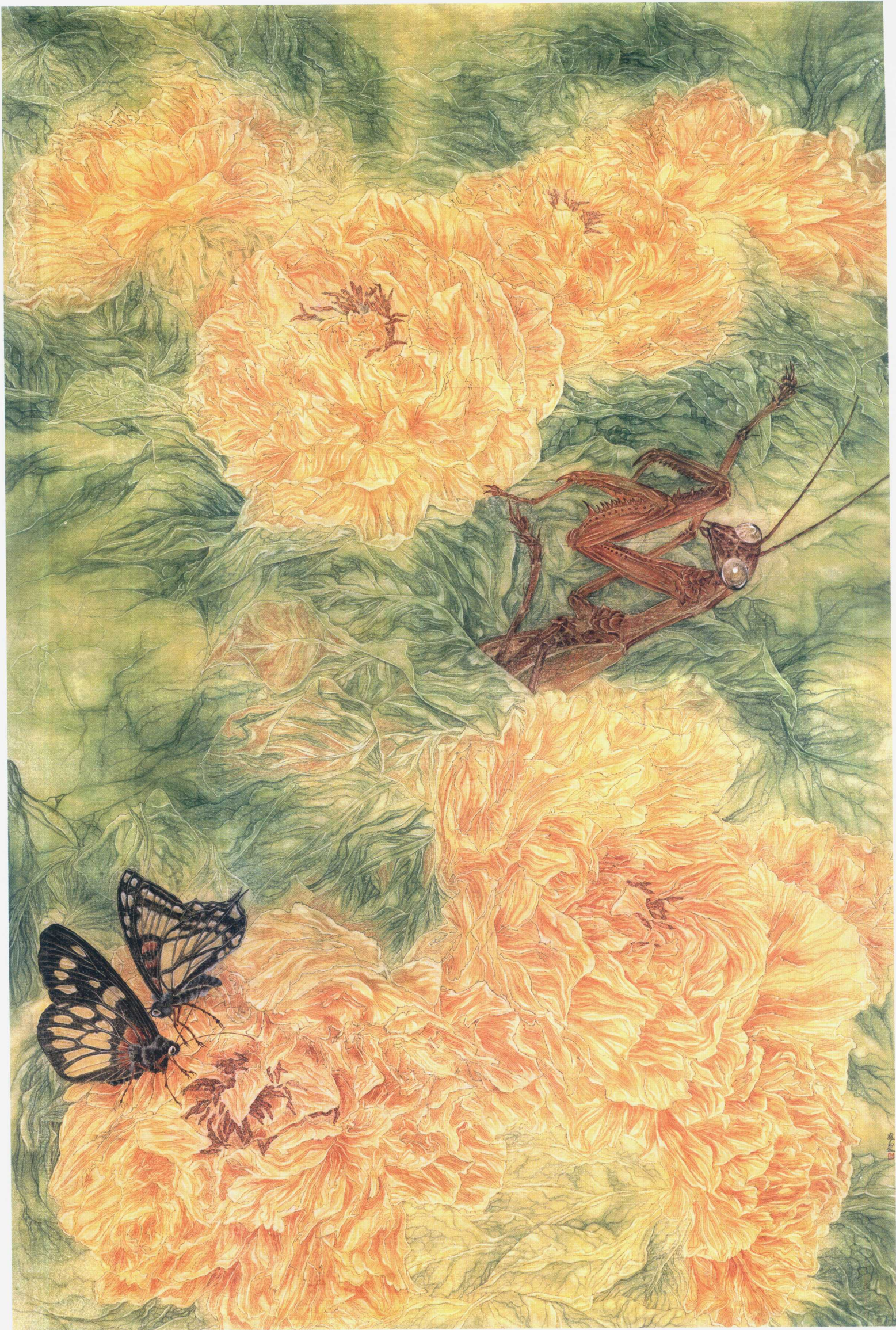
万物生之窥 350 x 220cm 2013