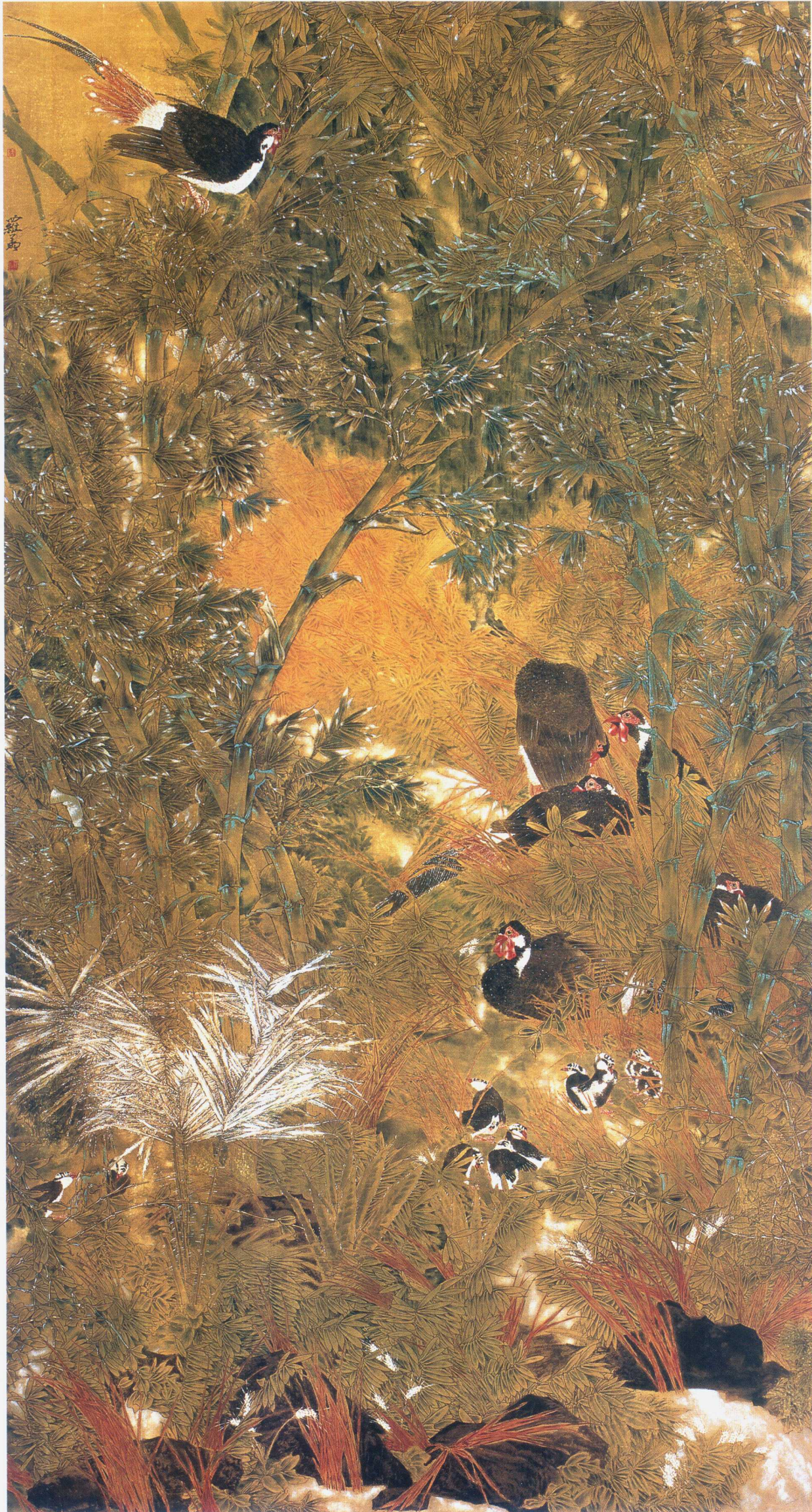
空山新露晚来秋 160 x 330cm