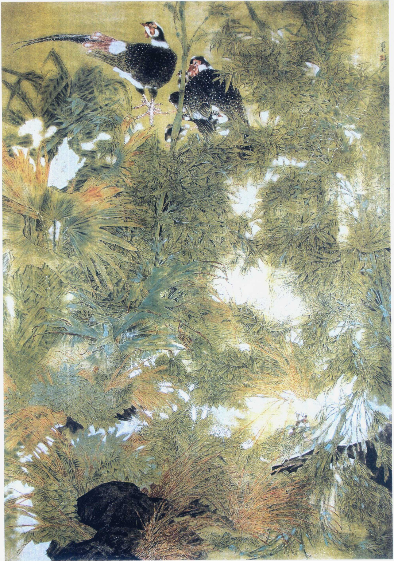
幽林清露浅寒来 150 × 250cm