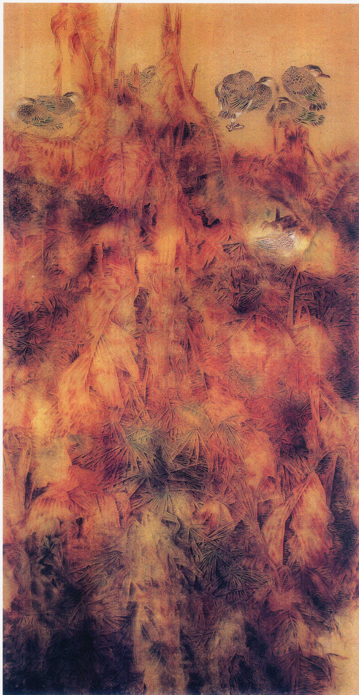
润物细语 130 x 250cm