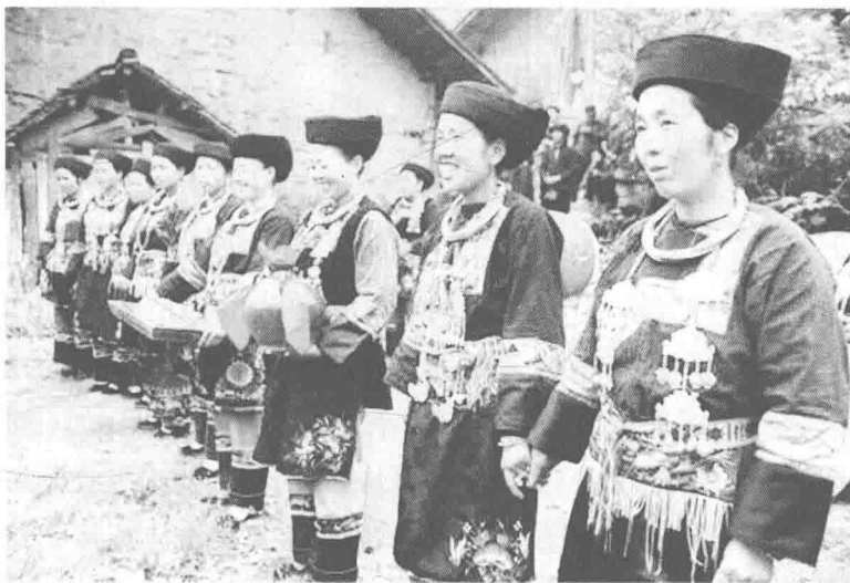
人民热情歌唱场景

民歌是人民群众在日常生产劳作中即兴创作并传留下来的歌曲形式,可分为山歌、小调和劳动号子等类型;民歌具有口头创作即兴性、传承性以及流变性等特点。沅陵民歌有着悠久的历史、多样的题材、丰富的内容和多种表现形式,为广大人民群众所喜闻乐见。