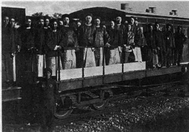
● 开平矿务局官员在运煤火车上合影

北洋水师长期使用的就是“八槽煤”！在清朝出兵朝鲜之后，丁汝昌多次发出与开平矿务局等处交涉补给煤炭、弹药的电报。