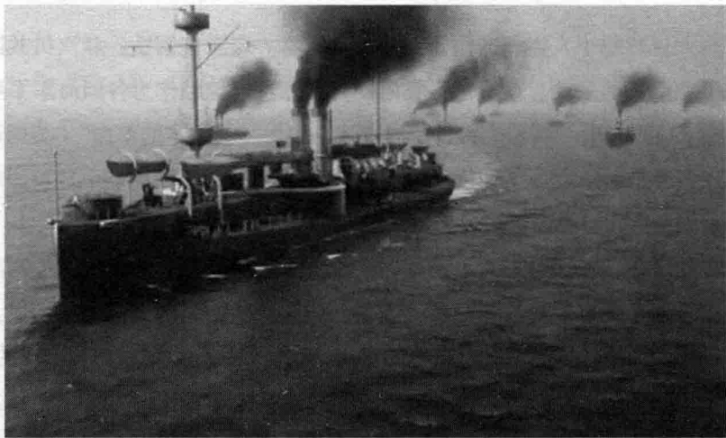
● 北洋水师军舰冒出的浓浓黑烟

无独有偶，中日大东沟海战也是因为北洋水师使用劣质煤炭，直接影响舰队速度，造成海战失利的重要原因之一。北洋水师使用的劣质煤炭，常常产生滚滚黑烟，使得敌方提前就能发现目标。现在证明，在大东沟海战前，日本联合舰队比北洋水师提前一小时发现对手，原因就是滚滚黑烟使北洋水师过早暴露。而日本联合舰队使用的是优质煤，产生的煤烟稀薄，在一望无垠的海疆上是最好的掩护。