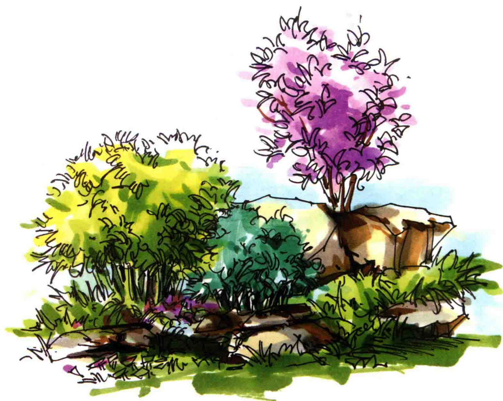
图 1-4 植物组合小品