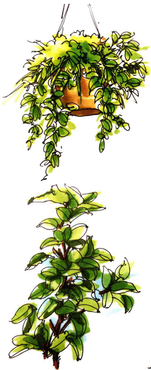
图 1-6 单株植物

景观设计中常见的植物大致可分为藤本植物、木本植物及草本植物。植物学是一门深奥的学科，内容涉及植物生理学、植物病理学、植物生态学、地理学等诸多领域。此次编书的目的是用线条和色彩表现植物，讲解手绘植物及植物景观的表现步骤与技巧。