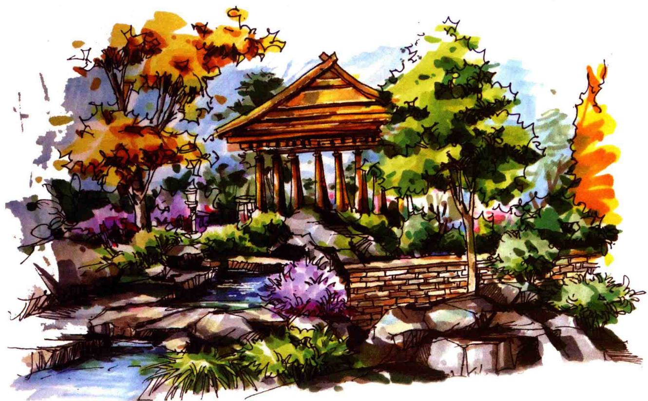
图 1-5 公园一景