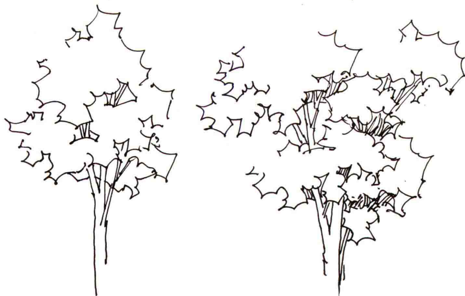
图 1-9 树形对比