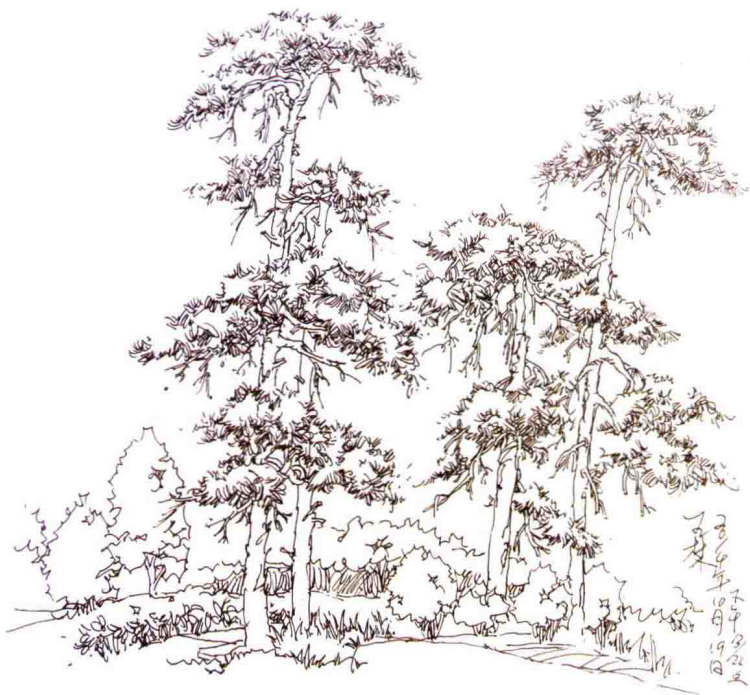
图 1-3 松树小景

园林景观的意境，往往是通过植物自身的文化内涵来实现的。植物作为园林景观设计的重要组成部分，是营造绿色环境的生命载体，不仅具有绿化、美化作用，而且还兼有形态、色彩、审美等美学信息。通过植物这一载体可以反映出造园艺术的审美情趣、价值取向、生活品味等。人们畅游在优美的环境中，身心愉悦（图 1-3 ~ 图 1-5）。