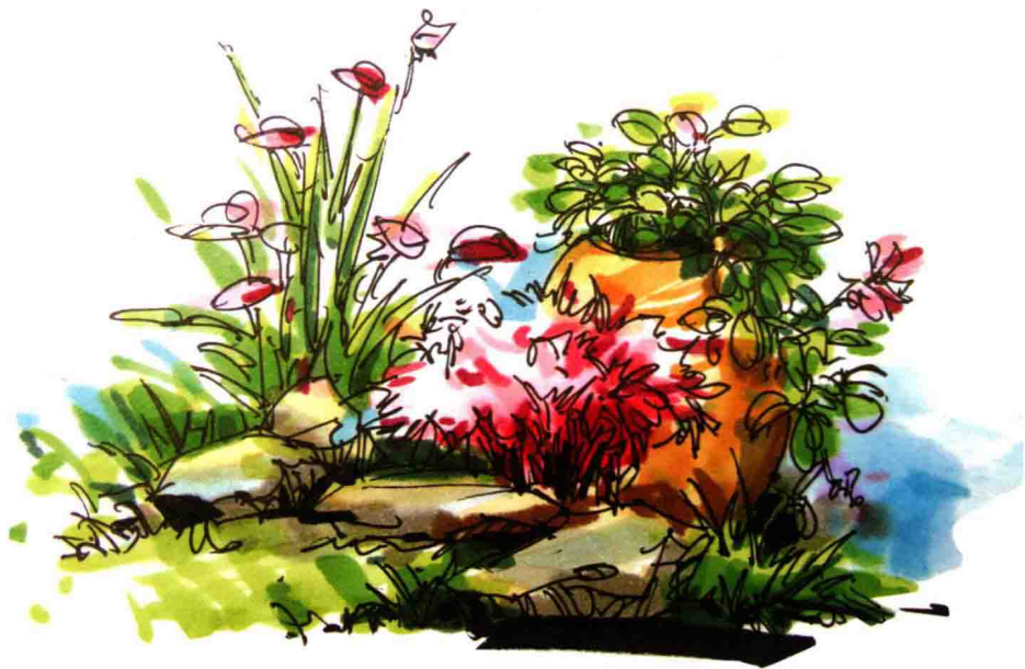
图 1-2 植物组合

植物有表现季相时序的功能，叶、花、果的季节变化，让人联想到春、夏、秋、冬的季节变化。植物与山石、地形及建筑相配植，可遮景、框景、透景与阻景，创造魅力空间和雅致意境。