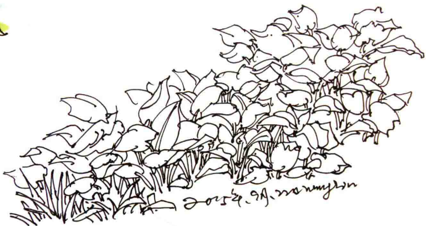
图 1-7 植被

植物的手绘表现不能孤立地看，同一种植物因其所处的空间、地域不同，表现的最终视觉效果也有差异。通过植物手绘学习，大家要学会观察，通过亲近自然了解植物，学会以感性和理性交融的思维方式来看待问题、思考问题，有效吸收和借鉴大自然给我们的启发和感悟（图 1-6、图 1-7）。