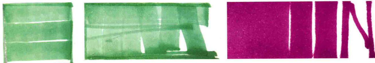
图 1-12 平行笔法

（1）排笔法。起笔、收笔均保持笔触平行或垂直于纸面，下笔力度要均匀，速度适中，除枯笔的特殊效果外，从起笔到收笔，笔触始终如一（图 1-12）。