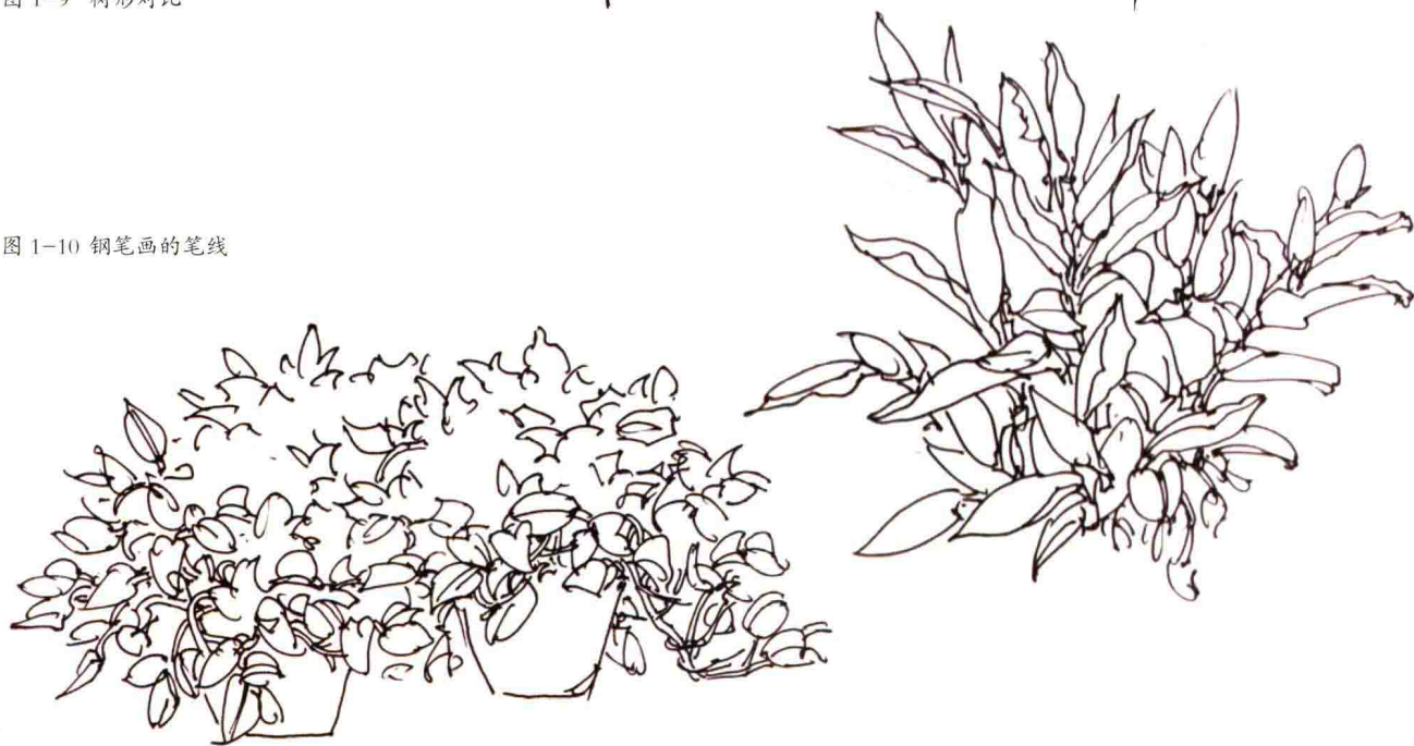
图 1-10 钢笔画的笔线