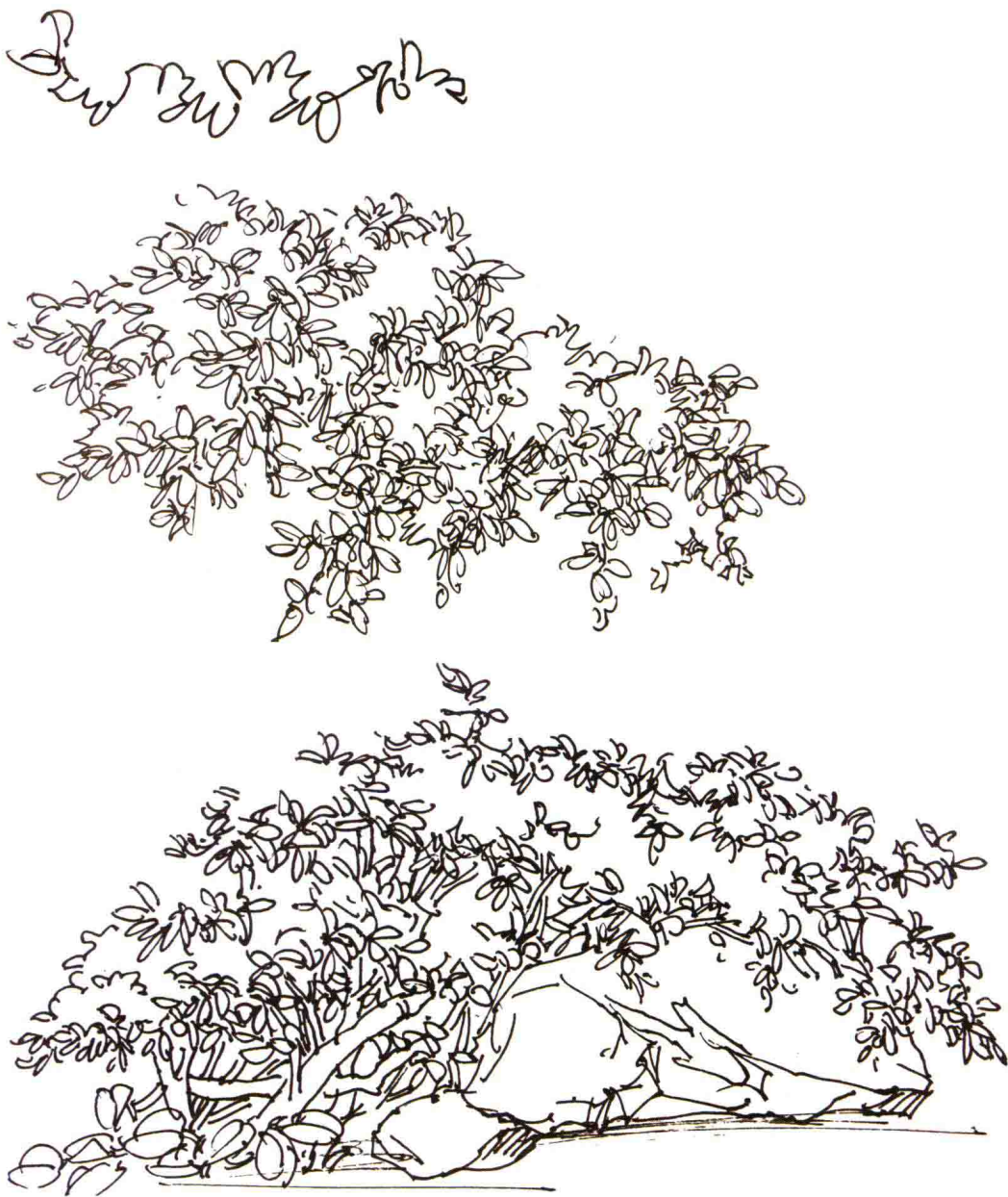
图 1-8 钢笔线条及表现

粗细及力度变化要根据所描绘对象特点，以此来表达对象的形体关系和空间关系。在练习中要注意线条快慢与轻重的变化，起笔收笔要果断（图 1-9、图 1-10）。