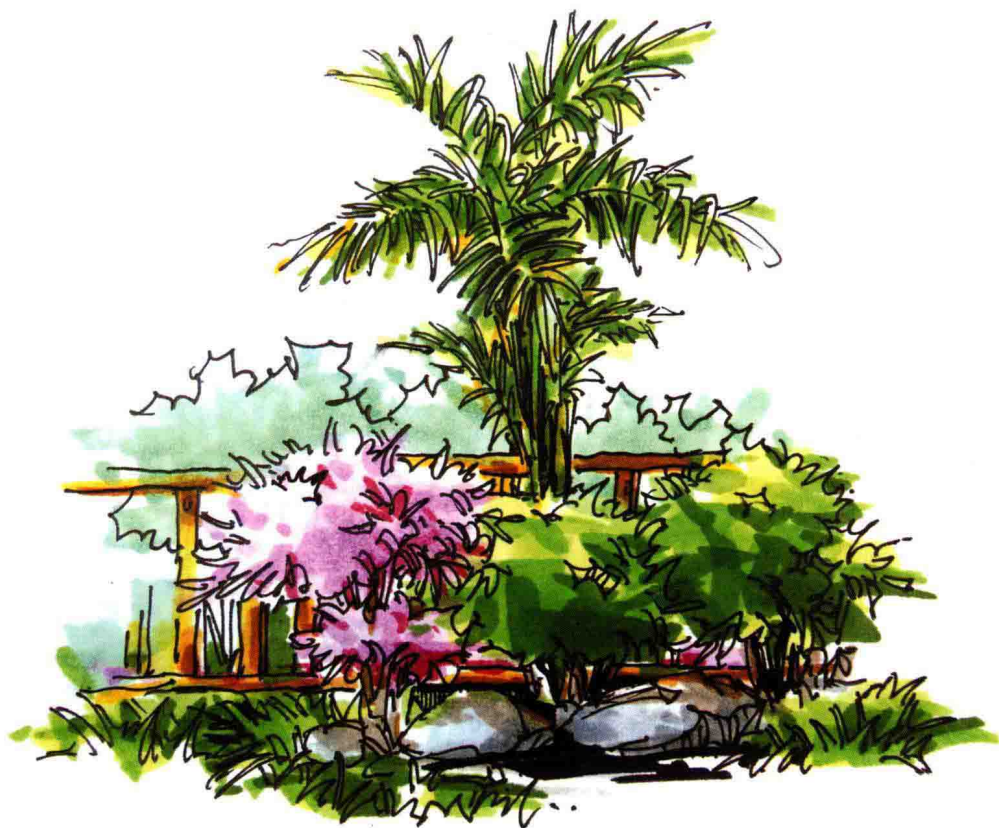
图 1-11 马克笔笔触表现

一般来讲，马克笔上色需按照先浅后深的上色原则，运笔力度宜均匀，起笔收笔要轻松自然，笔触叠加次数不宜过多，避免色彩混浊。马克笔上色速度宜快速一些，不要长时间停顿，以免颜色渗开，破坏画面效果。马克笔运笔的方向和笔头切入角度要根据所画植物的姿态来确定，不宜机械地重复表现，笔触间要有变化（图 1-11）。