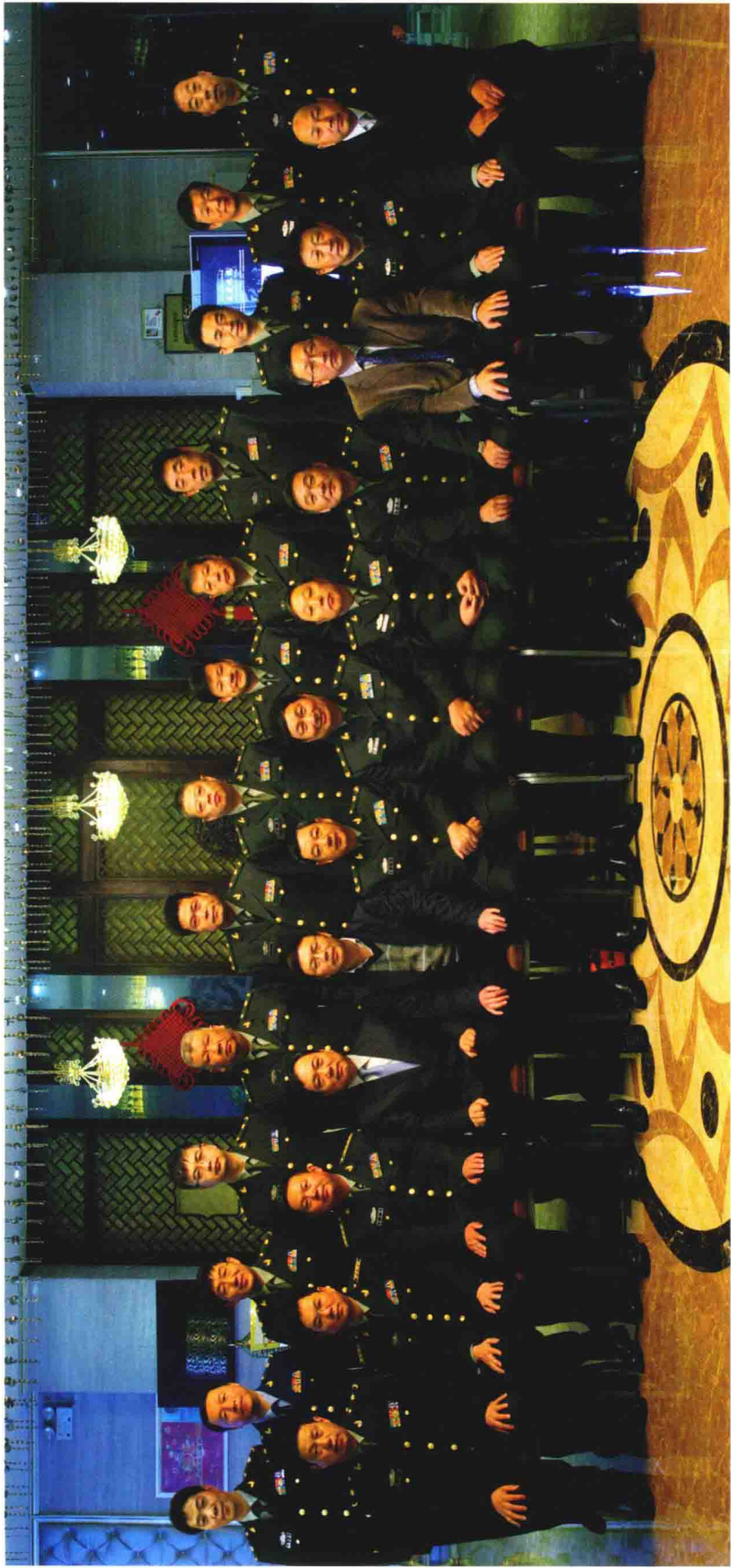
《中华战创伤学》总主编付小兵院士与分卷主编合影