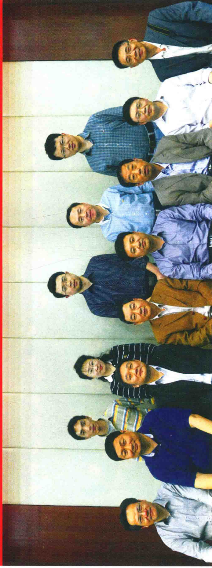
《中华战创伤学》第一次主编会议参会人员合影