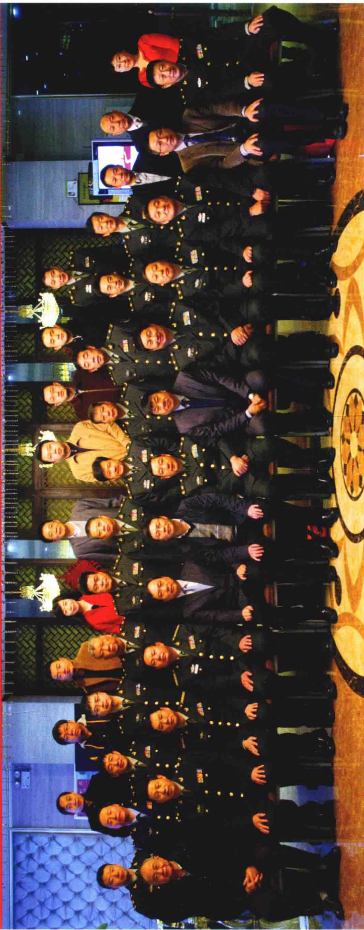
《中华战创伤学》第三次主编会议参会人员合影