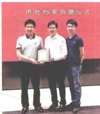
2016年6月9日，广东省档案局（馆）举办国际档案日系列活动。省委常委、常务副省长徐少华（中）为笔者、张樟奇（右）颁发侨批档案捐赠证书