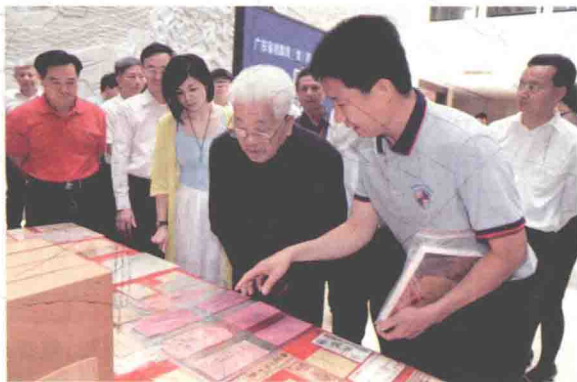
2016年6月9日，广东省档案局（馆）举办国际档案日系列活动。笔者为出席活动的广东省委原书记、省政协原主席吴南生（前排右二）等领导介绍潮汕侨批