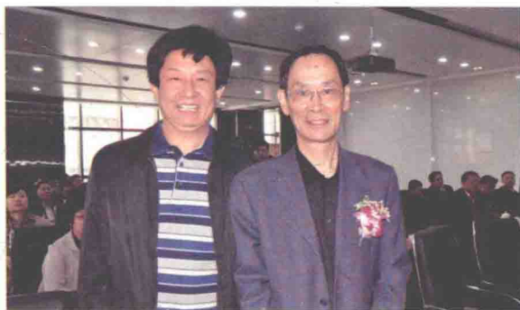
2014年12月12日，潮阳区博物馆新馆揭幕。笔者与出席仪式的国家文化部原副部长、国家博物馆原馆长潘震宙（右）合影