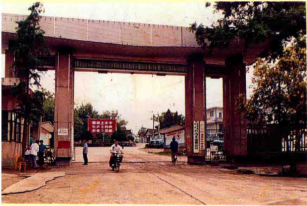
宜春汽车运输公司