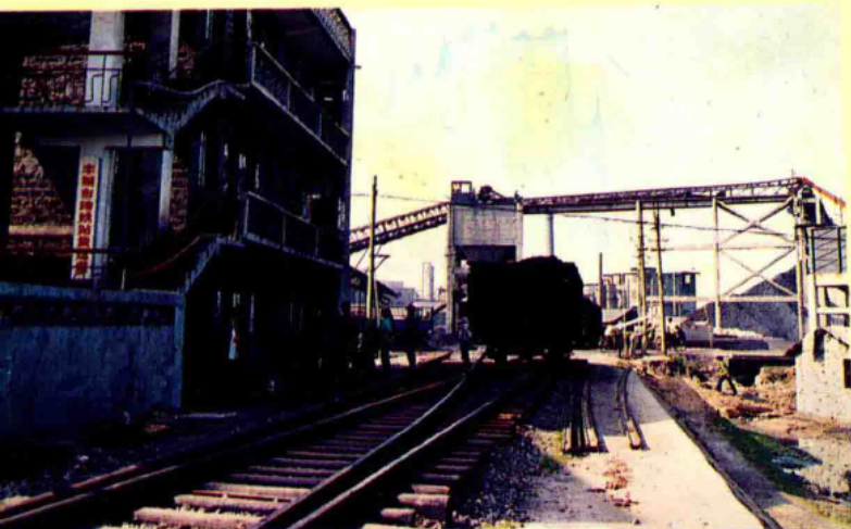
丰城市地方铁路管理站