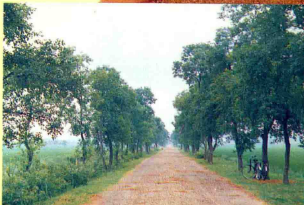
上高至八角亭县道