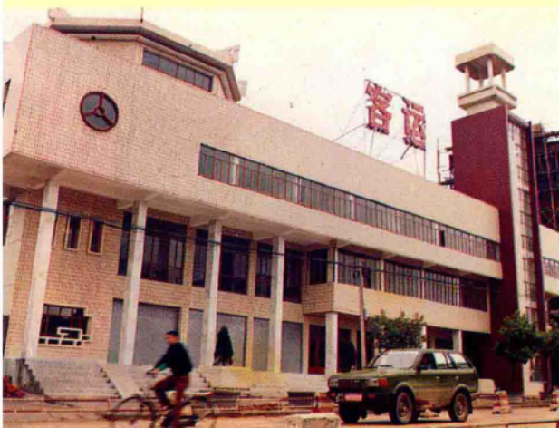
宜丰县汽车运输公司