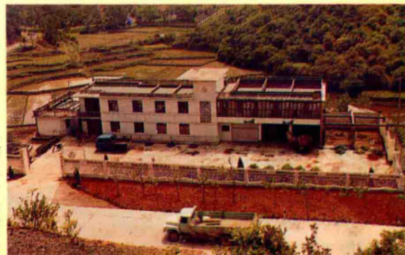
三阳养路队道班房