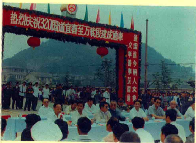
320 国道宜万段通车典礼