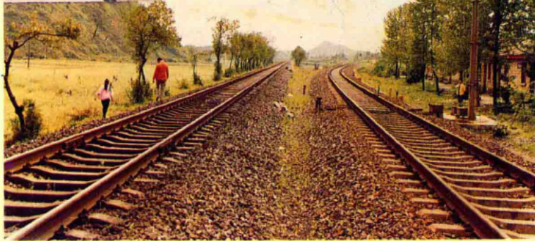
宜春下浦铁路复线