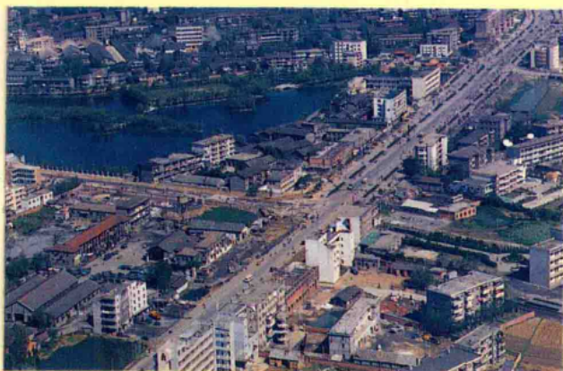
105 国道通过樟树市区