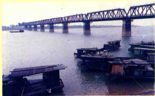
樟树赣江铁路大桥