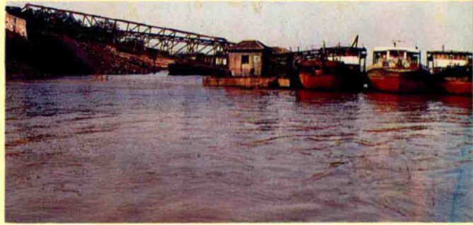
丰城龙头山煤运码头