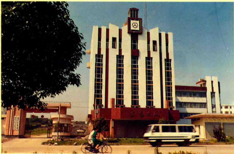
宜春地区交通局交通大厦