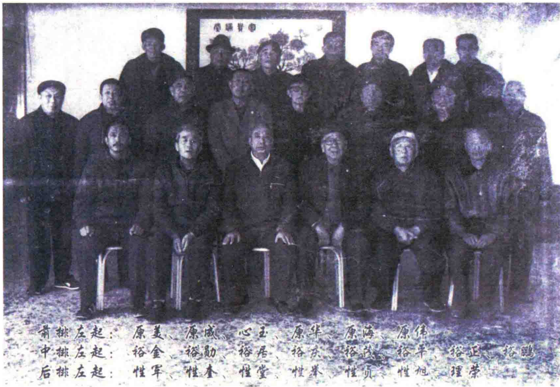
2011年版《黄氏家谱》全体编委合影