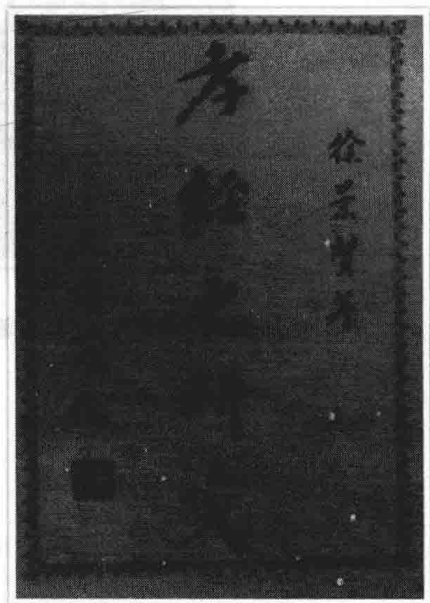
林志钧先生题,太炎先生检署,徐氏所著《孝经之研究》书影