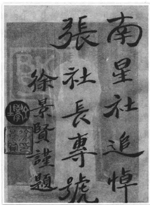
徐景贤墨迹(《南星杂志》1933年第2卷第8期)