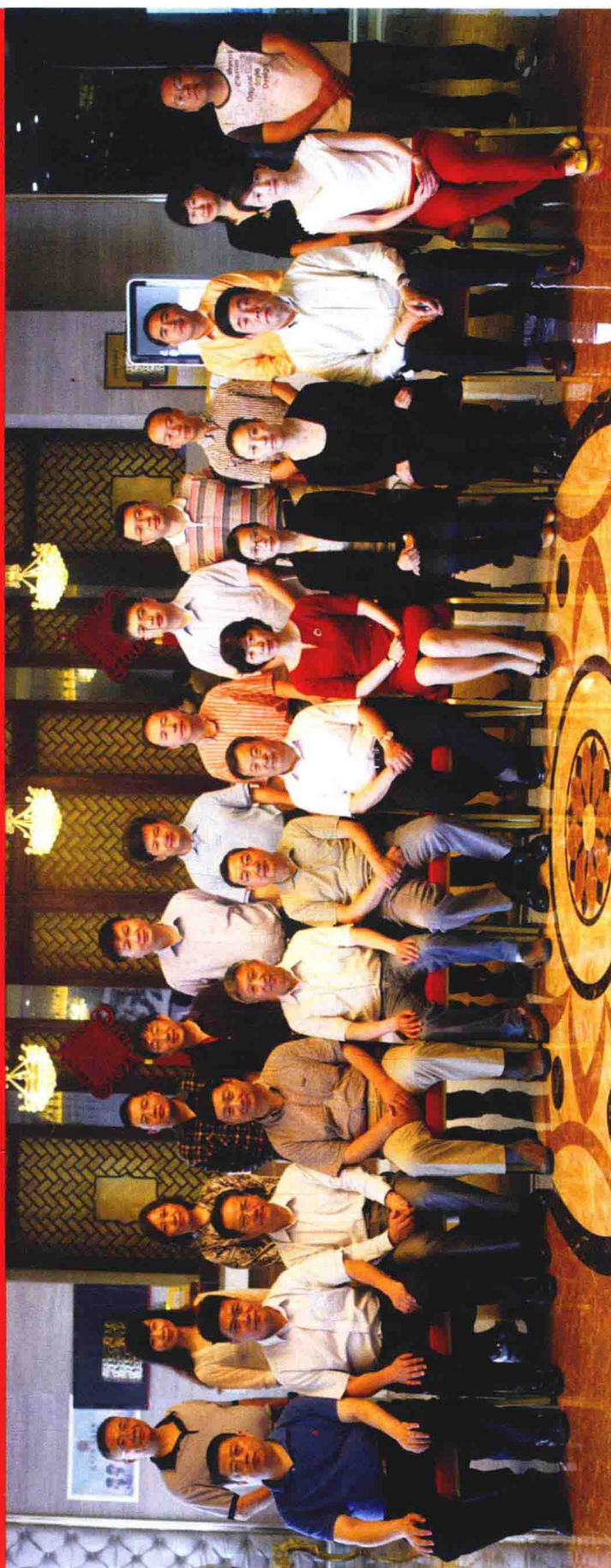
《中华战创伤学》第二次主编会议参会人员合影