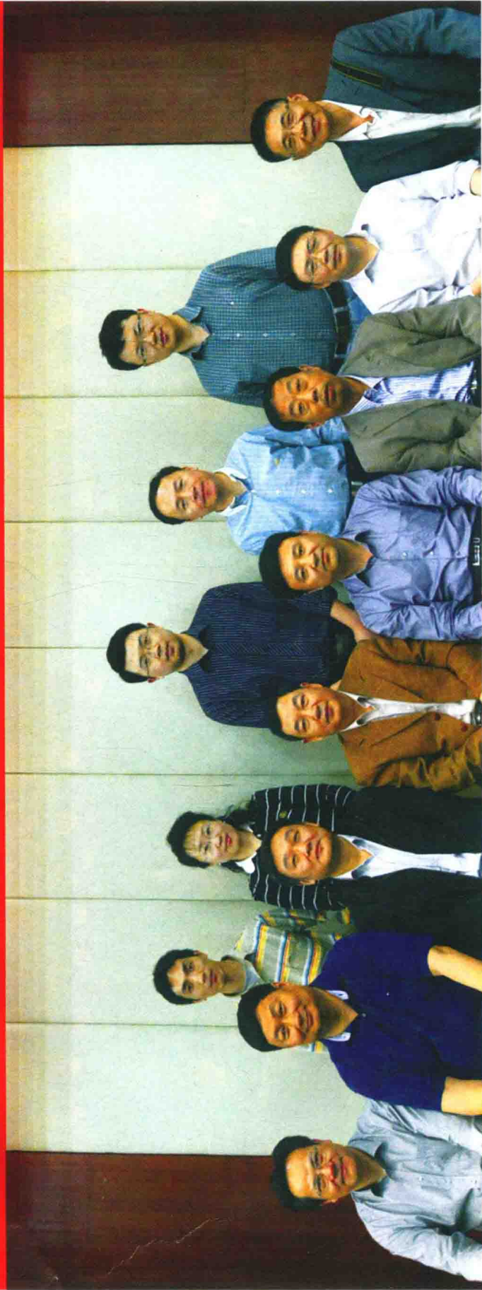
《中华战创伤学》第一次主编会议参会人员合影