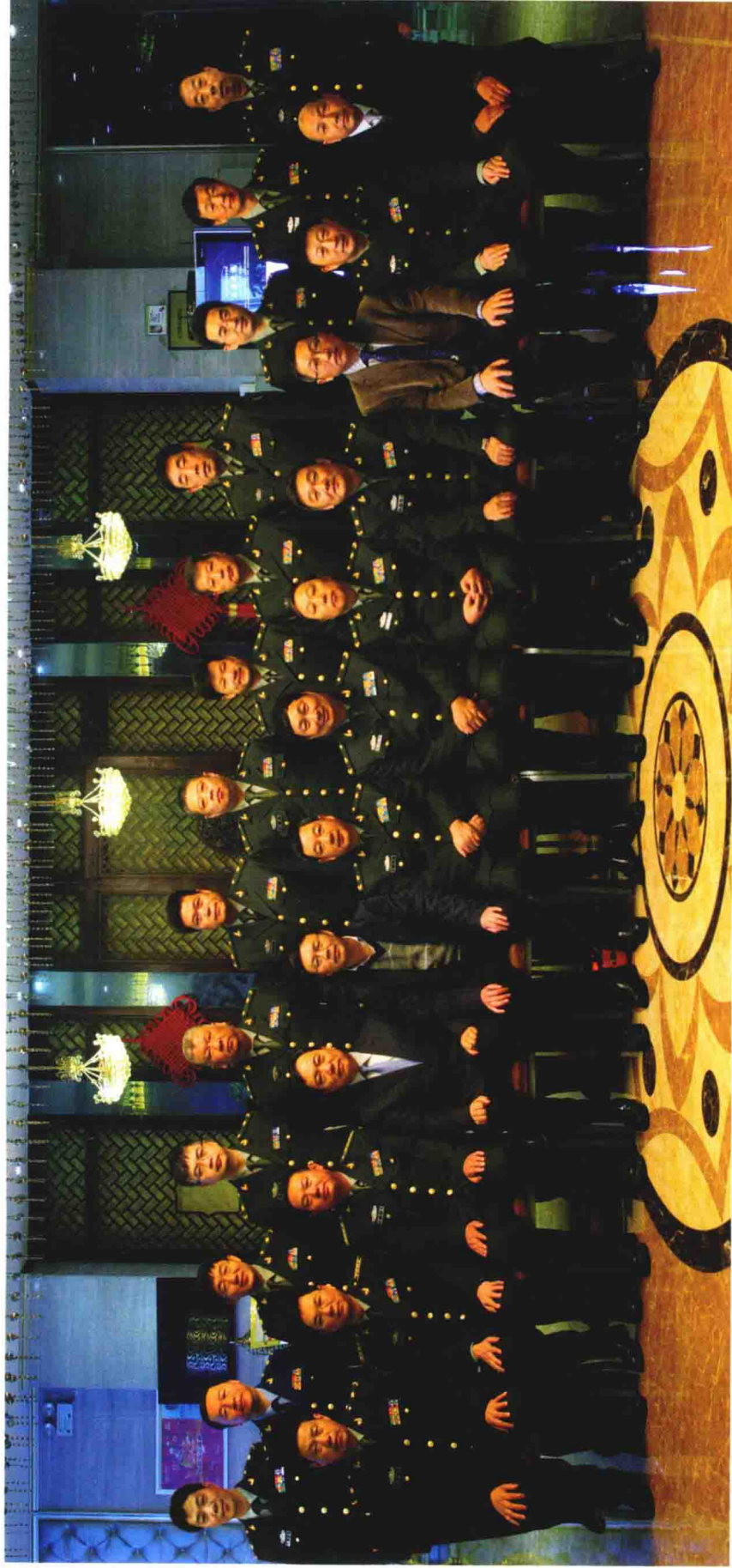
《中华战创伤学》总主编付小兵院士与分卷主编合影