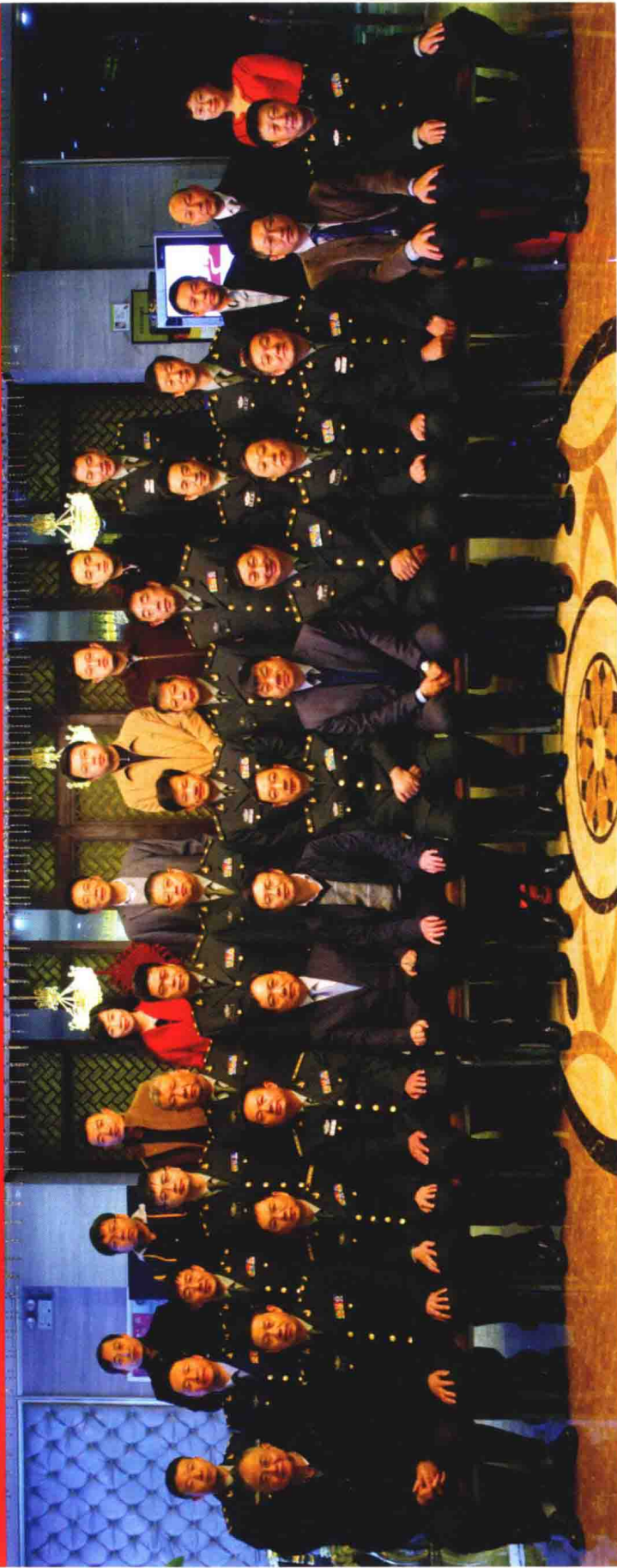
《中华战创伤学》第三次主编会议参会人员合影