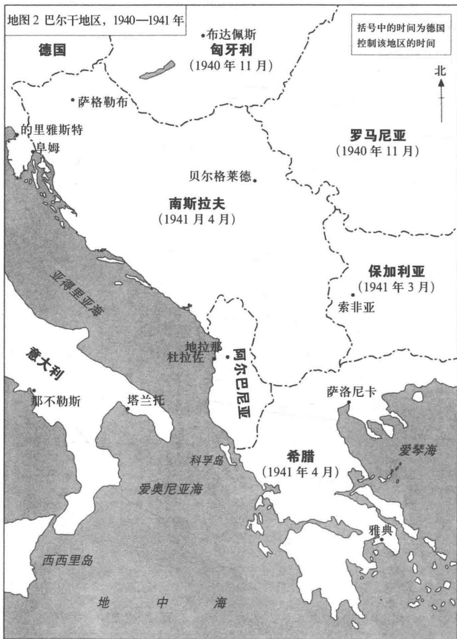
地图2 巴尔干地区，1940—1941年