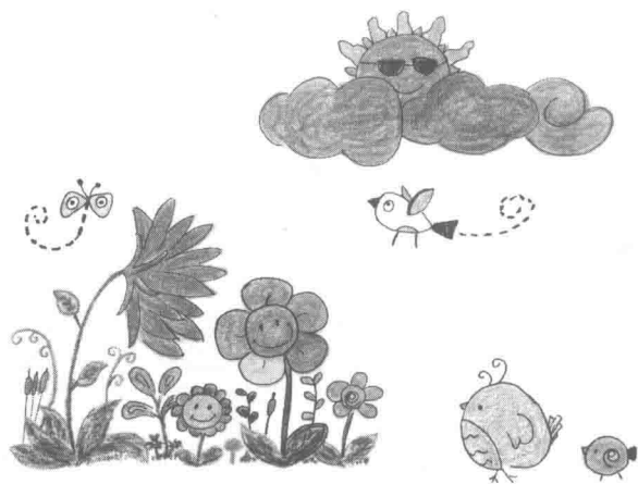
晴空万里的早晨