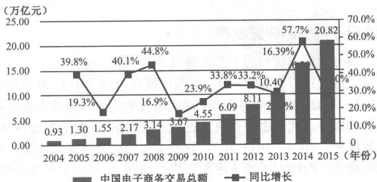
图 1-1 2004—2015 年中国电子商务交易额增长情况

2015年,中国全社会电子商务交易额为20.8万亿元 ② ,同比增长约27% ③ ,超额完成了《电子商务“十二五”发展规划》提出的发展目标 ④ ,实现了电子商务交易额翻两番。电子商务已经成为国民经济发展的强大助力。图1-1反映了2004年以来中国电子商务交易总额持续增长的强劲势头。