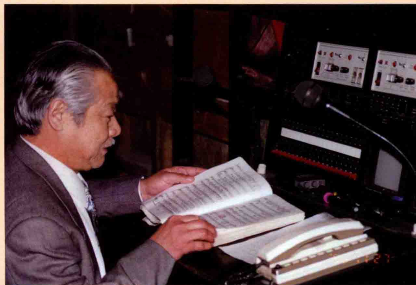
作者在北京保利剧院的舞台监督工作台前