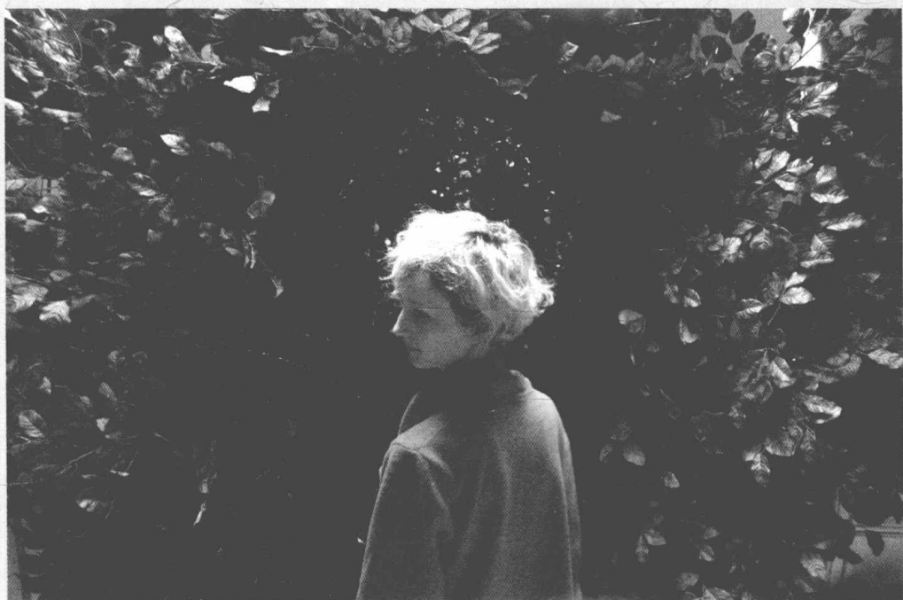
《质数的孤独》（ La solitudine dei numeri primi , 2010）