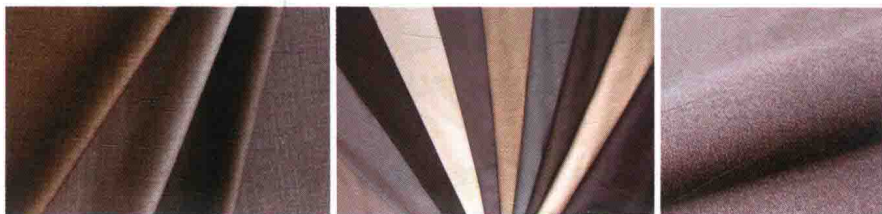
▲ 图 1-4 面料

传统职业装与时尚职业装在面料的选择上并没有太大的区别,只是时尚职业装更注重“板型的创新、细节的突显、穿着的合体”,面料的选择更注重不同工种在不同工作环境下的综合体验感及穿着舒适度(图 1-4)。面料的选择也会依季节的变化而不一样,如夏天选择的面料一般会比较清爽,色系以白色、粉色等淡色系为主,既能符合大众审美需求,又能符合透气、耐穿要求。而冬天面料的选择会更偏向于较柔软、保暖性良好的透气性面料,而面料的色系也会以温和、灰暗色系为主。