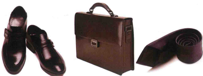
▲ 图 1-3 配饰