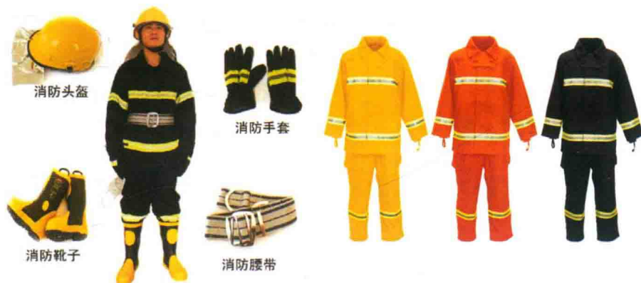
▲ 图 1-2 消防防护服

职业装中的职业工装因工作环境的差别，如何保护作业人员的身体不受作业环境中的有害因素的侵害，改善和提高工作效率，以保证作业人员准确、完全、高效地完成工作任务，不同的产业服装有不同的功能防护要求（图 1-2）。