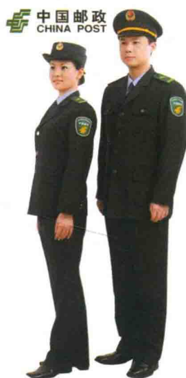
▲ 图 1-1 中国邮政制服

职业装的标识性旨在突出两点：社会角色与特定身份的标志以及不同行业、岗位的区别。可归纳出的标识性作用为：树立行业、角色的特定形象，便于企业识别，弘扬企业理念的精神，利于公众监督和内部管理，能提高企业的竞争力。如证券公司的“红马”，象征和平的绿色邮递员装等（图 1-1），职业装的标识性具有服装精神性方面的重要性质，从中可以区别着装者的社会经济地位、工作环境文化素质和性别等差距，可以通过款式与色彩搭配、服饰配件和企业标志的不同来实现。职业装具有完整的标识识别系统，从而形成职业装的独特鲜明的标识性。